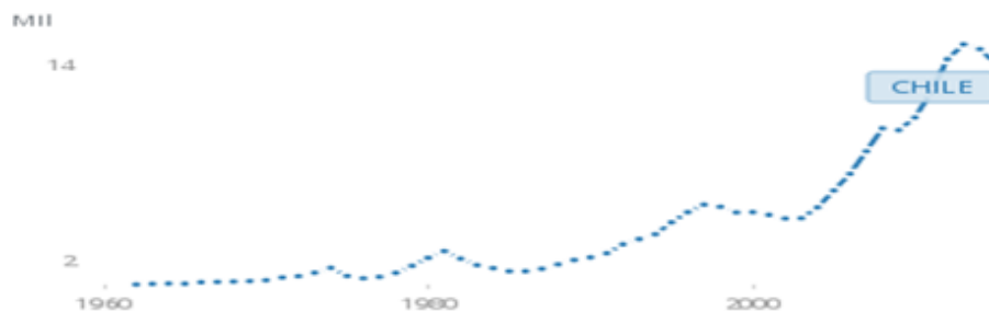
Gráfico N° 7. Producto Interno Bruto