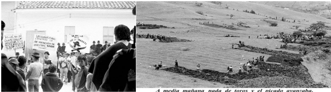
Manifestación frente a la cárcel.

varios municipios, dice Jaramillo “las primeras recuperaciones de tierra no se hizo esperar. Ante el hecho de que las autoridades públicas estaban aliadas con los terratenientes y gamonales, estas luchas indígenas por la tierra adquirieron el carácter de insurrección y como tal fueron reprimidas por el gobierno. Muchas fueron las detenciones y también los muertos.” 45