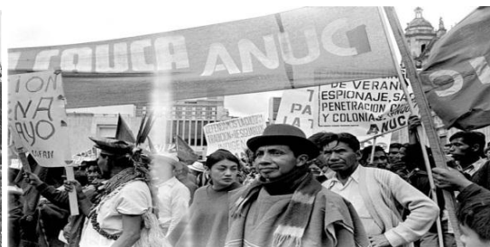
Participando en la gran manifestación campesina e indígena en Bogotá. Agosto 31 de 1974