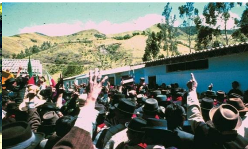
Momento en que el Cabildo presenta ante el pueblo Misak la bandera guambiana.