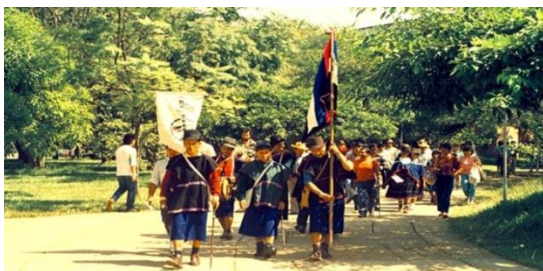
Fuimos de ciudad en ciudad, de universidad en universidad, de barrio en barrio, de sindicato en sindicato, pregonando la verdad sobre la situación .

Jambaló y Silvia, se vieron grupos de pájaros junto a la fuerza pública, contratados por hacendados asesinando líderes indígenas y líderes de organizaciones sociales .