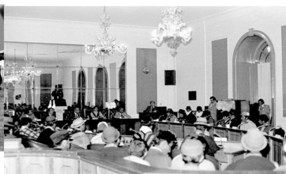
En Bogotá nos presentamos ante el Senado de la República para que oyera a los gobernadores sobre la situación. Bogotá, noviembre, 1980

En la década de 1990 se dió una transformación en la lucha por el reconocimiento de la propiedad colectiva de las tierras indígenas de resguardo, en un reconocimiento legal como pueblos indígenas y comunidades espaciales. En ese sentido el AICO, se fundamentó en una perspectiva de reivindicación política con el Estado colombiano, frente a la participación democrática por parte de pueblos indígenas organizados en cabildos, en una discusión política gubernamental de las etnias.