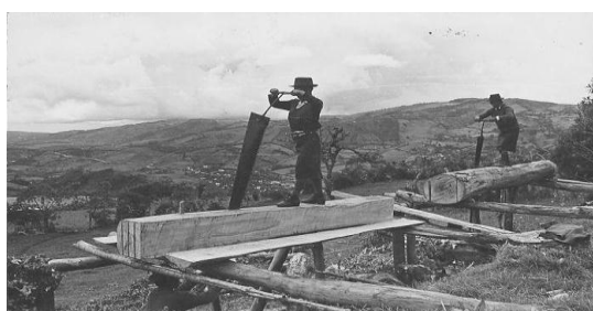
Terrajeros de El Gran Chimán, Guambia 1968

Dice al respecto Bonilla tomando un testimonio grabado de un líder en Guambia que en “la Asamblea del 24 de Enero del 71 en Toribio... Eso fue el primer paso del Concejo Regional Indígena del Cauca, CRIC. Eso se dio a través de nuestro Sindicato Agrario Las Delicias, de Guambia.” 43 En este proceso los Guambianos, paeces, yanacunas y otros pueblos indígenas del Cauca, estuvieron marchando juntos y organizaron la llamada lucha de recuperación de la tierra, con el CRIC hasta que se dieron diferencias ideológicas.