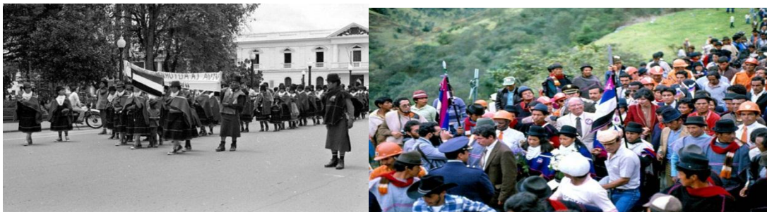
Primera gran marcha Misak en Popayán en respaldo de la lucha Octubre 24 de 1980

En 1980 el pueblo guambiano después de la marcha de gobernadores del suroccidente, en pleno auge de recuperación de los territorios ancestrales y con la toma de la Hacienda las Mercedes en Silvia (Santiago) concibe el “manifiesto guambiano” 28 , se reúnen en asamblea en la escuela del núcleo, junto con otros pueblos indígenas inconformes, con el Consejo Regional Indígena del Cauca CRIC y llamándolos ejecutivos a sus líderes, se separan organizando el movimiento político de Autoridades Indígenas de Colombia AICO.