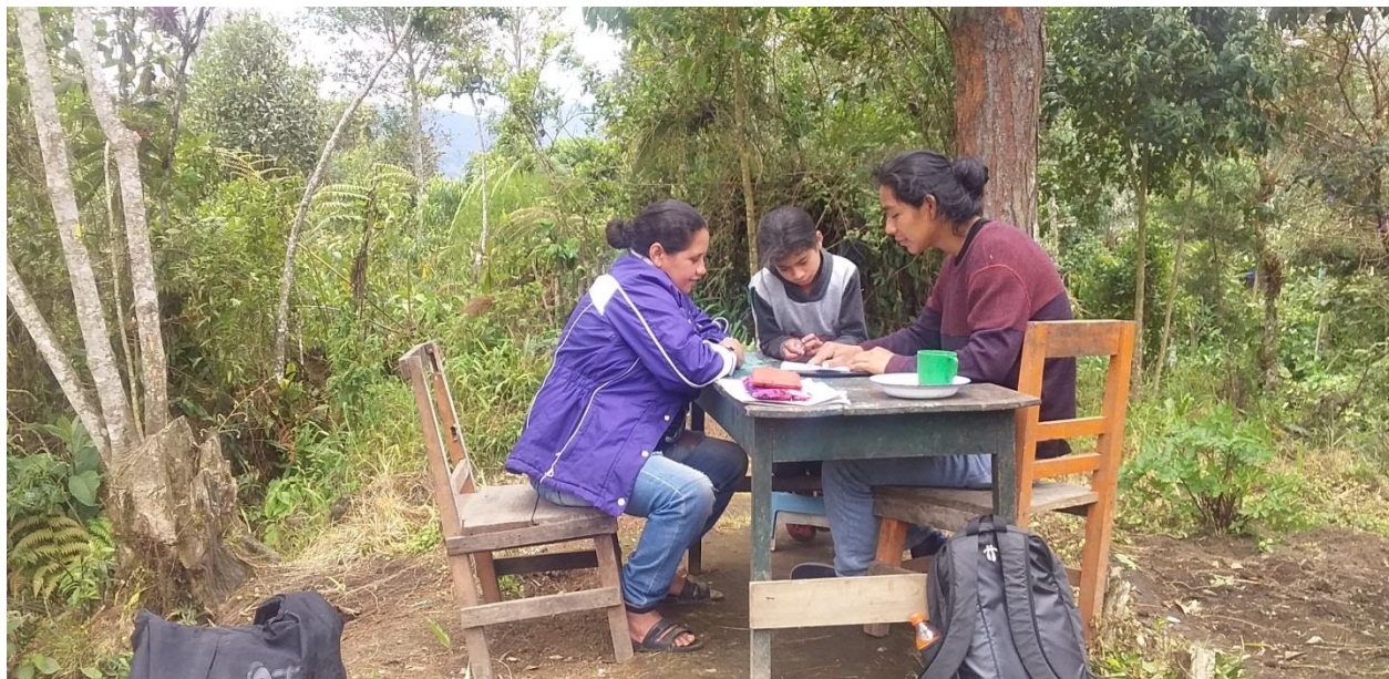
Fotografía N°4. Primer día de Práctica Pedagógica Etnoeducativa

En este capítulo comparto las experiencias vividas como practicante etnoeducador; una experiencia que se gestó al lado de madres, padres, niñas y niños que componen y configuran la comunidad de la vereda Muchivioy. La intención principal es abordar los acontecimientos más relevantes que marcó mi Práctica Pedagógica Etnoeducativa para desarrollar ideas que contribuyen en el proceso de formación, tanto para los niños como para el docente. Un trabajo desarrollado con niñas y niños de la escuela rural Muchivioy, quienes con su calificativo de el “profesor” llenaron de confianza mi labor y me convencieron de seguir con seguridad en este pequeño ejercicio pedagógico denominado “práctica”. Ante todo, comentar que la labor docente requiere de mucho esfuerzo y dedicación, pues es una de las labores que permite alcanzar transformaciones desde las pequeñas acciones. Por esto, se hace necesario que quien ejerza esta actividad de carácter social debe tener un sentido de apropiación profundo de la educación. Interiorizar la labor educativa es comprometerse con una acción política encaminada al cambio de la sociedad.