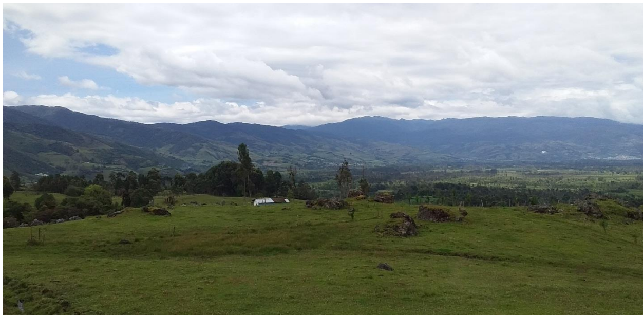
Fotografía N°1. Panorámica del valle de Sibundoy Putumayo. Toma realizada desde la vereda Muchivioy.

Este primer capítulo hace una breve descripción geográfica y cultural del valle de Sibundoy, específicamente del resguardo de Santiago, Putumayo, y de la vereda Muchivioy. Espacios de vida y escenarios comunitarios que me permitieron aprendizajes y la construcción de conocimientos enmarcados en la Etnoeducación, como política pública en Colombia que desde 1991 trabaja por el reconocimiento y el fortalecimiento de la diversidad étnica y cultural. Por ello, el breve mapeo de este escenario lo haré valorando, analizando y reflexionando los distintos puntos o focos de una sociedad humana que comprende lo cultural, lo social y político, con el ánimo de presentar las condiciones de la gente y nuestras realidades. Mapeo que realizo teniendo en cuenta los conceptos de cultura, sociedad y política, como categorías de análisis que dejan entrever la configuración de la estructura social en la cual desarrollé mi Práctica Pedagógica Etnoeducativa.