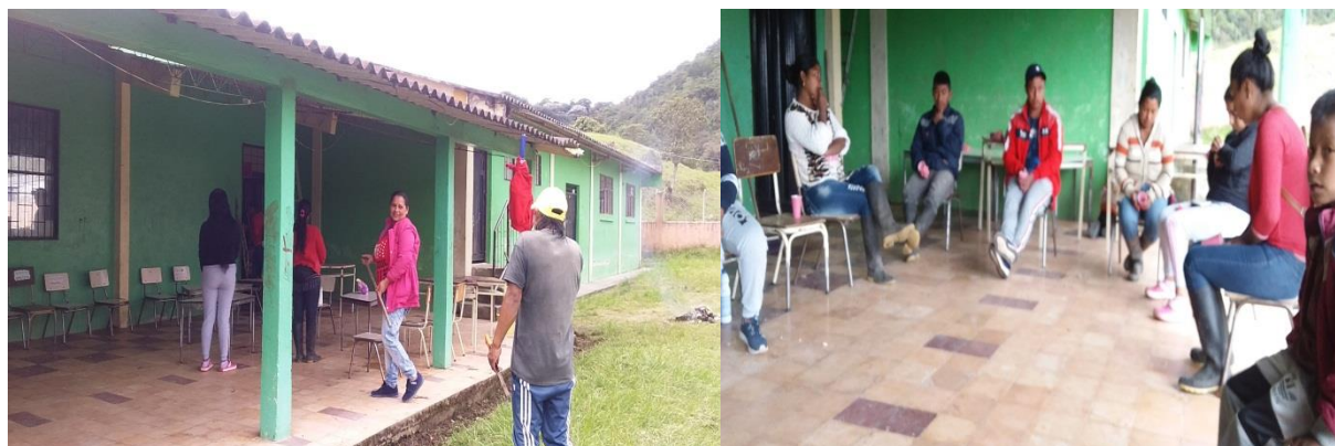
Fotografía N° 2. Primer encuentro con madres y padres de familia. Jornada de aseo y socialización del proyecto de PPE.

En este segundo capítulo describo la participación de los actores involucrados en el proceso de mi Práctica Pedagógica Etnoeducativa, quienes hicieron posible que los propósitos y objetivos planteados en mi proyecto se realizaran en gran medida.