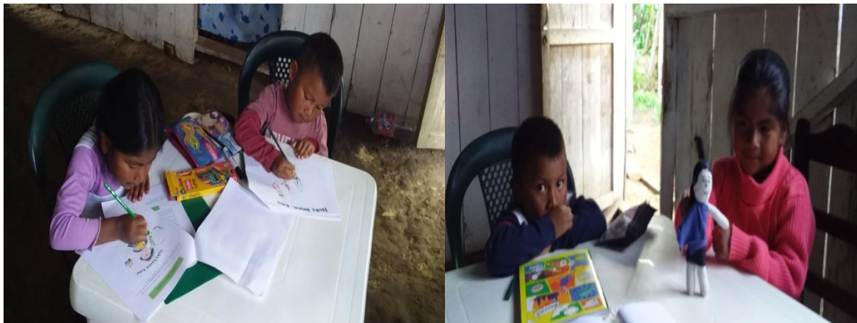
Fotografía N°6. Niños de grado Primero y Preescolar trabajando el tema de mi identidad inga.

Anteua parlukuna - “los cuentos antiguos” - es un concepto que me permitió acercarme a otros conceptos muy propios de mi propuesta pedagógica etnoeducativa, tales como: identidad, memoria colectiva, cosmovisión, cosmogonía, lengua propia, territorio y muchas otros que aportan a la construcción de lo que significa la cultura inga. Al respecto, para trabajar el tema Mi identidad inga con mis estudiantes propuse un ejercicio muy bonito que consistió en representar por medio de un dibujo las prendas tradicionales de la comunidad. También hicimos un muñequito para ponerle los ropajes tradicionales.