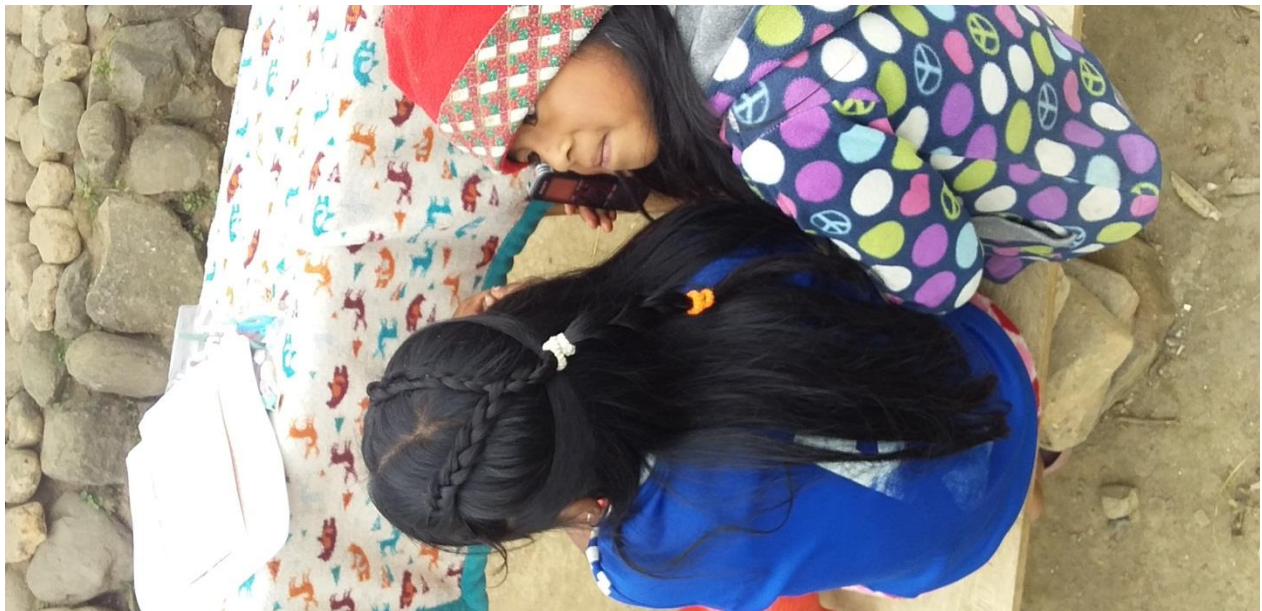
Fotografía N°7. Estudiantes escuchando la grabación de una historia oral.

El papel fundamental de la didáctica es garantizar el buen aprendizaje de los niños y las niñas desde la habilidad que el docente pone en la socialización de sus clases. Por lo tanto, se deben incorporar estrategias que simpaticen con la atención del aprendiz. Por ejemplo: las lecturas en voz alta acompañada con representación de marionetas, los juegos que ayuden a la comprensión del tema que se está trabajando, los cantos y/o la creación de textos libres. En mi caso, al inicio de cada clase leía en voz alta los cuentos que los niños habían redactado con anterioridad, cuentos contados por sus padres o abuelos. Otra estrategia que utilicé fue la grabación de algunos cuentos en lengua materna, los cuales los escuchábamos juntos y los comentábamos. Estas actividades fueron divertidas ya que compartíamos nuestras imaginaciones según nuestras referencias y perspectivas.