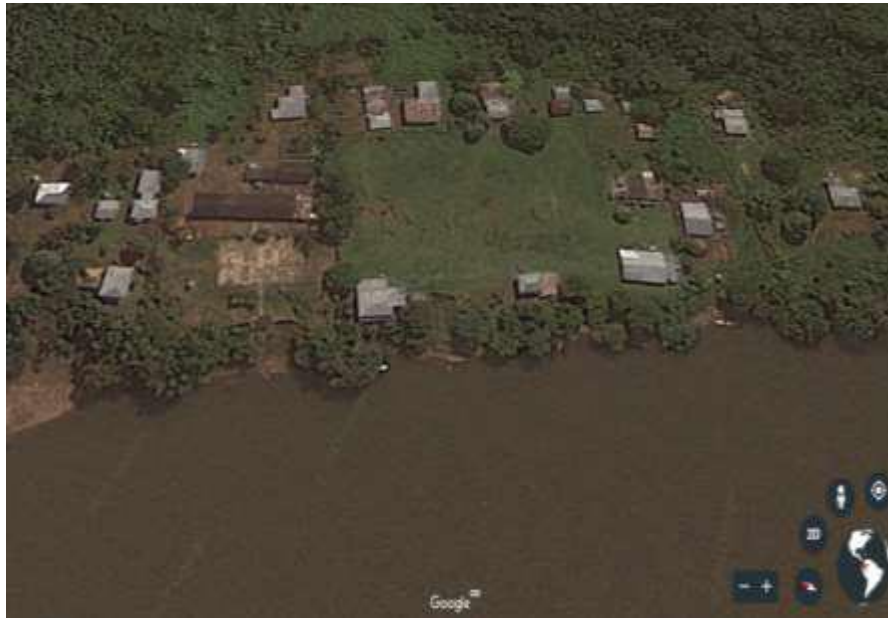
Figura 4. SEDE CENTRAL CENTRO ETNO - EDUCATIVO RURAL BUENAVISTA (CER)