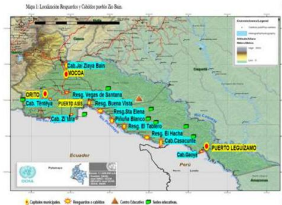
Figura 2. LOCALIZACIÓN RESGUARDOS Y CABILDOS PUEBLO ZIO BAIN