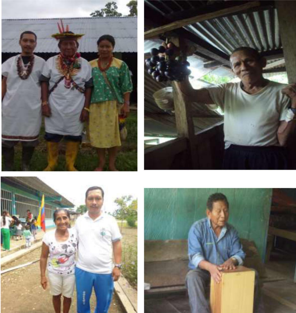
Figura 10. ENTREVISTAS PERSONALIZADAS CON MAYORTES - ABUELOS