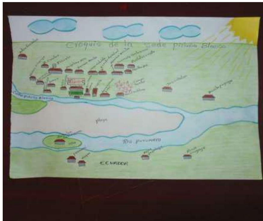
Figura 1. CROQUIS RESGUARDO SIONA DE PIÑUÑA BLANCO

(Mapa dibujado por el Estudiante). 2018.