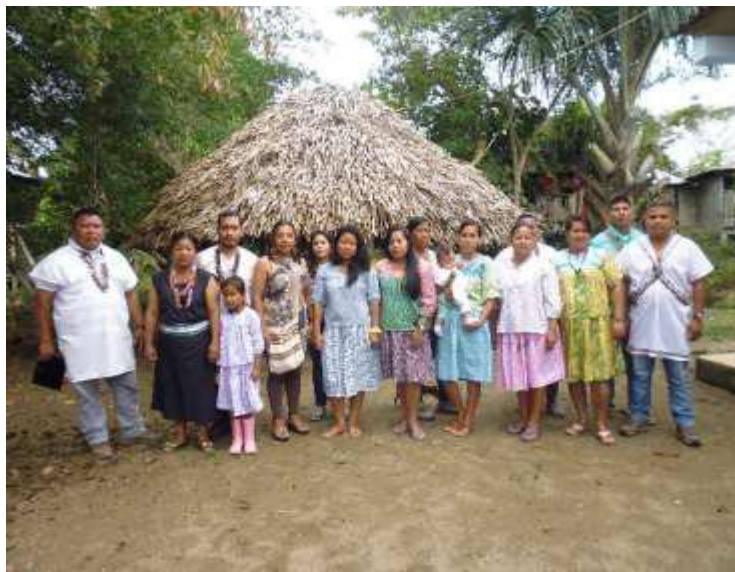
Figura 8: MINGA DE TRABAJO FAMILIA ZIO BAIN (RESGUARDO PIÑUÑA BLANCO)