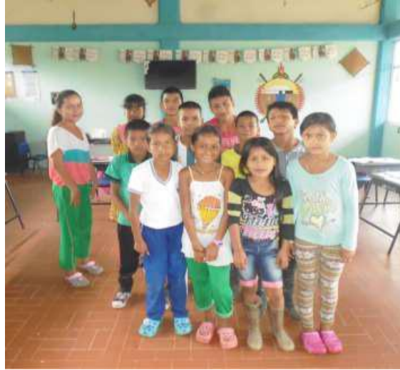
Figura 14. ESTUDIANTES CON LOS QUE SE DESARROLLÓ LA PRESENTE INVESTIGACIÓN EN LA SEDE EDUCATIVA PIÑUÑA BLANCO.