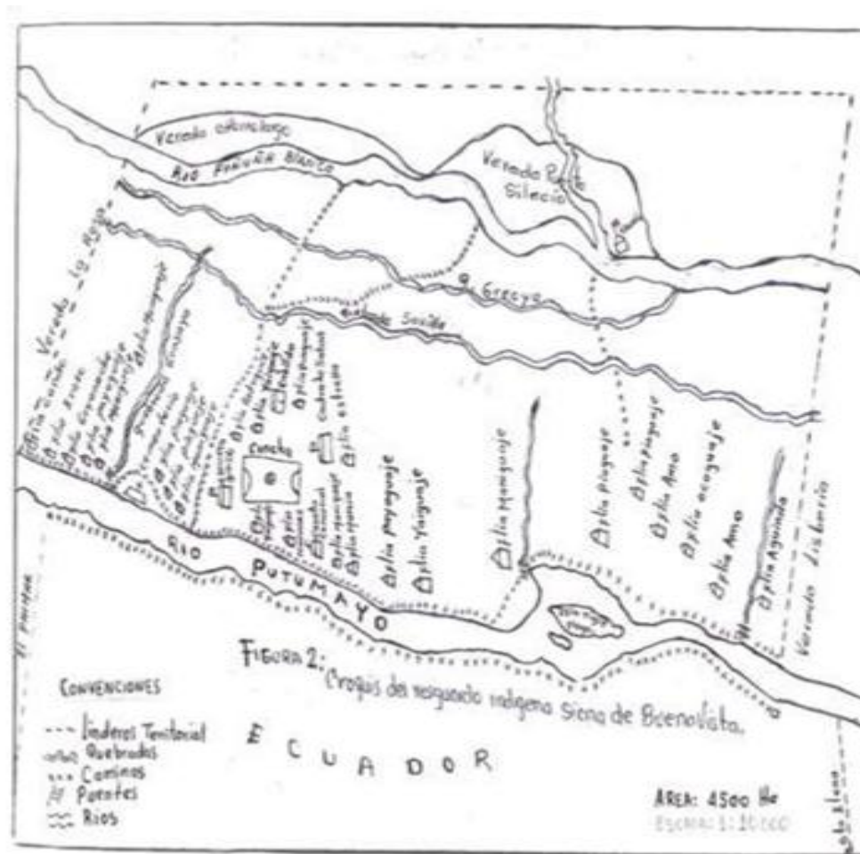
Figura 3. LOCALIZACIÓN DEL CENTRO ETNO - EDUCATIVO DEL RESGUARDO BUENA VISTA.