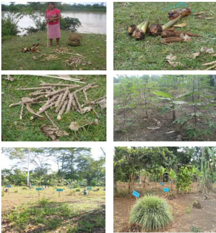
Figura 9. ACTIVIDADES DE MINGA CON BASE EN EL CALENDARIO ZIO BAIN Y LA SABIDURÍA ANCESTRAL, TRASMITIENDO EL CONOCIMIENTO A LOS ESTUDIANTES EN LA IMPLEMENTACIÓN DE LA CHAGRA TRADICIONAL Y LA CONSERVACIÓN DE LAS SEMILLAS AUTÓCTONAS.