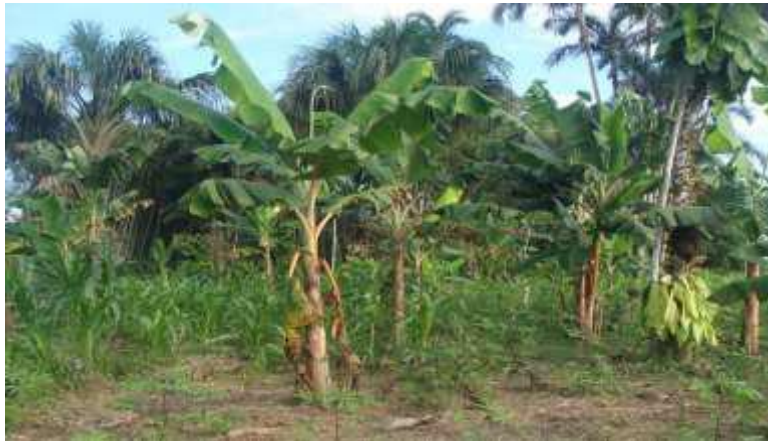
Figura 6. CHAGRA ZIO BAIN EN LA ACTUALIDAD.

Fuente Propia de esta Investigación. (Chagra madre de familia). 2018.