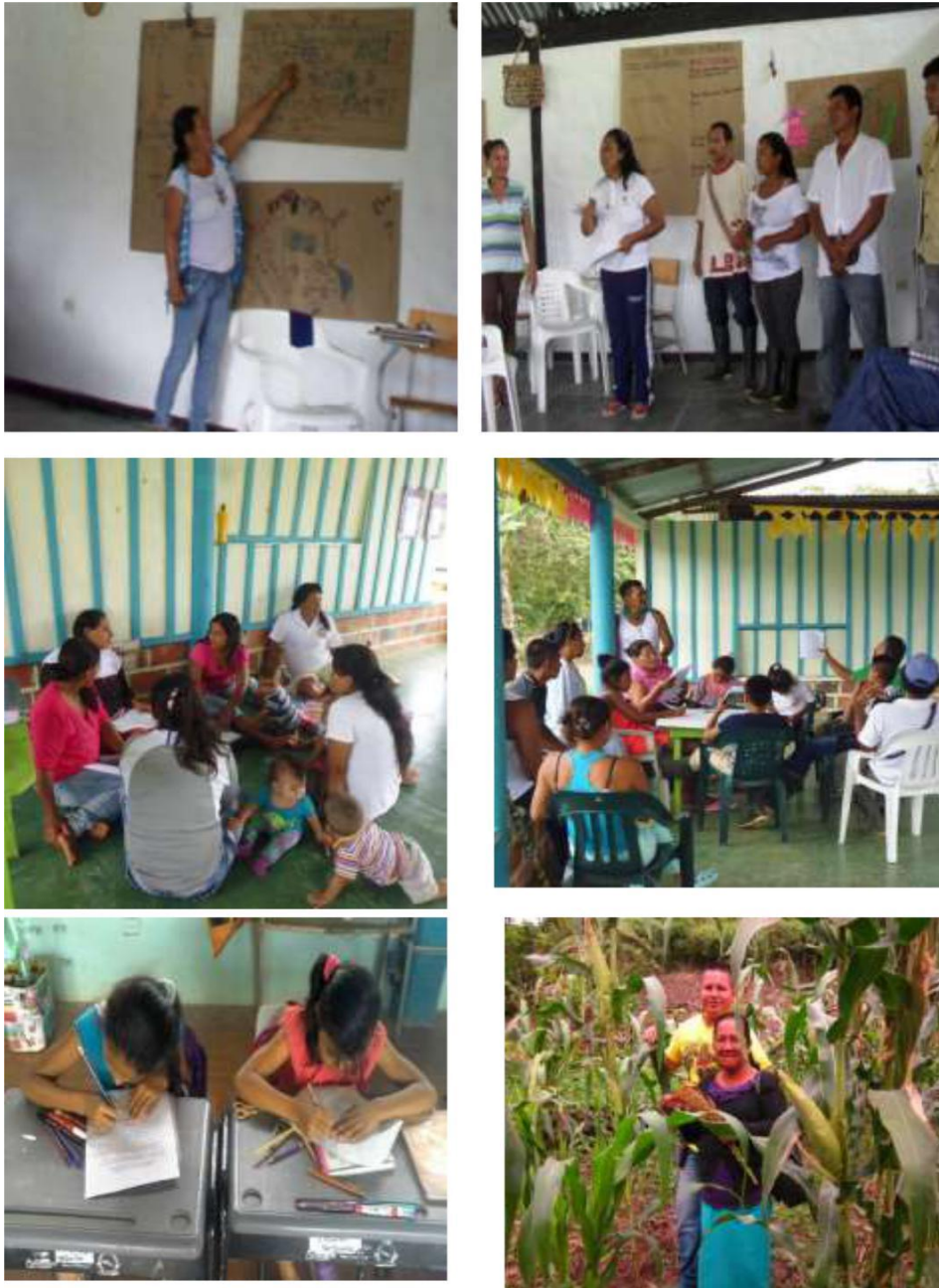
Figura 13: ESTUDIANTES, PADRES DE FAMILIA Y DOCENTES DEL RESGUARDO PIÑUÑA BLANCO.