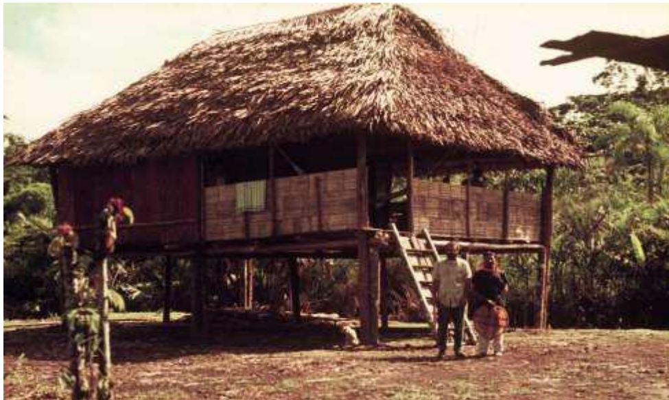
Figura 7. CASA TRADICIONAL ZIO BAIN