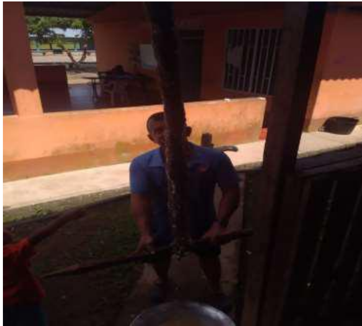
Figura 5. MATA FRÍO. HERRAMIENTA CON LA QUE SE EXPRIME EL EXTRACTO DE LA YUCA PARA HACER CAZABE.

Fuente Propia de esta Investigación. (Padre de familia). 2018.