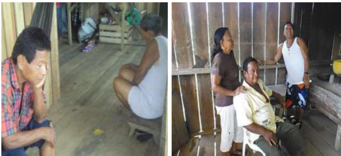
Figura 12: Trabajo y recolección de información con las familias de la comunidad.