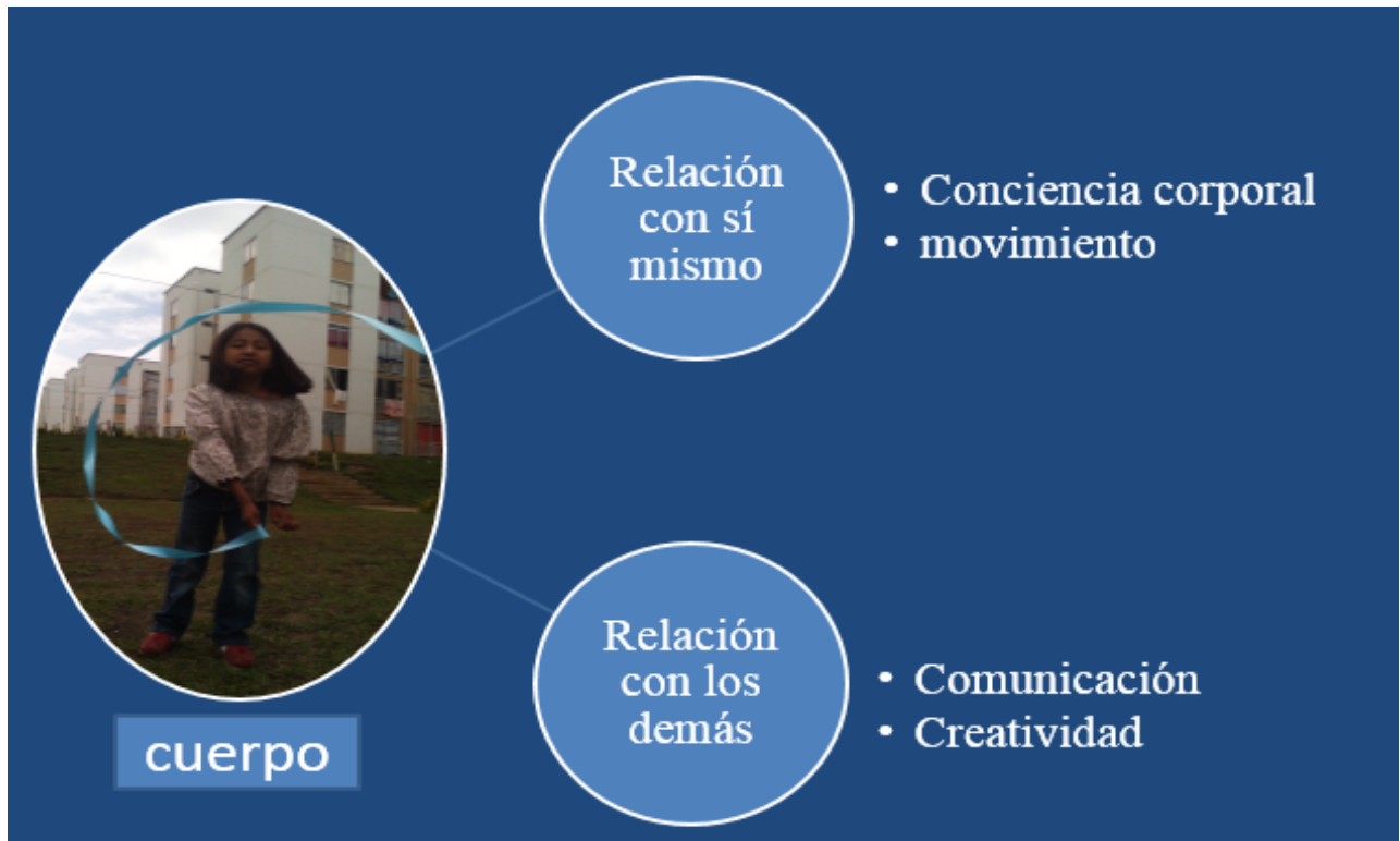
Ilustración 2: Relación de movimiento, comunicación y creatividad