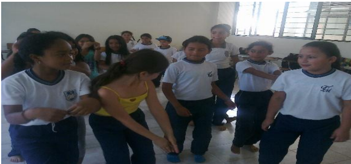
Figura 14. Muevo mi cuerpo al son de la melodía. Foto tomada por Deisy Hurtado, 2016

Reflexión: La música era como una terapia para ellos porque permitía que su cuerpo se dejara llevar por la más dulce melodía que le llegaba al oído ya fueran de relajación, de la naturaleza o del canto de las aves en fin otro tipo de música esto hacía que uno de los estudiantes tomara la vocería para dirigir al grupo, los niños estaban contentos con la actividad porque los que no sabían bailar aprendieron algunos pasos con los que sabían.