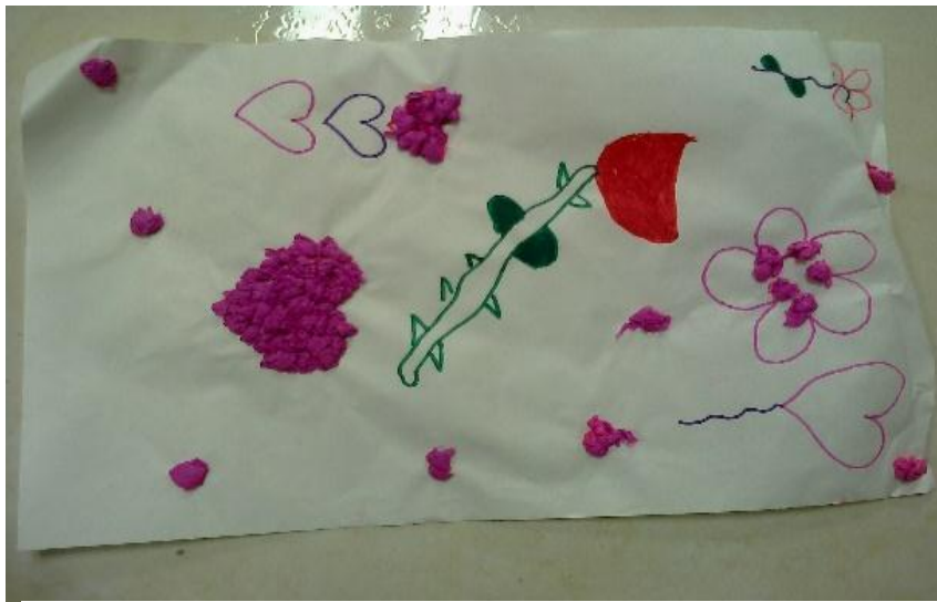
Figura 8. Significado de Halloween para los niños.

Reflexión: En esta actividad se aprovechó la ocasión para hablar sobre el Halloween cómo surgió y porque se celebra el día de los niños esto hizo que ellos se enteraran porque surge este día, se realizó un debate para hablar sobre el Halloween porque algunos padres les prohíben disfrazarse y nos llevó a una conclusión, que los padres prefieren abstenerse de vestir a sus hijos para protegerlos de cualquier peligro en la calle, incluso este día que donde las personas aprovechan el descuido de los padres para raptar a los niños, otros padres optan por salir en grupo para vigilarlo y evitar que pase esto porque los hijos son el ser más valioso que la vida nos ha dado.