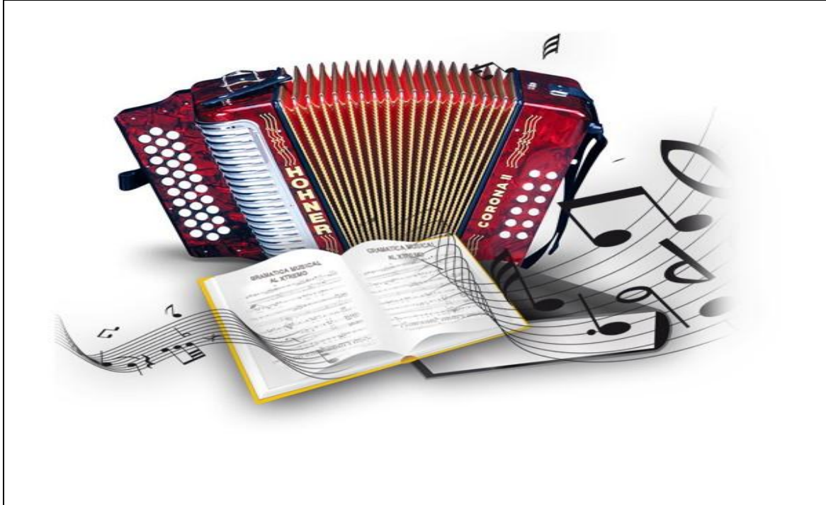
Figura 2. Acordeón Vallenato.

Cuando hablamos de música en el aula de clase lo primero que se nos viene a la mente es la utilización de recursos como canciones, danzas, ejercicios, instrumentos, etc. Este planteamiento metodológico busca que los diferentes autores que han mostrado su interés por la didáctica, propongan una educación musical donde la disciplina tengan una pretensión como la de transmitir conocimiento musical para desarrollar capacidades sensomotrices afectivas y cognitivas de cada sujeto.