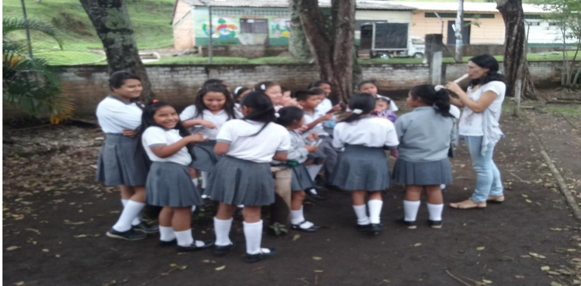
Figura 17. La naturaleza como medio de inspiración. Foto tomada por Cesar Chica, 2016