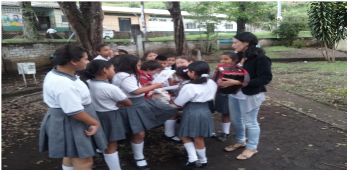
Figura 3. Participación del grupo de Lectura.

Reflexión: La iniciación con la dinámica fue excelente los niños estuvieron muy contentos porque por medio de ella aprendieron a integrarse como grupo, ahí se les veía el entusiasmo que tenían por aprender cosas nuevas como los juegos, los ejercicios, etc. El director del curso estuvo acompañándonos en toda la actividad él decía que esto era bueno para ellos porque no solo aprendían sino que se divertían que también.