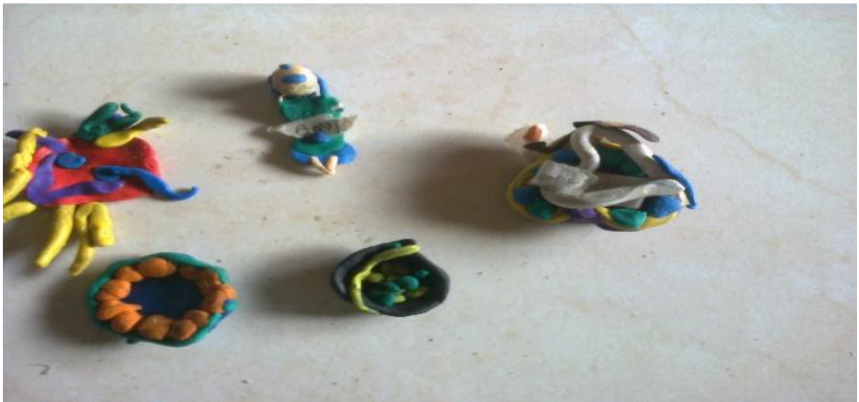
Figura 7. Escucho el cuento luego lo represento.

Reflexión: Compartir con los demás compañeros es algo maravilloso ya que esto es fundamental para la realización de las actividades, esto ayudo a que el curso se sintiera unido y fuera un grupo dinámico porque al comienzo cada uno quería coger por su lado, pero a medida que avanzaba se iba mirando el logro que se obtenía con los talleres, para los niños la lectura es un poco difícil comenzando pero si no se le brinda una apoyo esto hace que le cojan pereza a la lectura dificultando a un más su aprendizaje, es por eso que se debe tener paciencia a la hora de enseñar porque no todos aprenden al mismo tiempo y es aquí donde uno debe mirar que hacer con los que van atrasados, que pedagogía utilizo con ellos para hacer que ellos me entiendan.