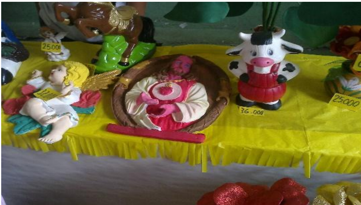
Figura 15. Escucho para luego crear.

Reflexión: La exploración de los dedos con la pintura es una sensación agradable, con la que puedes plasmar tus creaciones y a la vez te va dando una idea de combinar diferentes colores con los que puedes no solo pintar con los dedos sino con una rama por ejemplo, o también si le agregas agua va a tener otra forma no siempre ahí que quedarse con lo que tenemos si podemos agregarle algo, se debe hacerlo sin ningún temor.