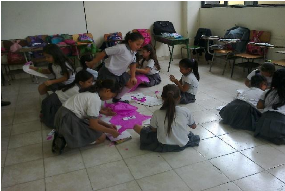
Figura 10. Creo y luego entono con instrumento. Foto tomada por Deisy Hurtado, 2016

Reflexión: Al entonar la melodía se creaba una figura en papelillo algunos eran reacios al mostrar su trabajo pero al final terminaban enseñándolo, fue maravilloso ver cómo estas manitos creaban diferentes cosas corrían de un lado para otro afanados para que no les cogiera el tiempo, y poder mostrar ante los demás lo que habían hecho.