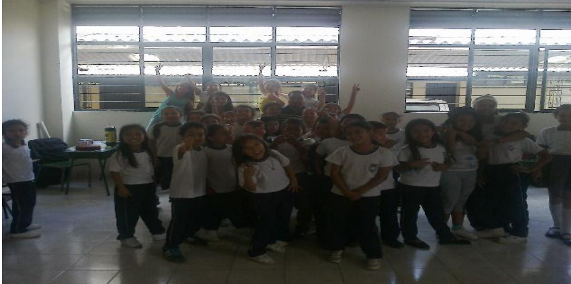
Figura 13. Expresando lo creado.