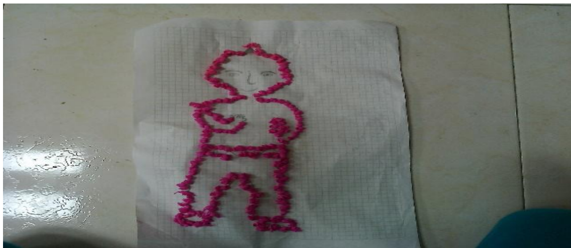
Figura 9. Aportando ideas al cuento.

Reflexión: Aquí los estudiantes colocaban en las carteleras su nombre al terminar la estrofa que ellos querían que llevara el cuento, esto hizo que ellos compartieran ideas con sus compañeros de acuerdo a lo que estaban escribiendo y así mirarlo desde un punto de vista diferente, porque para ellos era importante saber qué opinaba su compañero frente a lo que había escrito en la hoja de borrador, para luego pasarlo a la cartelera sin duda alguna esto ayudaba a que ellos se fueran desprendiendo un poco de las cosas a no ser egoísta con los demás, al comienzo fue duro pero luego fueron entendiendo que para poder realizar algo debían integrarse como grupo y aprender a compartir.