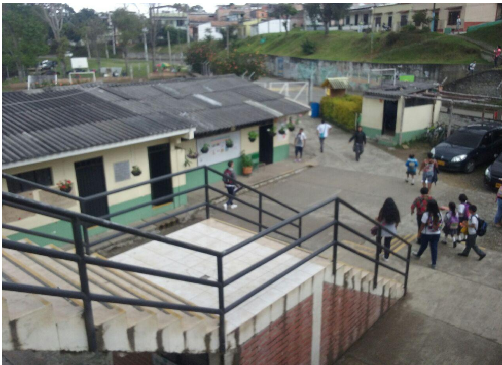
Figura 1. Infraestructura de la Institución Educativa Tomás Cipriano de Mosquera. Foto tomada por Deysi P. Hurtado, 2016

Conocer el manejo y mecanismo de los diferentes instrumentos el cual vamos a utilizar como método para el fomento de la lectura.