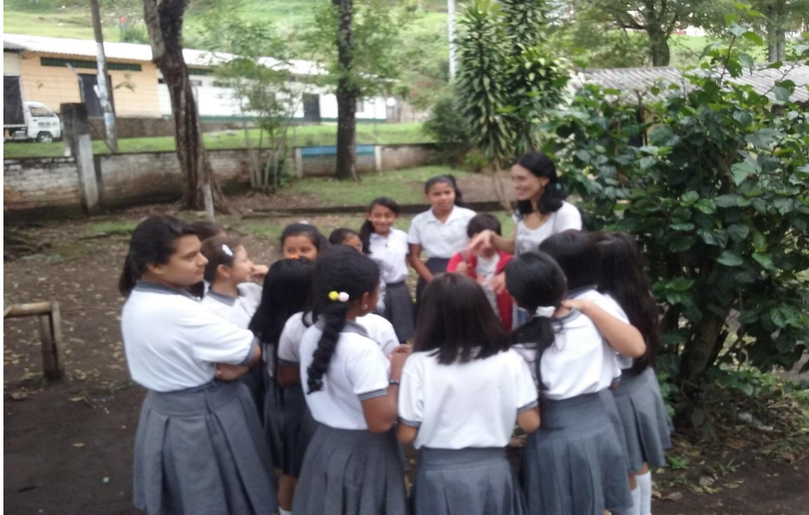
Figura 16. La música como expresión. Foto tomada por Cesar Arturo Chica, 2016.