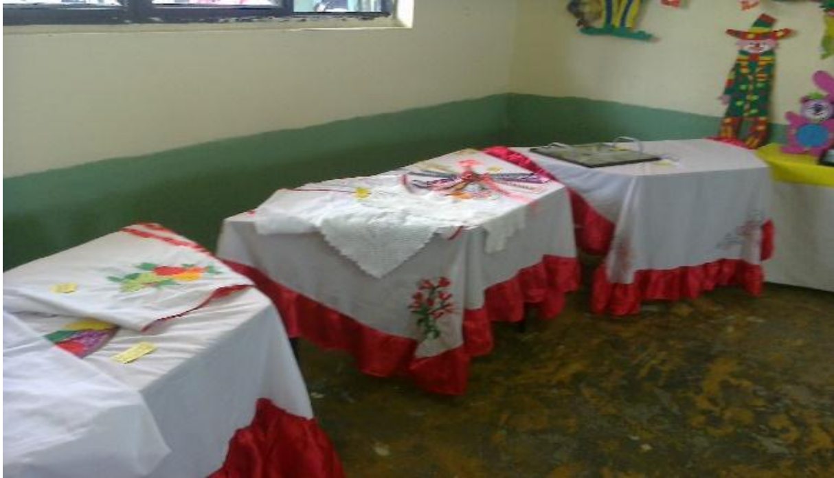
Figura 6. Exposición de trabajos elaborados.

sin odios ni rencores, porque como ellos dicen quieren un país libre de guerra donde todo el mundo pueda compartir lo que tiene con los que más lo necesitan.