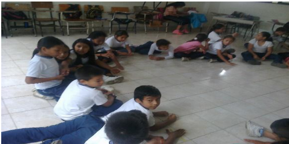
Figura 18: escucho luego te cuento.

Reflexión: Con esta actividad se finalizaron los talleres y se pudo evidenciar el interés de los estudiantes por la lectura de cuentos que ayudaron a fomentar el amor por ella y por la música.