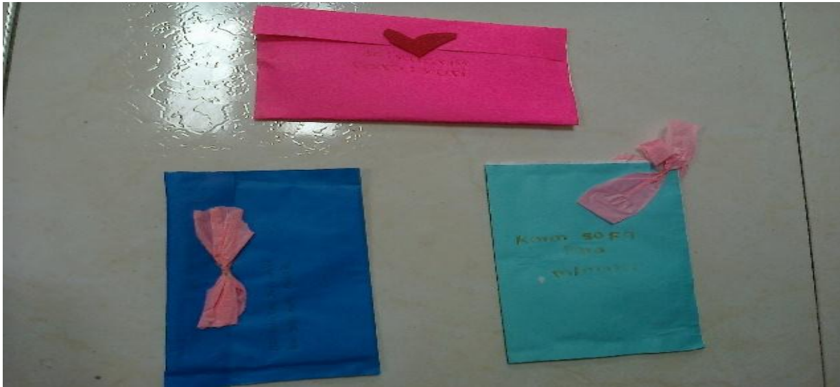
Figura 11. Creo lo escribo y luego lo guardo Foto tomada por Deisy Hurtado, 2016.

navidad, llevo a motivarlos aún más ya que es tiempo de paz y alegría en los hogares sin duda alguna esto hace que las familias se reconcilien, donde los hijos son el motivo para la unión porque es triste ver a un niño llorar por la separación de sus padres por eso tienen la ilusión de ver unida a su familia porque todos quisieran tener un hogar feliz.