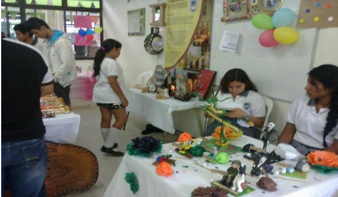
Figura 12. Creaciones en material Reciclable Foto tomada por Deisy Hurtado, 2016.