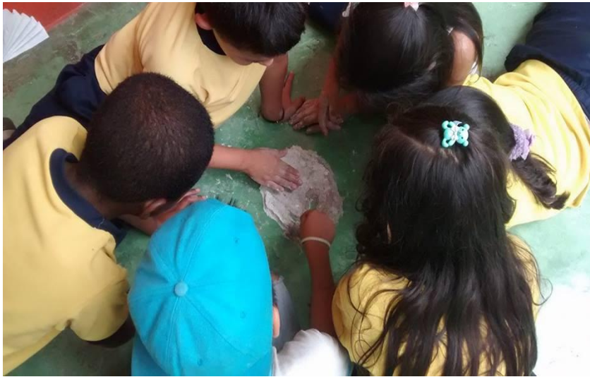
Figura 23. Niños concentrados y trabajando en equipo para el trabajo propuesto.