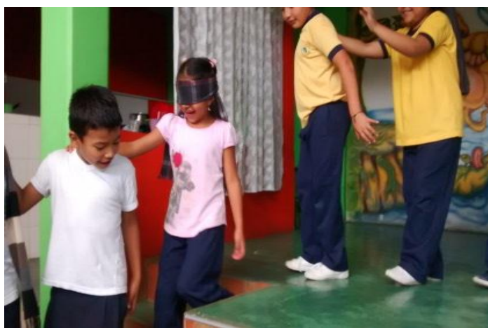
Figura 17. Niños en práctica del lazarillo.