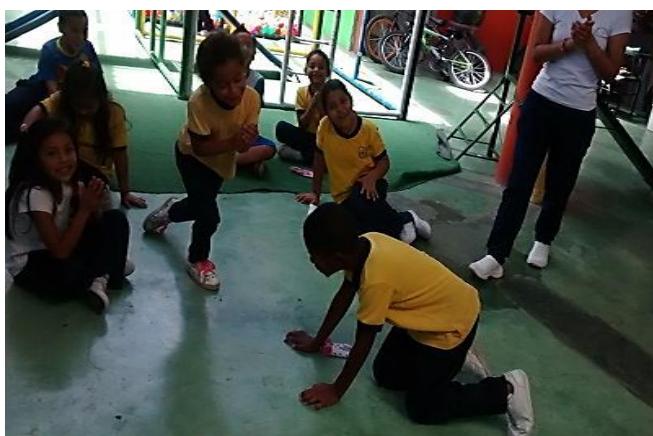
Figura 8. Observación durante la clase de educación física. Copyright, 2017, Serna.

Elaboración Propia. Copyright, 2017, Serna.