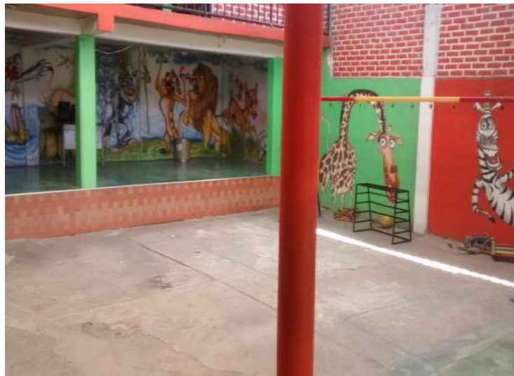
Figura 2. Patio de Juegos de la Institución Educativa Destellos Empresariales.

mencionados. Aquí se puede encontrar también un patio de juegos (Figura 2) que cuenta con piscina de pelotas, resbaladeros, columpios (algunos en mal estado) y un espacio un poco más amplio que funciona como cancha de fútbol, al final de este nivel se encuentra la cocina y la tarima donde se realizan los eventos culturales en fechas especiales, además hay tres baterías sanitarias, una especial para las docentes y las otros dos para las niñas y niños de los grados transición y jardín.