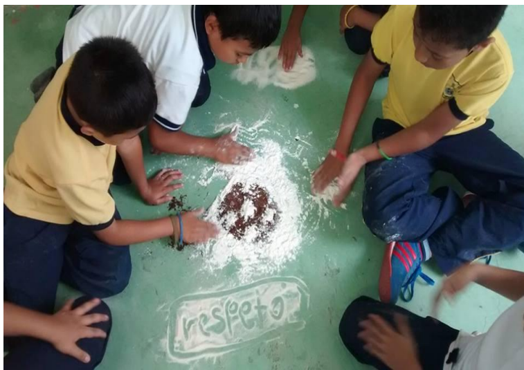
Figura 22. Niños en modelado en dos dimensiones sobre valores. Copyright, 2017, Serna.

Elaboración Propia. Copyright, 2017, Serna.