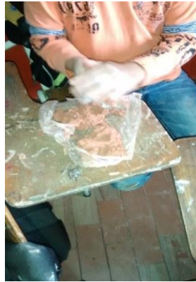
Figura 4. Niño manipulado la arcilla se aprecia la textura.

mucho la atención el color (Figura 4), el olor y la textura de la arcilla, además de que al manipularla y hacer contacto con sus manos, experimentaban sensaciones diferentes.