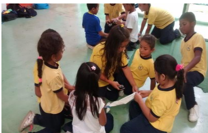
Figura 21. Trabajo en grupo y mejoramiento de la convivencia escolar producto del modelado con medias.