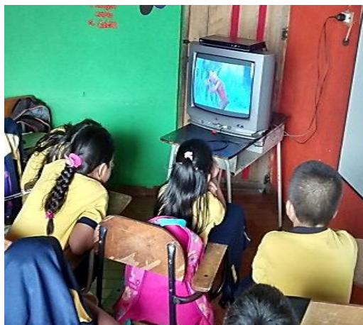
Figura 9. Niños observando película Frozen 2. Copyright, 2017, Serna.

Elaboración Propia. Copyright, 2017, Serna.