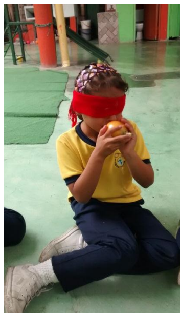
Figura 12. Niña explorando olores.