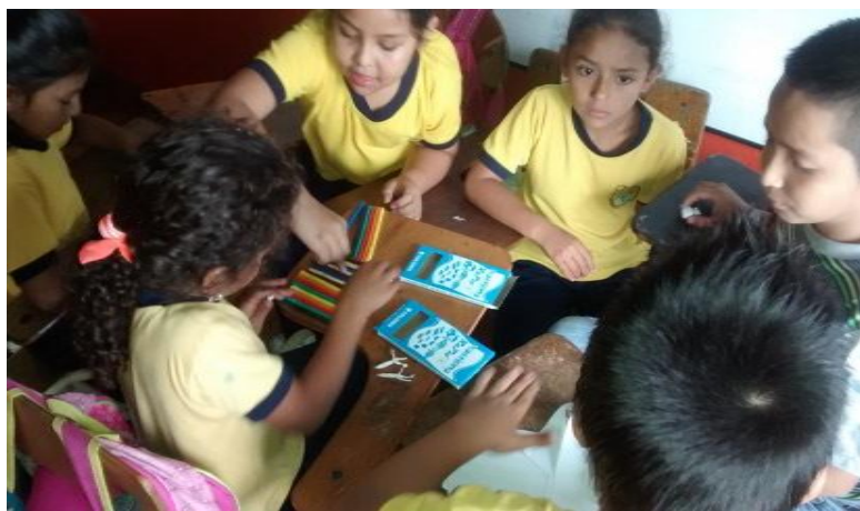
Figura 10. Niñas en proceso de modelado con plastilina. Copyright, 2017, Serna..

Elaboración Propia. Copyright, 2017, Serna.