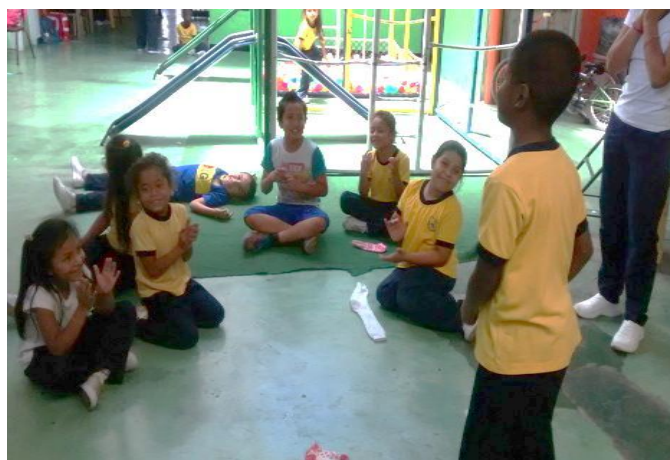
Figura 19. Niños en exploración artística de modelado con medias. Copyright, 2017, Serna.

Elaboración Propia. Copyright, 2017, Serna.