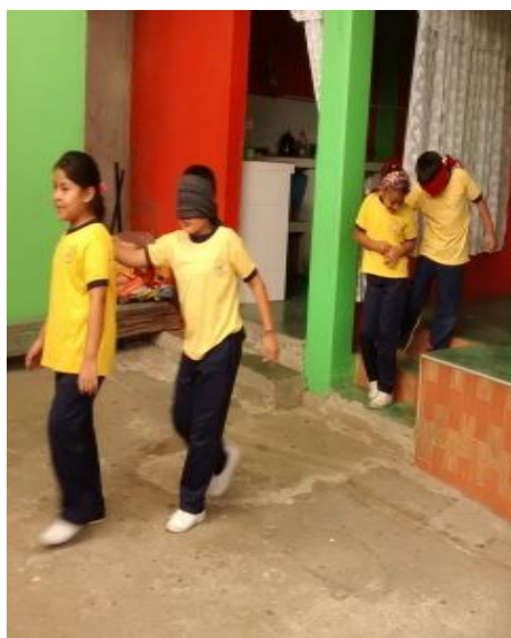
Figura 15. Niños en práctica del lazarillo. Copyright, 2017, Serna.

Elaboración Propia. Copyright, 2017, Serna.