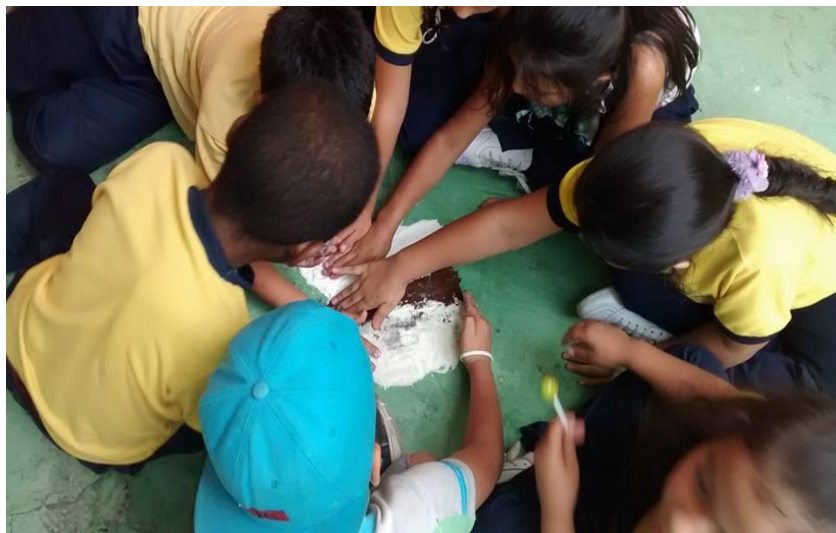
Figura 24. Niños en modelado con harina, café y azúcar.