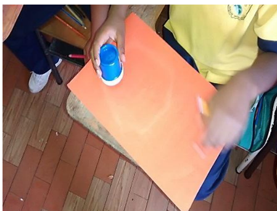
Figura 7. Niño dibujando. Copyright, 2017, Serna.

Elaboración Propia. Copyright, 2017, Serna.