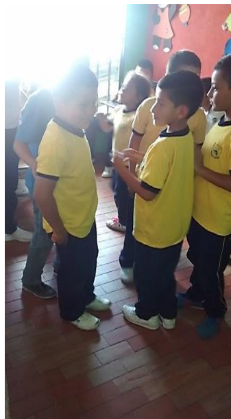
Figura 6. Indisciplina en la clase, alumnos conversando durante la sesión, antes de la implementación de la Estrategia Pedagógica.

Por otro lado, un resultado de la Práctica Pedagógica Investigativa (PPI) fue que durante los trabajos de modelado se logró incluir a ciertos estudiantes que generalmente no trabajaban ni se mostraban motivados cuando se planteaban trabajos en salón de clase. Además, se logró disminuir los niveles de agresividad y malos tratos dentro del grupo, puesto que al incentivar el trabajo en equipo se afianzó la comunicación, la aceptación y la concertación de ideas sin necesidad de generar disensiones ni pleitos.