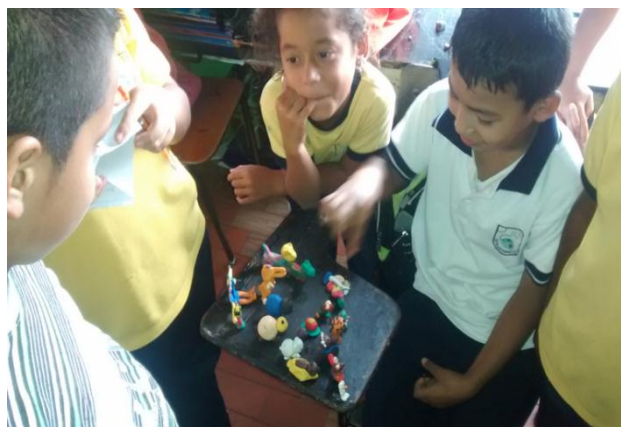
Estudiantes desarrollando el proceso del modelado con plastilina en el aula de clases.