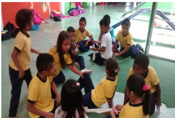
Figura 20. Consolidación de relaciones interpersonales por medio del modelado con medias.