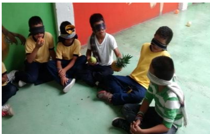
Figura 11. Niños explorando texturas. Copyright, 2017, Serna.

Elaboración Propia. Copyright, 2017, Serna.