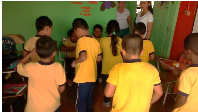
Figura 3. Primer contacto con la arcilla, Actividad #3.

En varios momentos se pudo ver la forma en que la mayor parte de los estudiantes estaban concentrados, pues cada uno de ellos se encontraba en su tarea de crear figuras y por ello recurrieron al maestro en formación; como es natural, al hacerlo se formó un poco de desorden tal como se observa en la Figura 3.