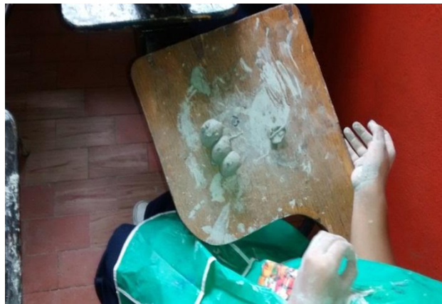
Estudiantes desarrollando el proceso del modelado con arcilla en el aula de clases.