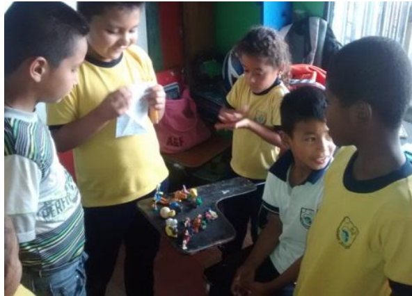
Estudiantes desarrollando el proceso del modelado con plastilina en el aula de clases.