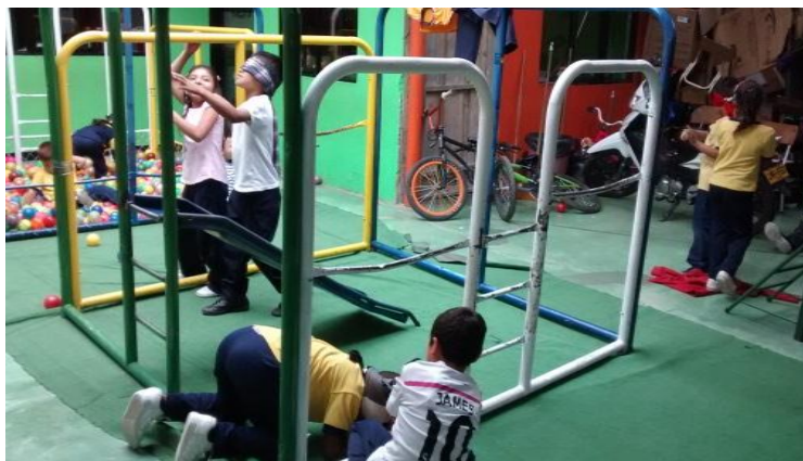
Figura 16. Niños en práctica del lazarillo.