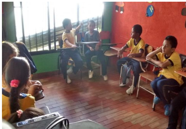
Figura 14. Niños escuchando historias sobre las fotografías familiares de sus compañeros. Copyright, 2017, Serna.

Elaboración Propia. Copyright, 2017, Serna.