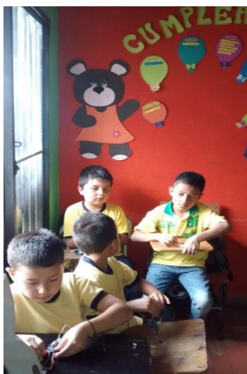
Figura 18. Niños en práctica de modela con alambre y plastilina a partir de experiencias sensoriales producto de la práctica del lazarillo.