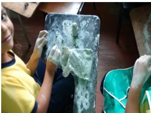
Figura 5. Niña en proceso de modelado con arcilla. Copyright, 2017, Serna.

Durante las prácticas con los estudiantes dentro del aula de clase, se les enseñó la técnica para modelar (Figura 5) y lograr elaboraciones más precisas del producto final, en diferentes sesiones cuando el maestro en formación, hizo su ingreso al salón de clase la primera reacción de los estudiantes fue de alegría. Lo que se entiende como la aceptación de una persona diferente a su maestra titular, se explica en la medida en que los trabajos presentados a los estudiantes en el área de Educación Artística fueron de su agrado, puesto que no se desarrollaban las típicas manualidades sino que se practicaba el modelado con materiales poco convencionales.