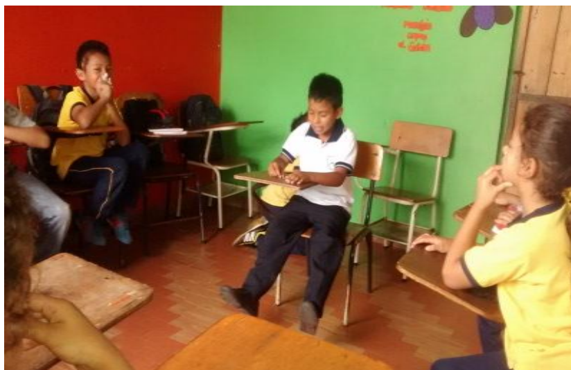
Figura 13. Niños observando a su lider desarrollando modelado con plastilina.