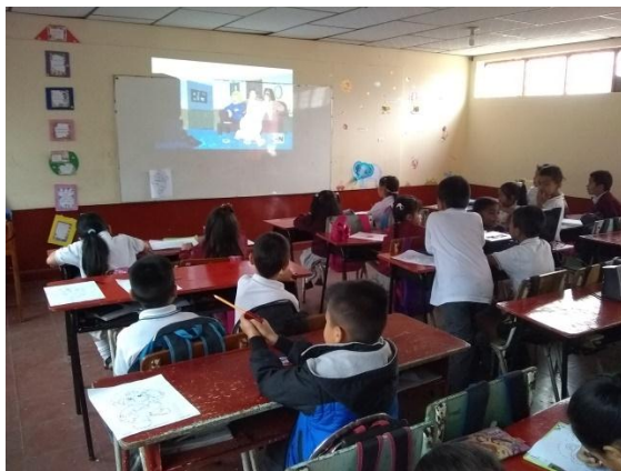
Figura 12. Grado segundo en el aula, observando un video de “Clarence”