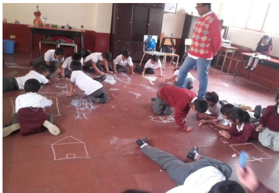
Figura 5 Salón de clases, dibujando la familia como lienzo el piso

PROPÓSITO: Representar a través del dibujo su familia