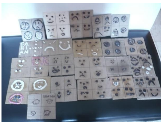
Figura 9. modelado de plastilina por los niños del grado segundo

PROPÓSITO: Reconocer las emociones a través de las expresiones faciales.