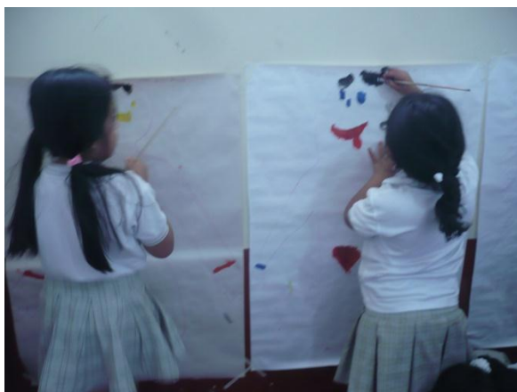
Figura 11. Niñas pintando con vinilo

PROPÓSITO: Identifican situaciones donde esta implicadas las emociones