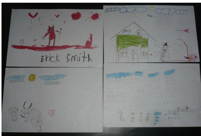
Figura 8. Dibujos de los niños del grado segundo

PROPÓSITO: Reconocer sus miedos, plasmando un dibujo sobre ellos