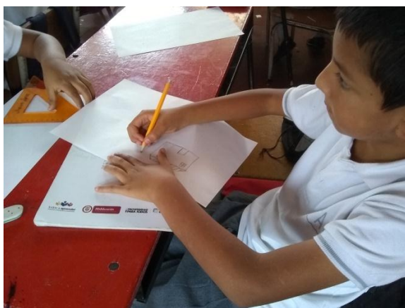
Figura 14. Niño del grado segundo realizando dibujo

PROPÓSITO: Identificar las emociones que experimentan con más frecuencia las niñas y los niños estando en casa, escuela y sus amigos y amigas.