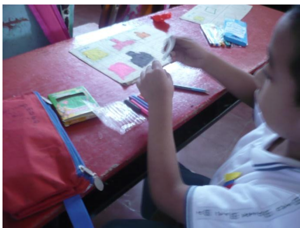
Figura 10. Niño del grado segundo modelando plastilina

PROPÓSITO: Identificar el color que representa cada una de las emociones