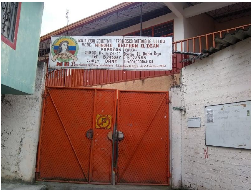
Figura 2. Fachada de la Institución Francisco Antonio de Ulloa, Sede Manuela Beltrán, Barrio Dean Bajo, Popayán.

Predominando en estos barrios las madres cabeza de familia, lo que incide en que deben trabajar todo el día en labores eventuales o del rebusque, lavado de ropa, reciclaje, servicio de aseo en casa, los padres, trabajan del rebusque como en transporte ilegal como moto taxista y otros oficios. Según, Palou (2008) “No podemos desligar todos los contextos en los que nace y crece el niño de un marco cultural, de una sociedad que tienen unas creencias, unos valores y unas leyes que le otorgan unas características que forman parte de todas las personas de esa comunidad”. (p. 59)