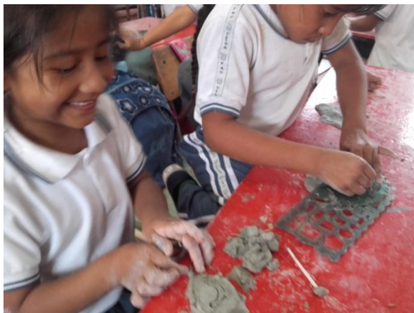
Figura 6. Niños del grado segundo modelando arcilla.

PROPÓSITO: Reconocer sus sueños y deseos.