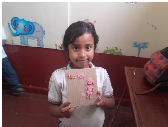
Figura 3. Primera clase, niña del grado segundo.

PROPÓSITO: Identificar prácticas en sus tiempos libres, a través del modelado de la plastilina.