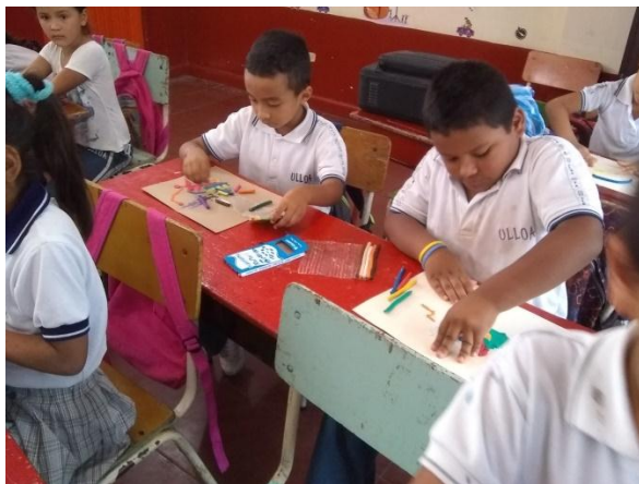
Figura 13. Niños modelando plastilina

PROPÓSITO: Reconocer e identificar las emociones y cualidades de los demás.