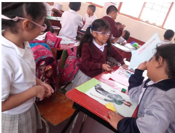
Figura 7 niñas del grado segundo, realizando un collage

PROPÓSITO: Apreciar el ser niño el ser niña, somos iguales.