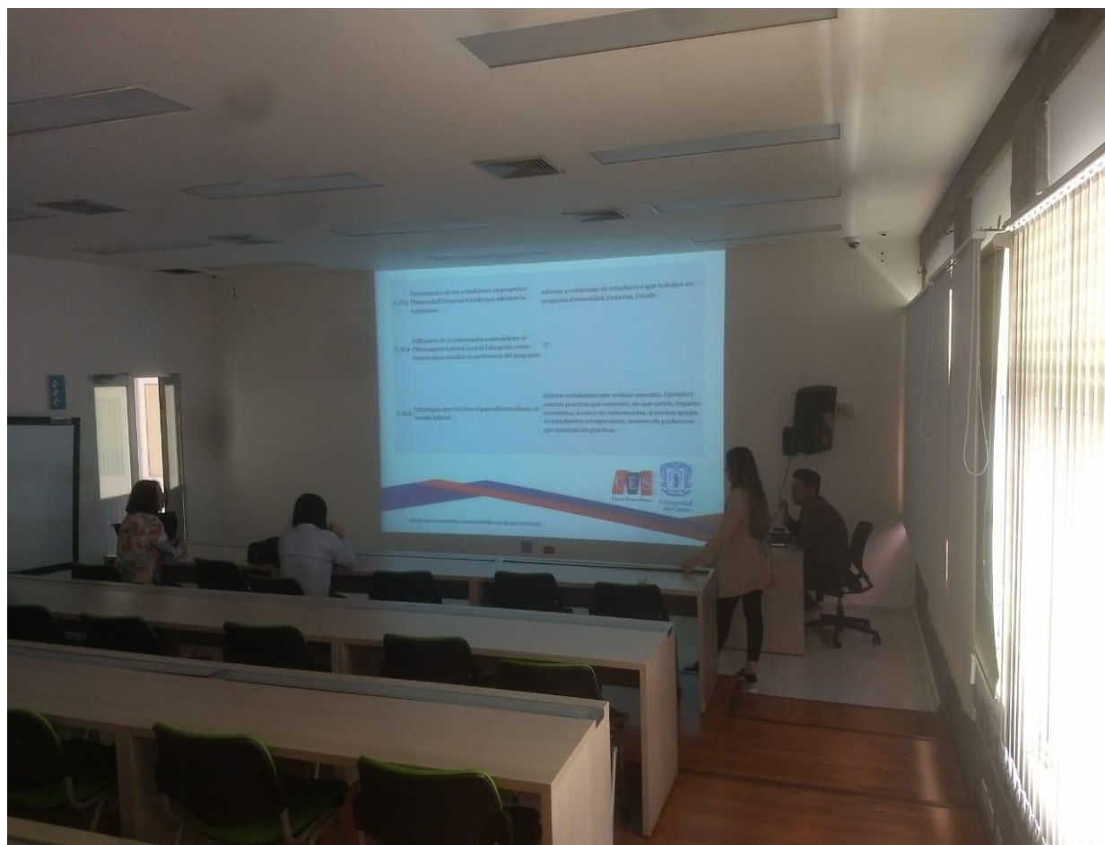
Ilustración 3 Reunión dependencia CES