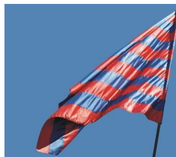
Ilustración 2. Bandera de la Universidad del Cauca