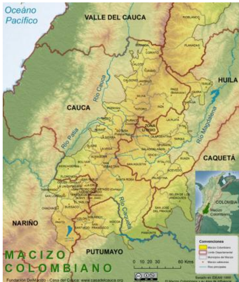
Imagen 2. Mapa del Macizo Colombiano

zona se le ha denominado como la estrella fluvial de América, en esta región se separan las cordilleras central y oriental y además confluyen los ecosistemas andino, amazónico y pacífico. En 1978 fue declarada por la UNESCO como reserva de la biósfera constelación Cinturón Andino, a lo cual se han promovido muchas orientaciones para su desarrollo con base en su capital natural. (Ministerio de Ambiente, 2018)