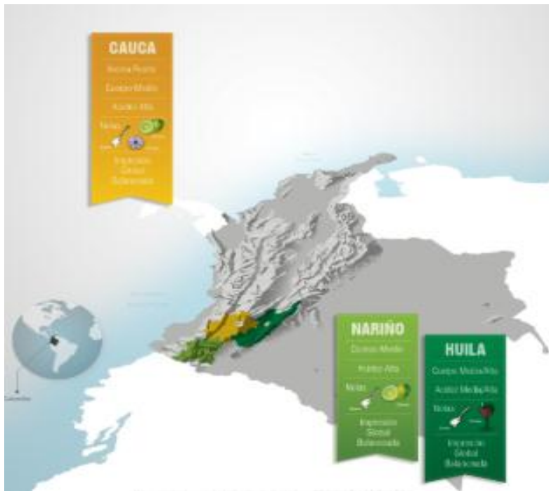
Imagen 1. Mapa de las regiones mayores productoras de café de calidad.

La actividad cafetera presente en estos departamentos presenta una serie de características que la han catapultado en los últimos años como una de las regiones más prosperas en términos de producción de café, las características físicas de la región permiten que la calidad de los granos de café que se producen sean reconocidos internacionalmente como cafés especiales con un alto grado de calidad, cumpliendo con todos los estándares requeridos a nivel mundial para ser catalogados de esta manera.