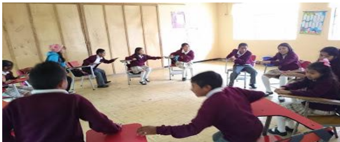
Figura 6 Dinámica de ambientación.

3.2.2.1 Momento de ambientación. En este espacio se realizaron dinámicas, con el fin de introducir de una manera lúdica al estudiante en el proceso lector, pues el juego es una actividad donde el niño de manera espontánea interactúa libremente, siendo capaz de expresar su creatividad, transformando el aula en un ambiente más acogedor para el aprendizaje.