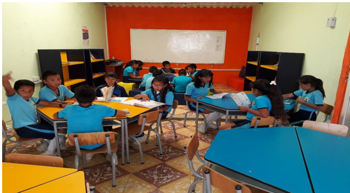
Figura 21. Foto biblioteca actual.