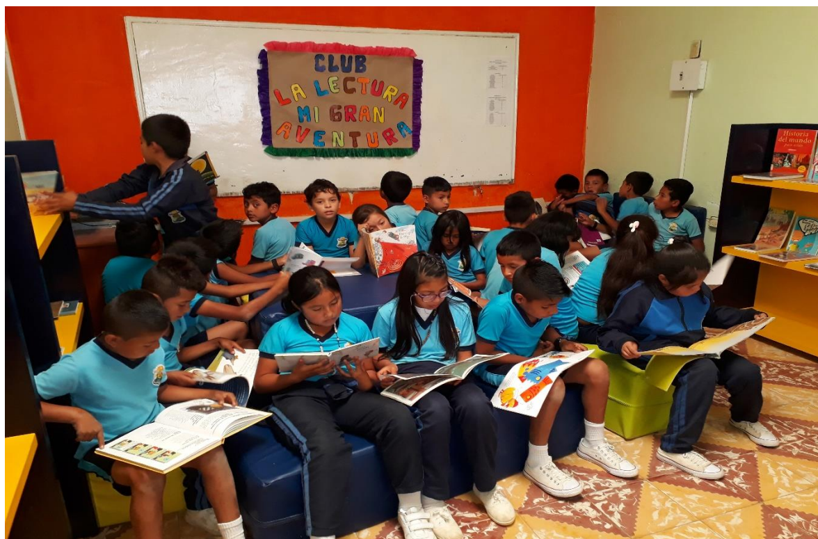
Figura 9 Foto club de lectura.

3.2.3.1 Club de lectura. El club de lectura promueve la convivencia al reunir a sus miembros con un objetivo común, en la interacción positiva que se da entre ellos, en la participación al aportar ideas y críticas constructivas que permitan una mayor comprensión de los textos leídos.