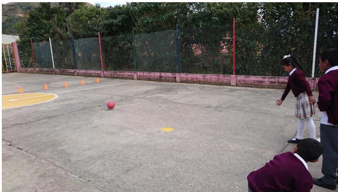
Figura 17. Foto bolo lectura.

A manera de ambientación, se realizó la actividad bolo lectura, para la cual se conformaron dos grupos; por turno, cada integrante del grupo lanzaba con la mano el balón de microfútbol, con el fin de hacer caer un cono el cual contenía en su interior una fábula, cuento o leyenda; el jugador para obtener el punto debía leer correctamente el texto ante sus compañeros y entre todos hacían un pequeño comentario.