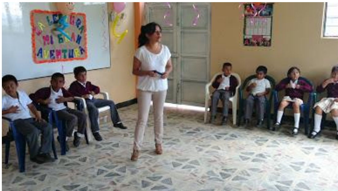
Figura 5 Reunión de docentes con estudiantes iniciación proyecto pedagógico de aula.

Para la realización del PPA se reunió a los estudiantes de los dos grados en un espacio preparado para el encuentro, se inició con una actividad de motivación, se realizaron varias dinámicas que permitieron entrar en confianza a los dos grupos, acto seguido se retomó la problemática que se había tratado en la entrevista, recordándoles el inconveniente que se venía