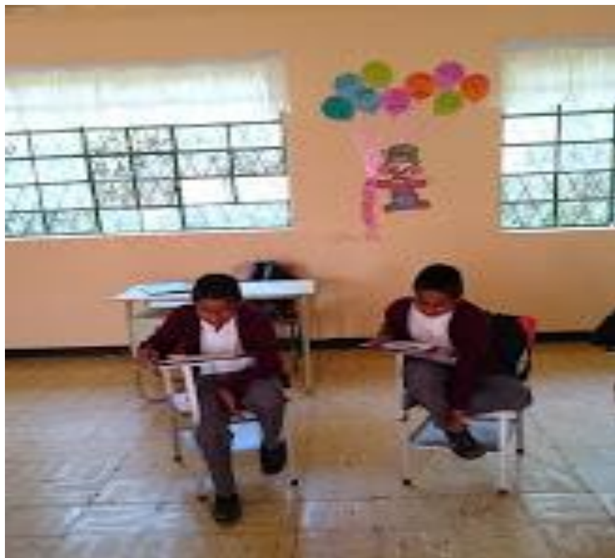
Figura 2. Entrevista a estudiantes.