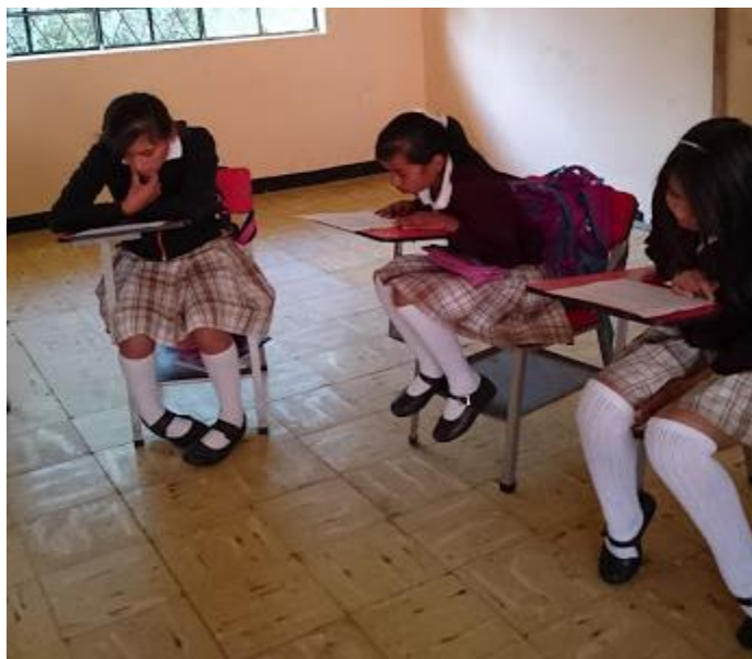
Figura 12 Desarrollo actividad texto de colores.

Se pudo observar que con la aplicación de esta estrategia se logró mejorar la expresividad de la mayoría de los estudiantes al momento de leer y en un menor porcentaje también se logró vencer la timidez para leer en público.