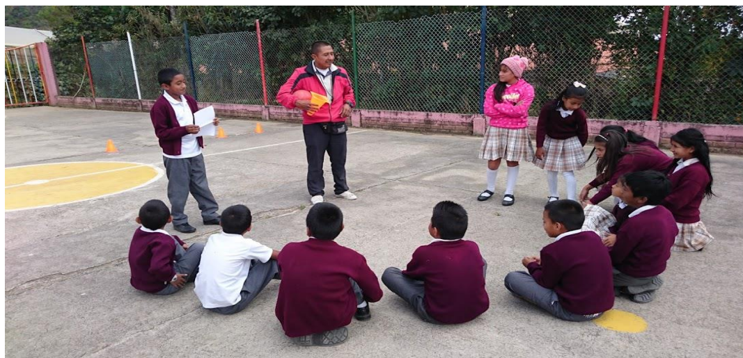
Figura 7 Actividad de formación.

3.2.2.2 Momento de formación. Es el momento central de cada actividad del proyecto, porque es aquí donde se desarrolla cada tarea estratégicamente programada para favorecer el proceso lector, de modo que el estudiante vaya adquiriendo buenos hábitos de lectura que gradualmente le ayuden a desarrollar las competencias lectoras.