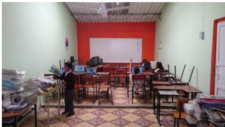
Figura 19. Foto salón de lectura.

En el diagnóstico realizado al inicio del presente trabajo se pudo evidenciar la falta de una biblioteca escolar como el espacio complementario para una adecuada práctica pedagógica, por tanto, se planteó como objetivo específico implementar y adecuar la biblioteca escolar como escenario educativo para incentivar el proceso lector de los estudiantes de la Institución Educativa Nuestra Señora de Las Lajas.