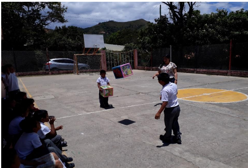
Figura 15 Foto cubos mágicos.

Esta actividad se desarrolló con los estudiantes de los grados tercero y quinto, consistió en la construcción de tres cubos grandes en cartón; en el primero se dibujaron seis personajes fantásticos (uno en cada cara del cubo), en el segundo se dibujaron seis lugares diferentes, y en el tercero se dibujaron seis lugares fantásticos diferentes; la actividad consistió en que cada participante lanzaba los cubos y a partir de la imagen, el lugar y el objeto que saliera, se empezaba a crear y narrar un cuento, leyenda o fábula, haciendo uso de su creatividad y capacidad inventiva.