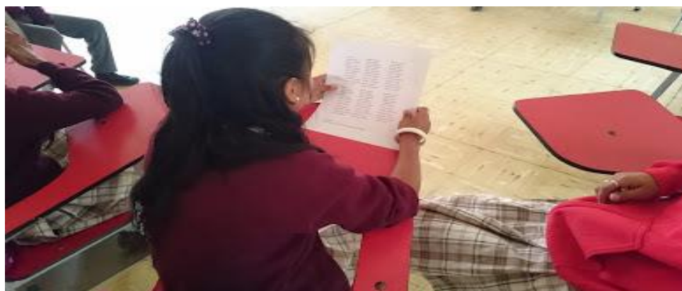
Figura 8 Actividad de evaluación.

3.2.2.3 Momento de evaluación. Finalmente, para cada actividad realizada se utilizó una estrategia particular de evaluación, que permitió conocer los aciertos y dificultades que se presentaron y así poder hacer un proceso de retroalimentación.