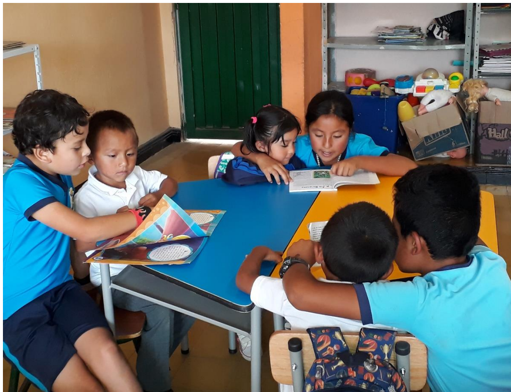
Figura 14 Foto Padrinos de la lectura.

El desarrollo de esta actividad se acordó para los días miércoles de 7:00 a 8.00 a.m. Para la elección de los textos se tuvo en cuenta características como las siguientes: cuentos cortos, que contengan imágenes grandes y coloridas, trama sencilla, letra grande. Entre ellos están: los tres cerditos, el lobo y las siete cabritas, Hansel y Gretel, la ratita presumida, el patito feo, el gato con botas, Rapunzel, pulgarcito, el soldadito de plomo, entre otros.