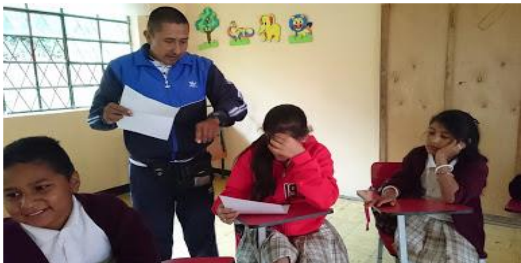
Figura 13 Foto lectura rápida Cronometrada.

Al inicio de este proceso, se encontró una marcada dificultad en estudiantes que leían con mucha lentitud y por tanto se desconcentraban y olvidaban lo que habían acumulado en su memoria con su lectura previa, desmotivándose con facilidad y por ende demostrando apatía para leer; con ellos se tuvo que hacer un proceso más profundo y personalizado que incluía la práctica en casa.