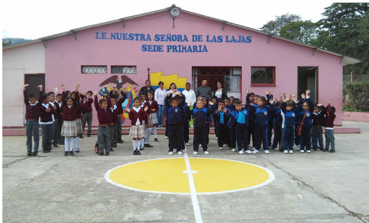
Figura 1. Institución Educativa Nuestra Señora de Las Lajas.

Actualmente cuenta con 390 estudiantes matriculados en los niveles de educación Preescolar, Básica primaria y Media académica. La población con la cual se desarrolló el proyecto está conformada por los estudiantes de los grados tercero y quinto; que en total suman 31 estudiantes con edades que oscilan entre 8 y 12 años.