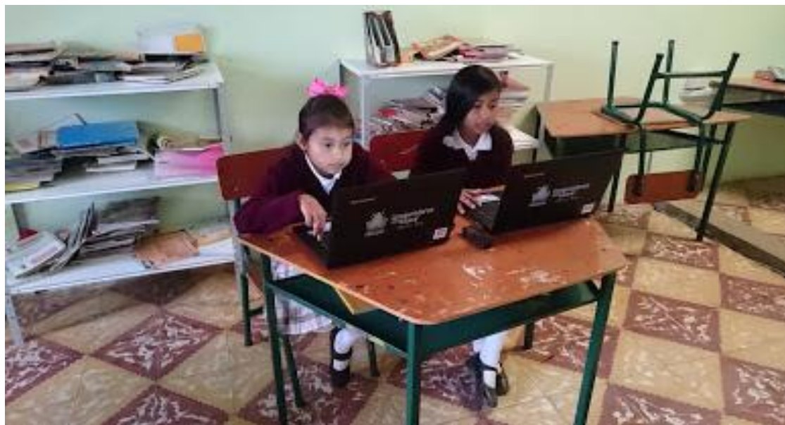
Figura 18. Foto grabación audio.

En el siguiente encuentro se hizo un ejercicio de pre grabado con todos los grupos para posteriormente hacer la grabación final del audio y pasar a editarlo en un software.