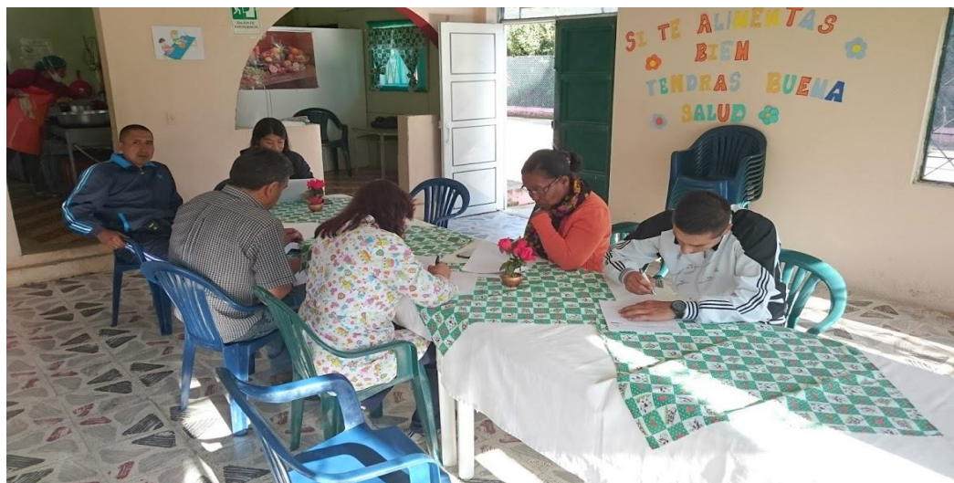
Figura 3. Encuesta a docentes.