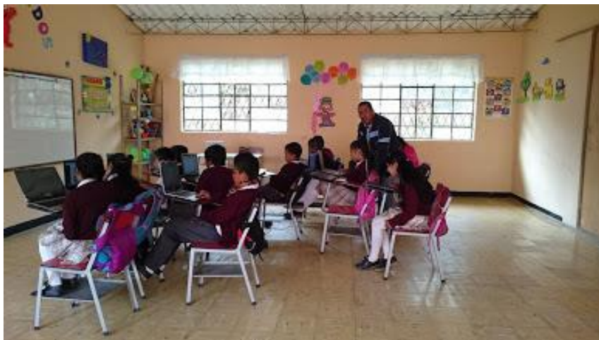
Figura 16. Foto lectura de cuentos.

Grabar un casete de poemas para enviar a otros niños o para hacer una emisión radial dota de sentido al perfeccionamiento de la lectura en voz alta porque los reiterados ensayos que es necesario hacer no constituyen un mero ejercicio, sino que se orientan hacia un objetivo valioso y realizable en el corto plazo -compartir con otras personas las propias emociones experimentadas frente a los poemas elegidos. (p. 33)