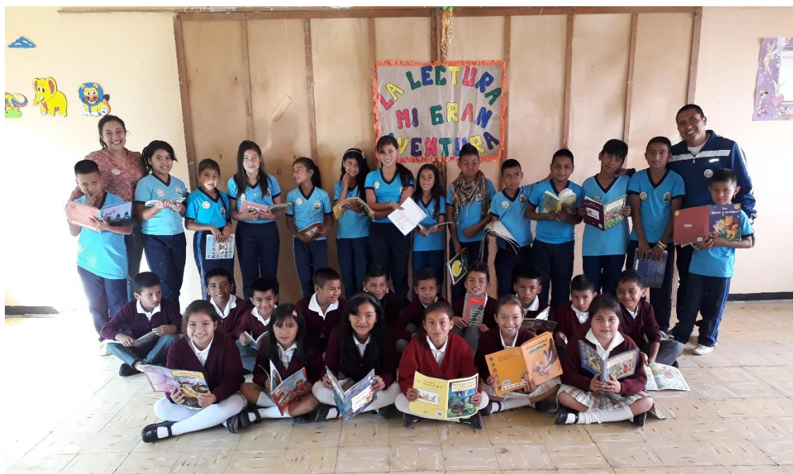
Figura 4 Proyecto de aula “La lectura mi gran aventura”

Cada proyecto es una experiencia única que ayuda al educando a construir su propio conocimiento. Esta estrategia es versátil ya que me permite transversalizar el conocimiento; sumando varias disciplinas para alcanzar un solo objetivo por tanto se considera importante y pertinente el trabajar un proyecto diferente para cada año escolar.