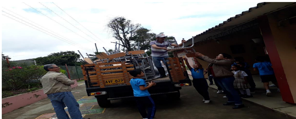
Figura 20. Foto entrega mobiliario donado para la sección primaria de la Institución Educativa Nuestra Señora de Las Lajas

Hoy en día la Institución Educativa en su sección Primaria ya cuenta con una biblioteca escolar que es un espacio acogedor, dinámico y funcional que conlleva a un cambio de metodología al ser útil para llevar a cabo diferentes estrategias didácticas y experiencias pedagógicas que desarrollan la imaginación y creatividad de los estudiantes; actualmente la biblioteca es el escenario donde se llevan a cabo los diferentes encuentros como el club de lectura, audio cuento, los padrinos de la lectura; también tiene una pequeña sala de audiovisuales en la que pueden ver videos, escuchar música; actividades que hacen más agradable e interesante su aprendizaje. También es un espacio importante para los docentes que buscan mejorar su práctica educativa, porque facilita el acceso al conocimiento y a la información; es un lugar de reunión donde se puede explorar y concertar ideas; esperamos que este espacio contribuya a elevar la calidad educativa y se convierta en un apoyo para el logro de un mejor rendimiento académico.