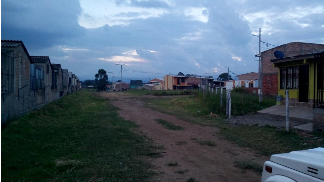
Figura 28. Barrio Villa Hermosa del Norte - COMUNA 2 (24/08/2017)