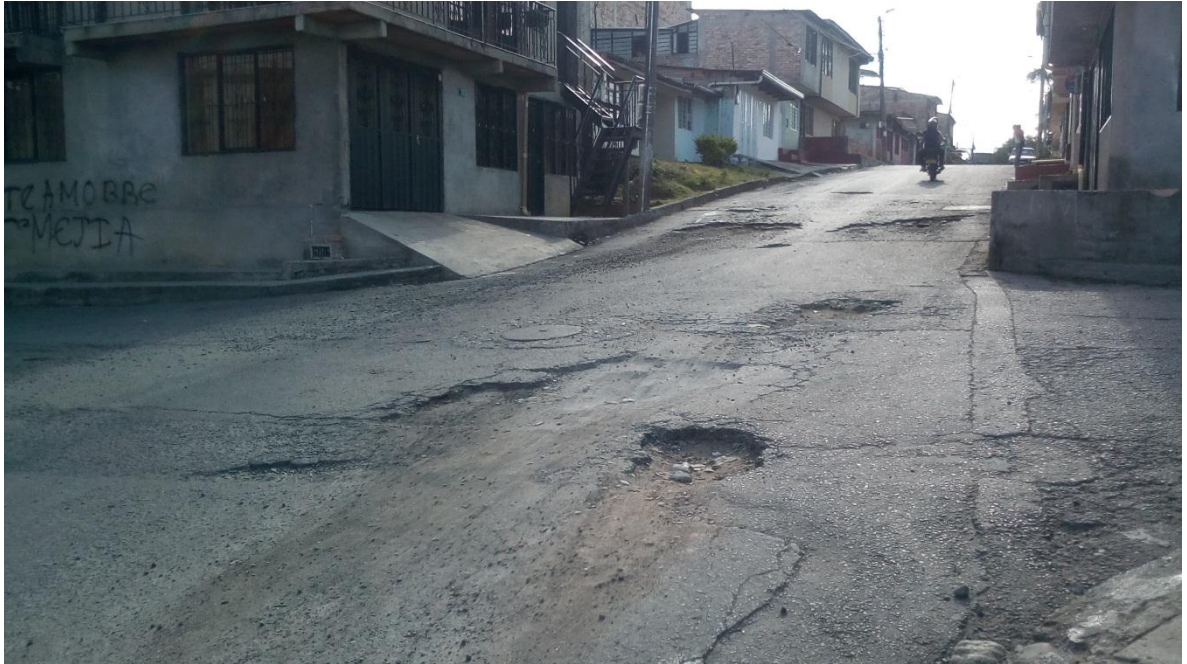
Figura 55. Barrio San José - COMUNA 9