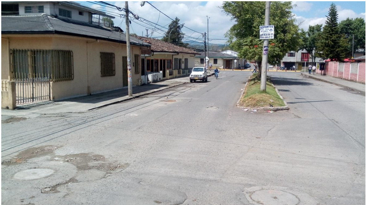
Figura 56. Barrio Colombia I Etapa - COMUNA 4