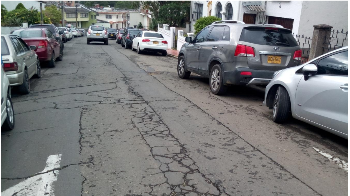
Figura 64. Sector Tulcán CDU - COMUNA 4