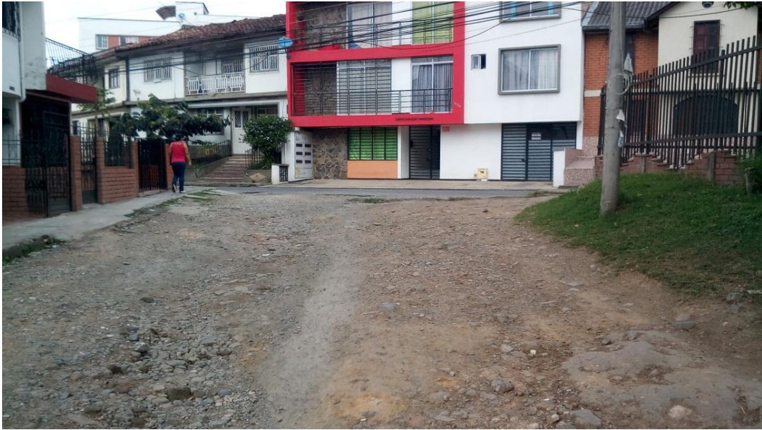
Figura 30. Barrio Santa Catalina - COMUNA 4 (13/09/2017)