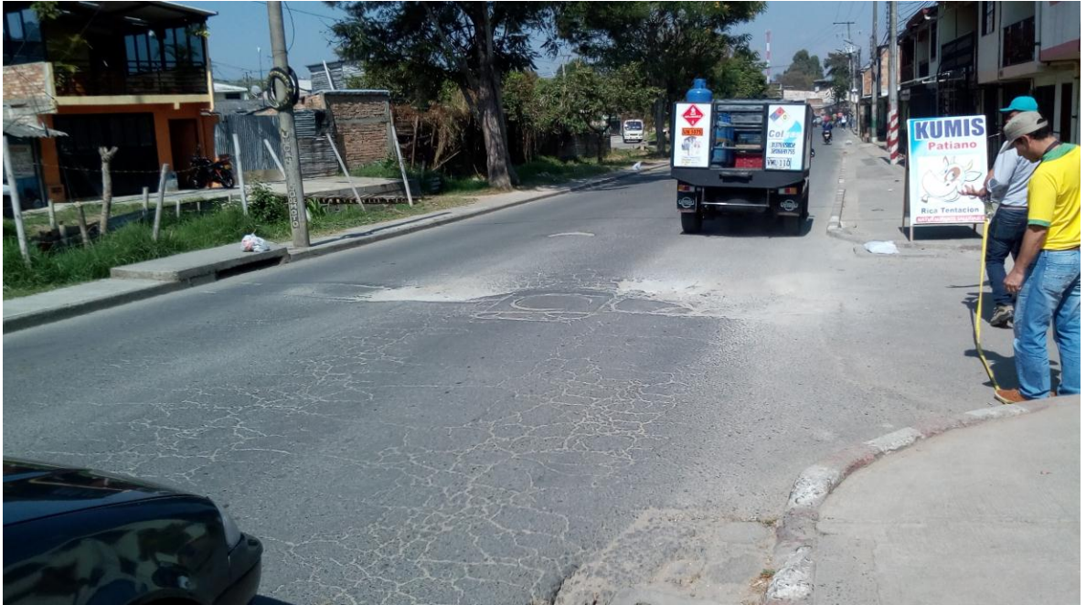
Figura 71. Carrera 6E- Barrio Berlín - COMUNA 5