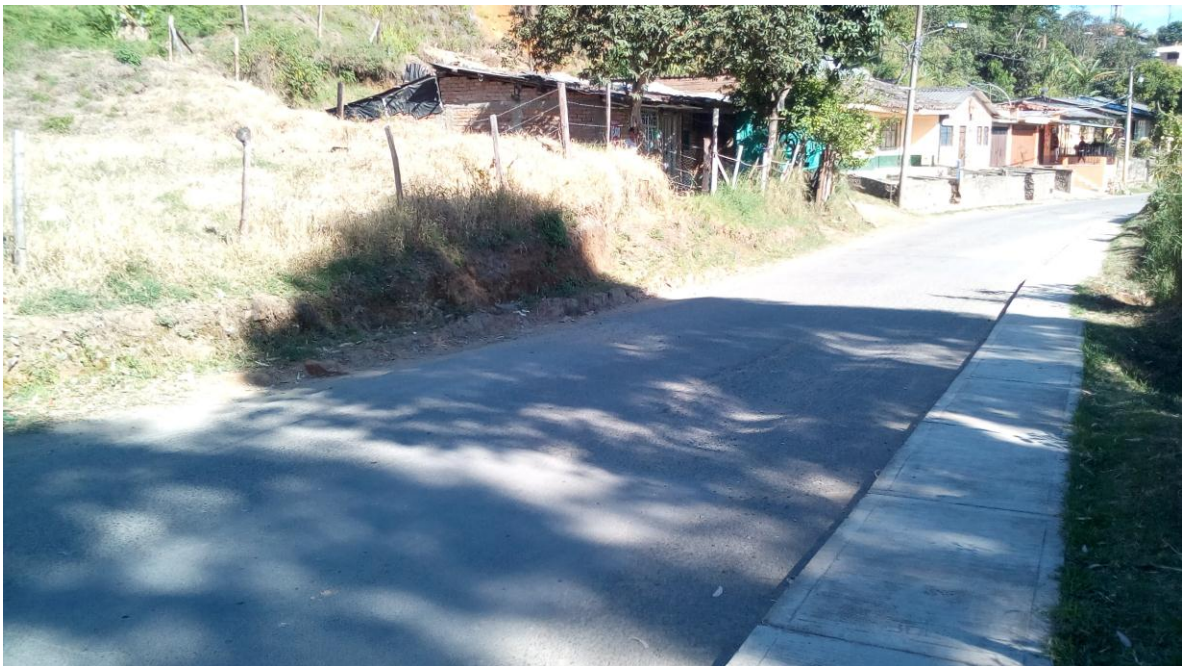
Figura 54. Barrio Colina Campestre (Vía a Pueblillo) - COMUNA 3

Visitas Realizadas el 1 de Agosto de 2017