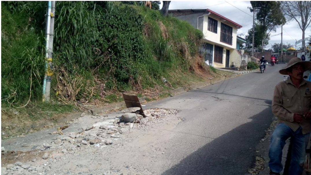
Figura 2. TRANSVERSAL 3 SUR (en la Y) - Barrio Calicanto - COMUNA 6

En la fotografía se observa el gran bache ocasionado por una intervención realizada por la Empresa de Acueducto y Alcantarillado. La comunidad manifiesta el temor a que se generen accidentes