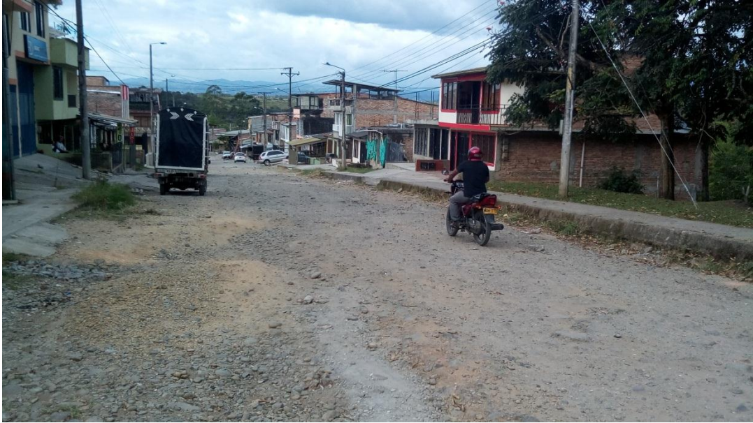
Figura 24. Villa Estrella - ZONA VEREDAL (11/08/2017)