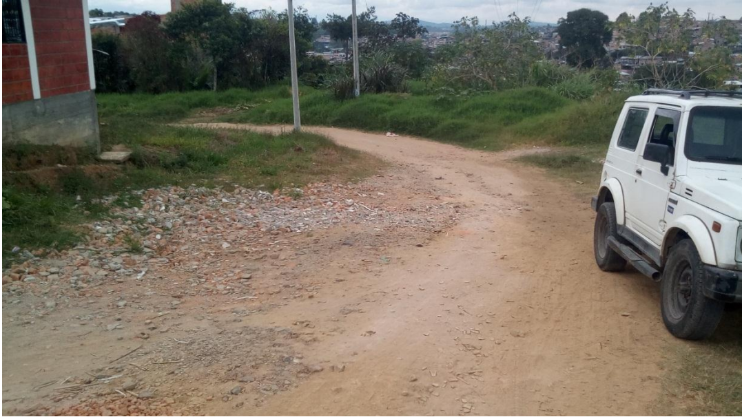
Figura 26. Barrio Álamos de Occidente - COMUNA 7 (18/08/2017)