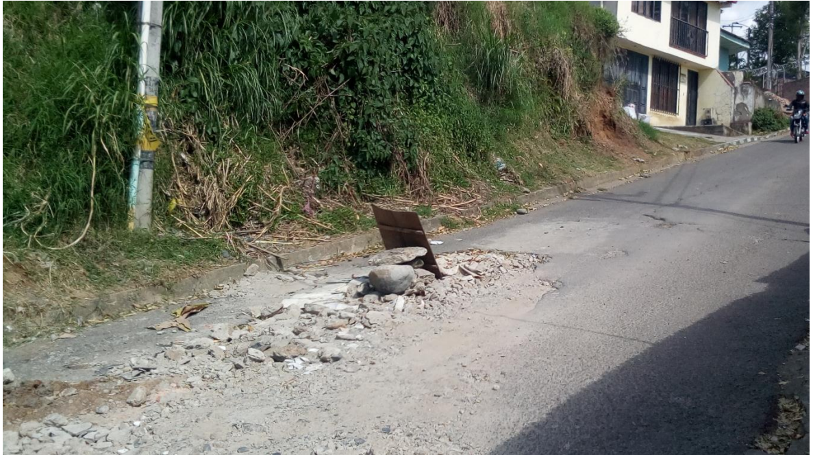
Figura 49. TRANSVERSAL 3 SUR (en la Y) - Barrio Calicanto - COMUNA 6