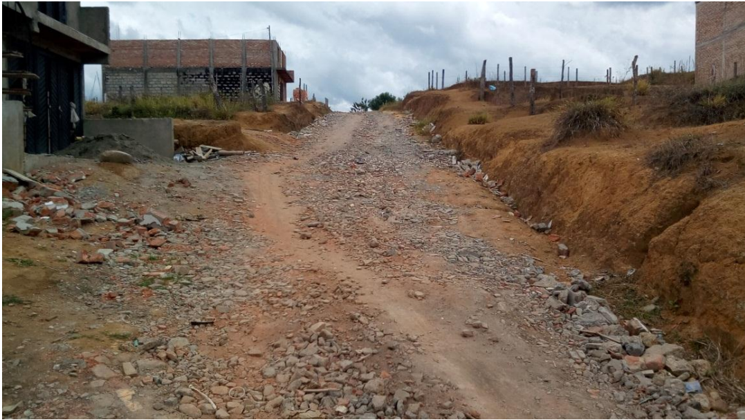
Figura 32. Urbanización Los Olivares - COMUNA 2 (13/09/2017)