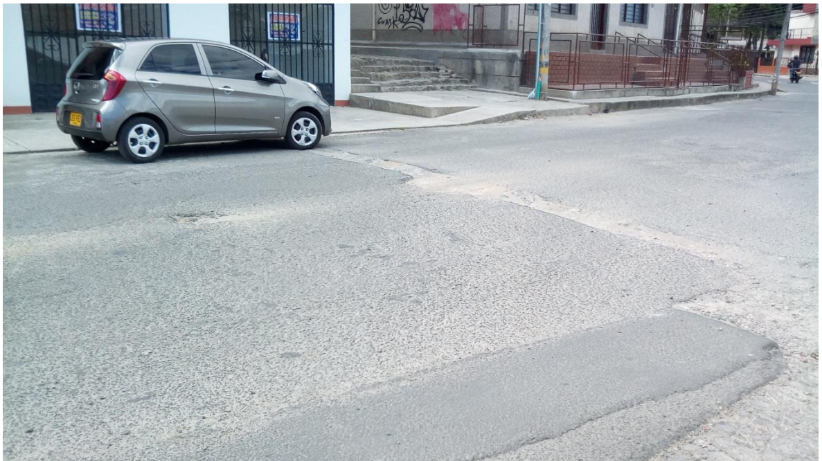
Figura 50. Calle 7 - Barrio Santa Inés - COMUNA 4