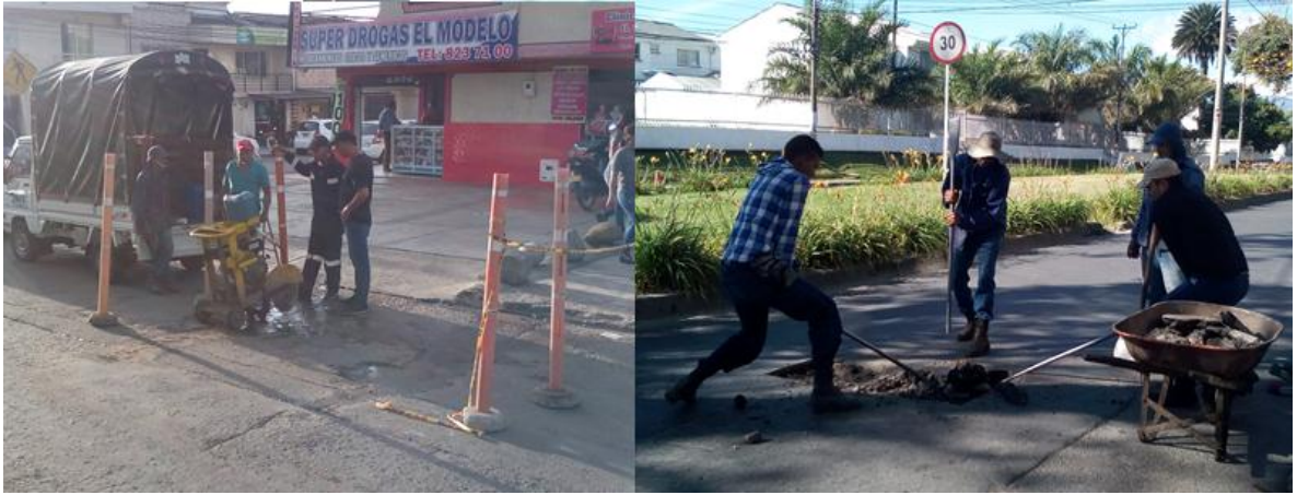
Figura 9. Rehabilitación y/o mantenimiento de la malla vial en la comuna 1- Carrera 9