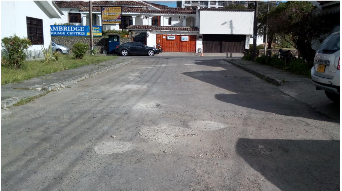
Figura 68. Calle 20N - Barrio La Villa - COMUNA 1