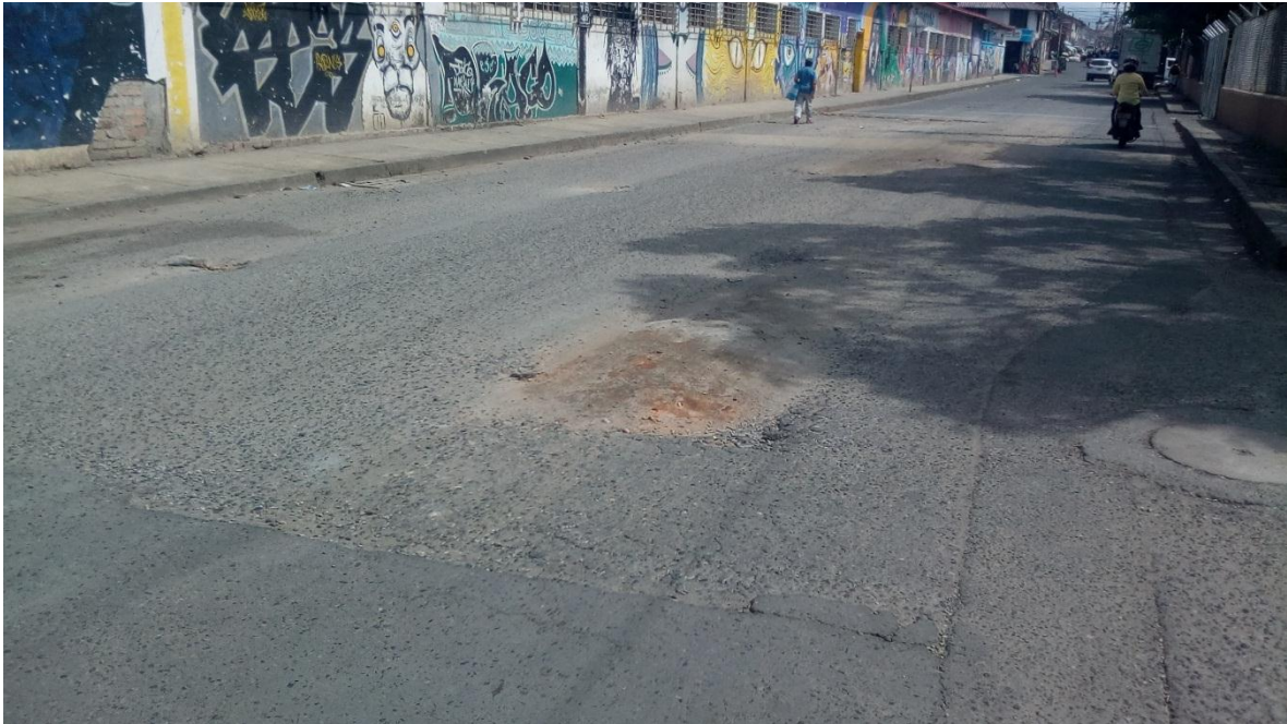
Figura 74. Calle 17N - Carrera 8-9 - COMUNA 1