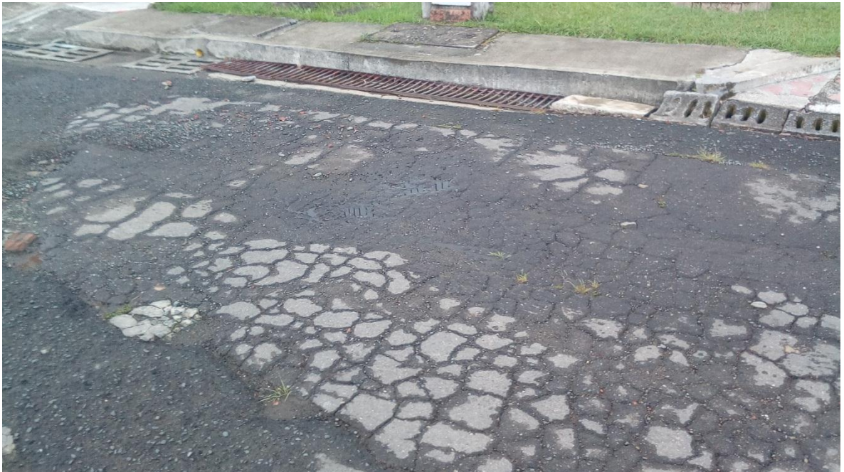
Figura 76. Urbanización Loma Linda - COMUNA 1

Visitas Realizadas el 29 de Septiembre de 2017