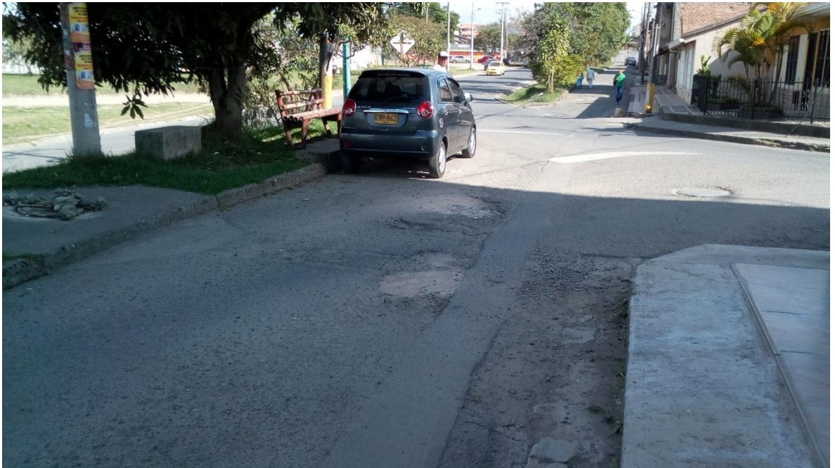
Figura 66. Barrio Sotar - COMUNA 3

Visitas Realizadas el 6 de Septiembre de 2017