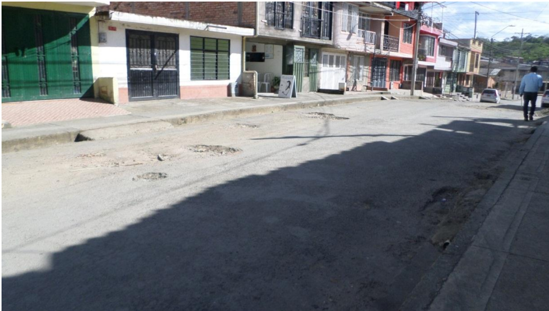
Figura 6. Visita Barrio Lomas de Granada – Comuna 9 (14/06/2017)