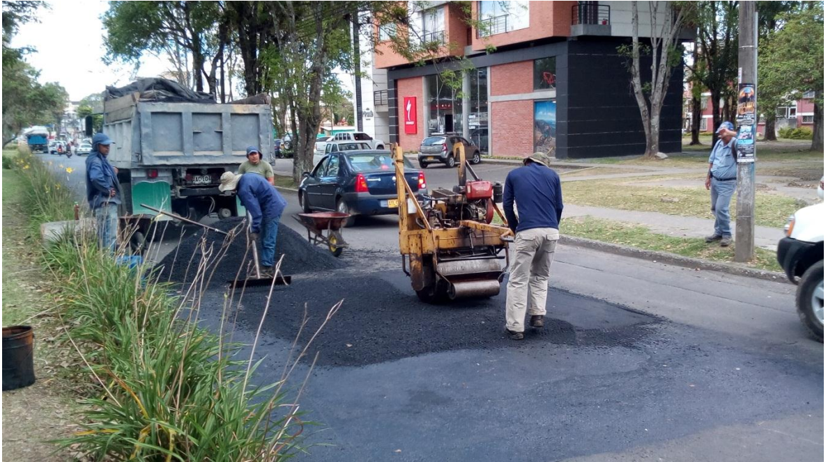
Figura 11. Rehabilitación y/o mantenimiento de la malla vial en la comuna 1- Carrera 9