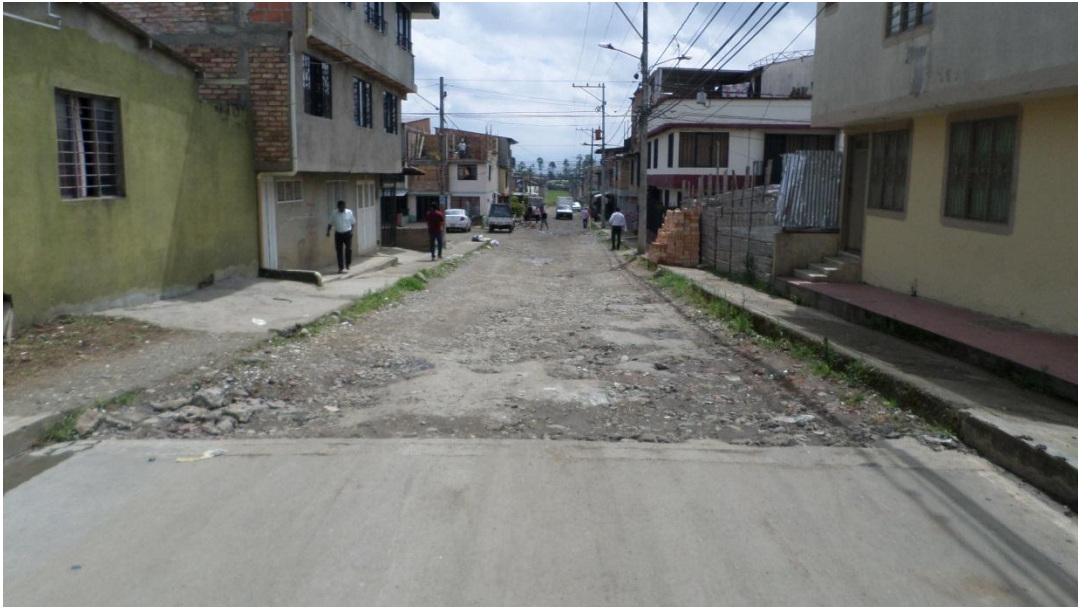
Figura 20. Barrio Villa del Norte LA PAZ - COMUNA 2 (20/06/2017)