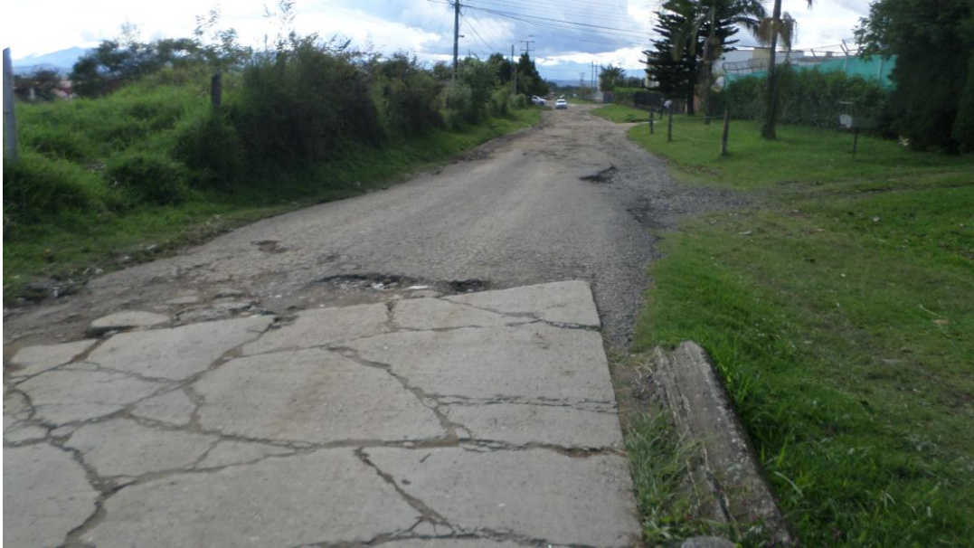
Figura 18. Calle 73N – Carrera 19 – COMUNA 2 14/06/2017)