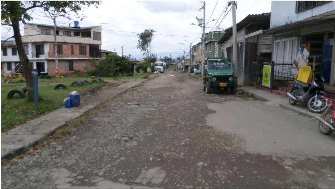
Figura 22. Barrio Villa García – COMUNA 6 (21/07/2017)