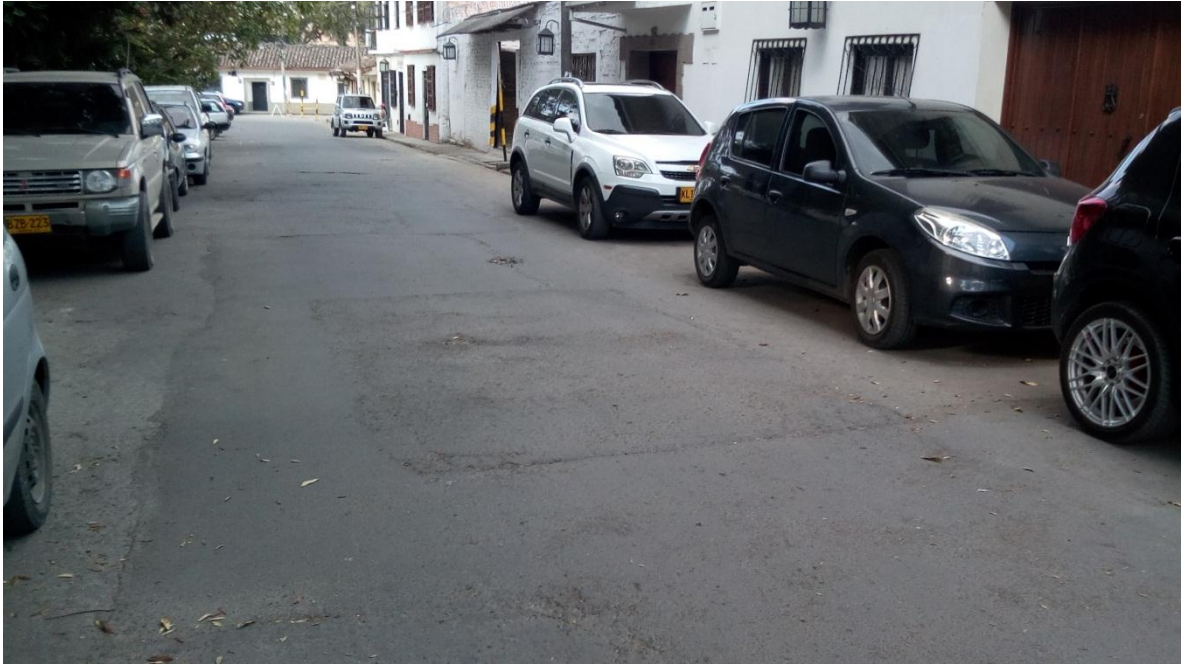
Figura 70. Carrera 10 – Calle 3 – COMUNA 4