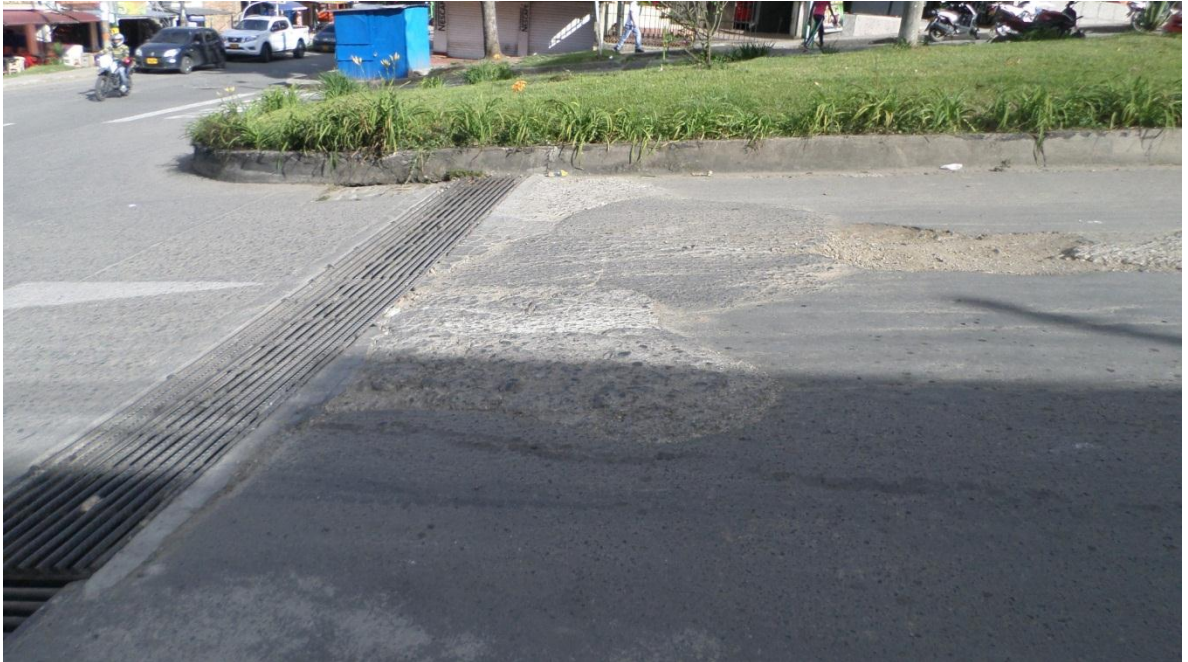
Figura 43. Barrio Lomas de Granada – COMUNA 9

Visitas Realizadas el 20 de Junio de 2017