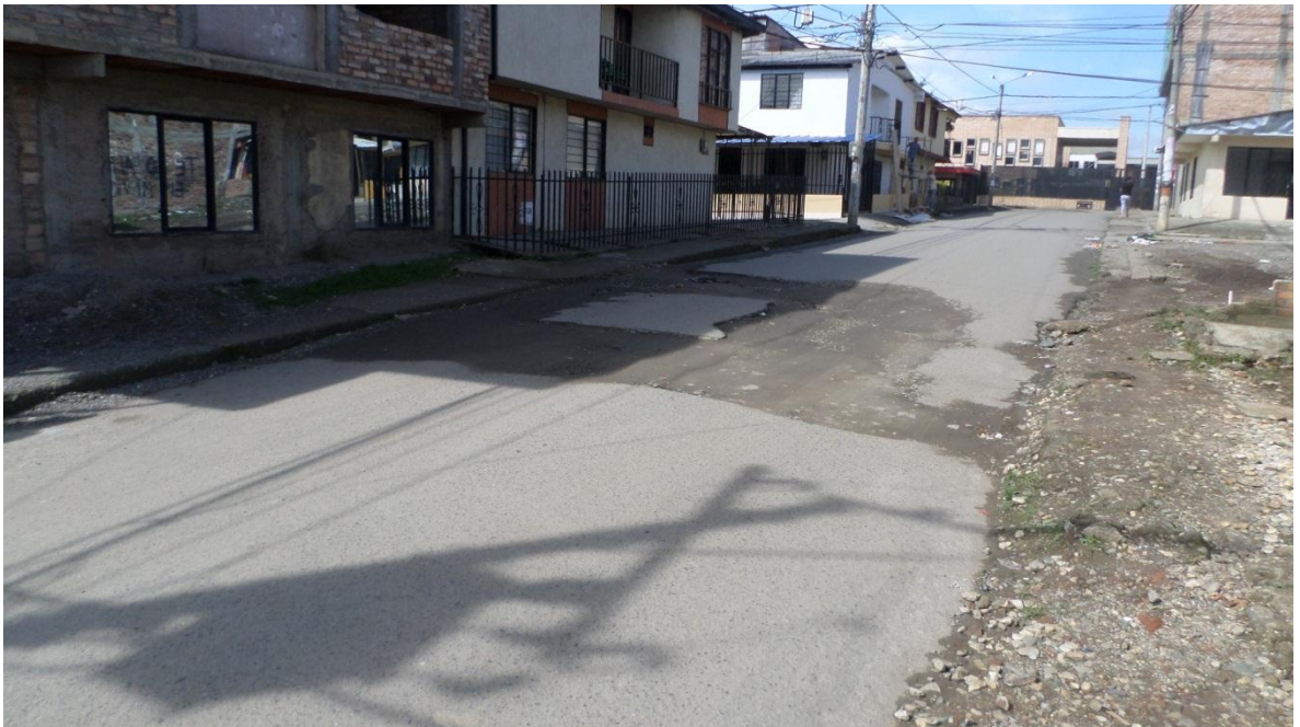
Figura 44. Barrio La Paz - COMUNA 2

Visitas Realizadas el 20 de Junio de 2017