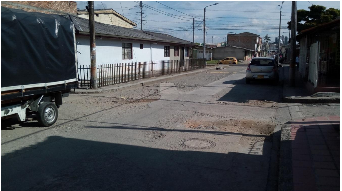
Figura 72. Barrio Los Comuneros - COMUNA 6