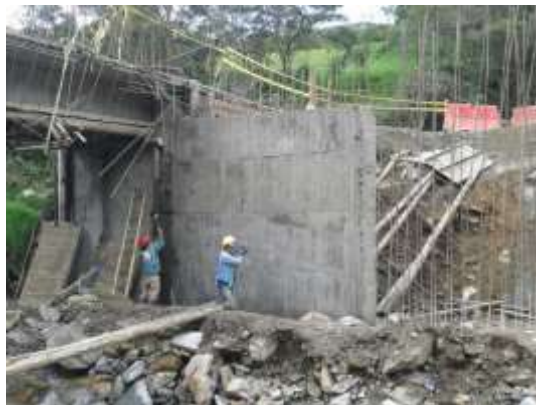
Instalacion de aceros de refuerzo y fundicion de vigas longitudinales y diafragmas - margen izquierdo