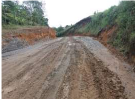
Se continúa la construcción de cunetas PR21+400 e inicio en el PR21+500