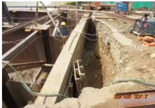
Demolicion de la ultima seccion que queda de los estribos existentes, de la pila central y retiro de escombros del lecho del rio