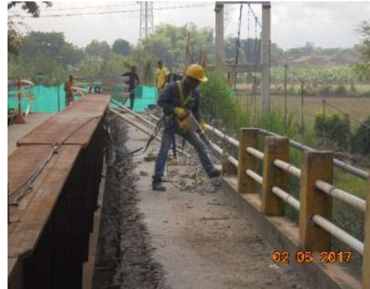
Demolición de estribos y fundición de los recalces en los estribos para ubicar la viga central.