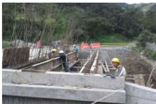
Construcción de filtro en el trasdós y relleno estructural para el puente en la quebrada quintero PR22+165.