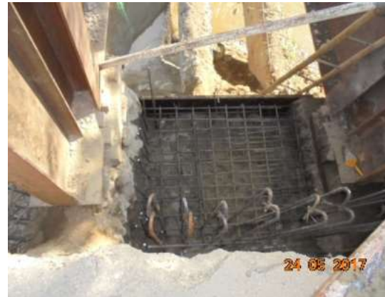
Fundición de solado de limpieza y recalce en los dos estribos con viga transversal de soporte en concreto de 4000 psi