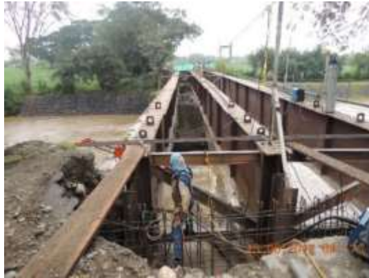
Fundición de muros de acompañamiento