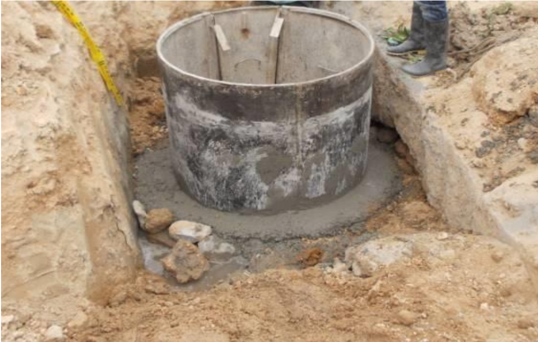
Figura 14. Formaleta metálica para pozo PZ21