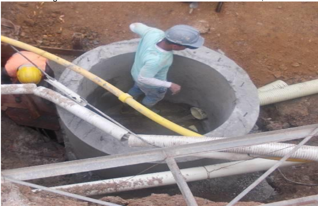
Figura 18. Fundición del Pozo en concreto de 3000 PSI, PZ10