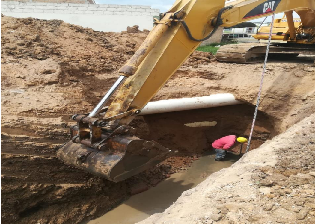
Figura 17. Fundición del Pozo en concreto de 3000 PSI, PZ9B