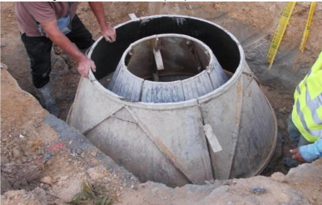
Figura 15. Formaleta metálica para pozo PZ13