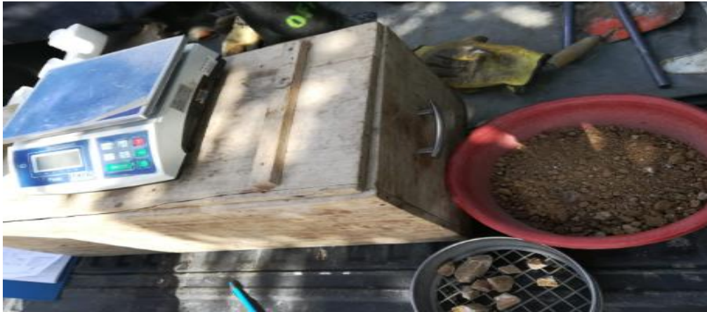
Figura 24. Ensayo de densidad In Situ