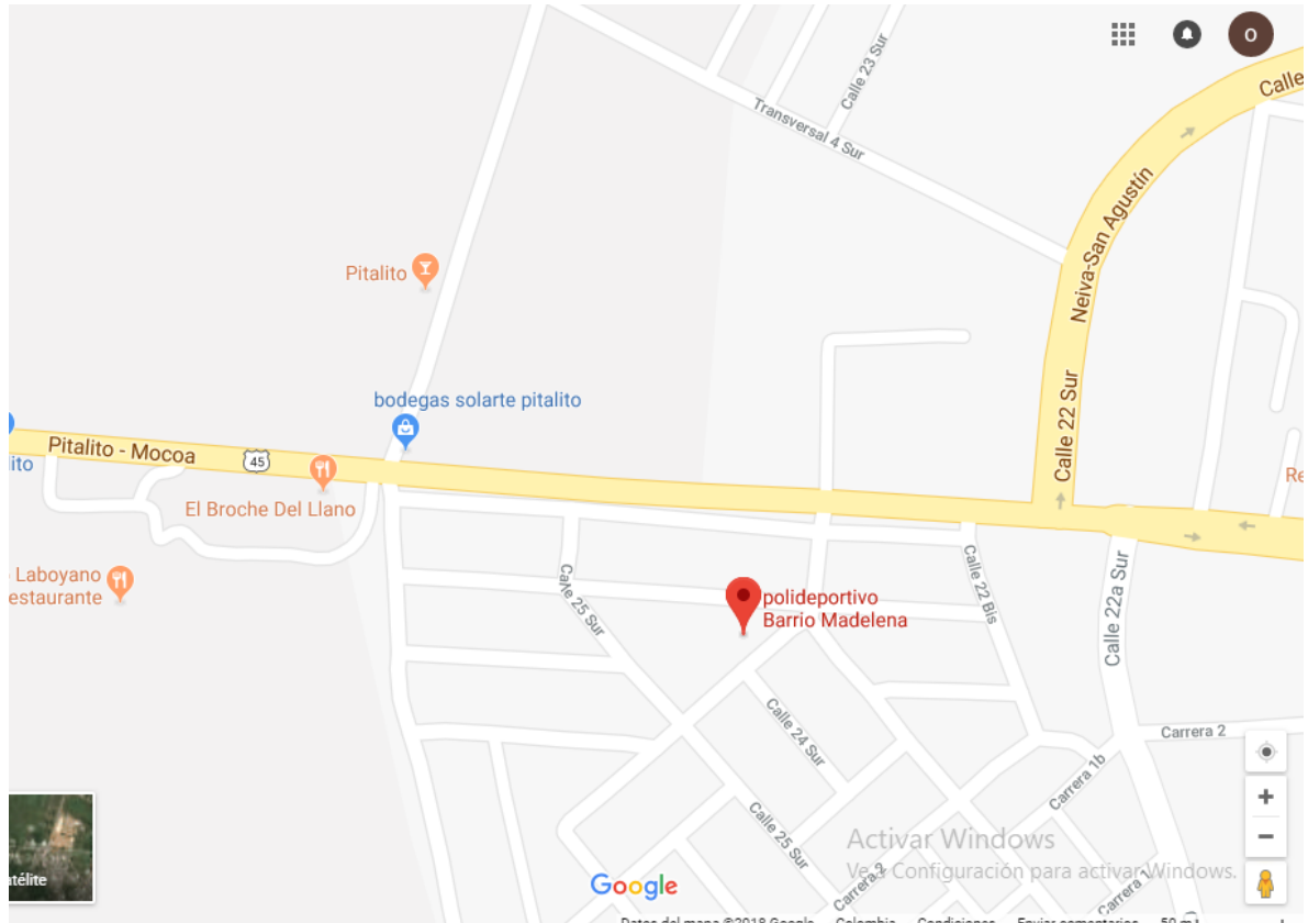
Figura 1. Ubicación

El barrió Madelena está ubicado a las afueras de la ciudad de Pitalito entre la vía que comunica a la Ciudades de Mocoa y Pitalito.