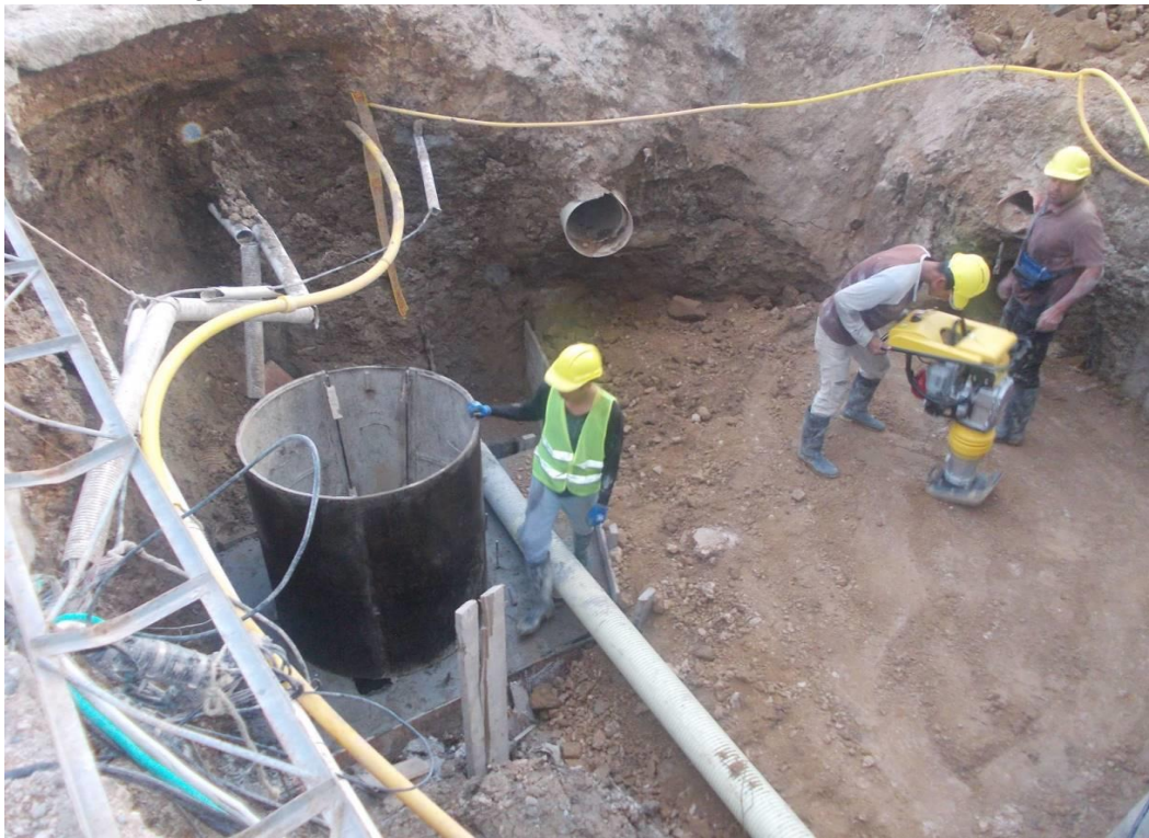
Figura 16. Fundición del Pozo en concreto de 3000 PSI, PZ10