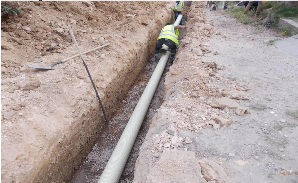
Figura 3. Instalación de tubería sanitaria en PVC de 10"