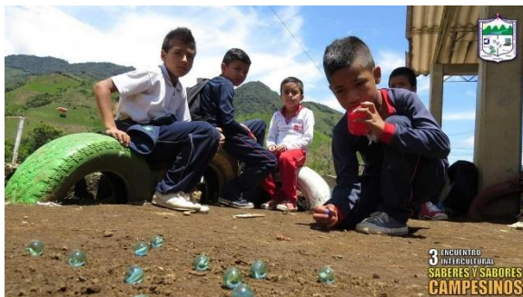
Institución Educativa Sinaí (2017)

Es evidente que en proceso educativo “necesariamente, toda comunidad de aprendizaje se funda sobre todo en las personas que actúan, no sólo en su mera estructura global u organización formal” (Balduzzi, 2015, p.144). El liderazgo para el aprendizaje del maestro en el aula y sus prácticas pedagógicas deben impulsar y motivar transformaciones que favorezcan la comunidad educativa en general, y eso es justamente lo que se observa de manera particular en el proceso de preparación para el Intercambio cultural de Sabores y Saberes Campesinos. Es claro, que el rol de líder no es el concepto clásico formal, Balduzzi (2015) lo relaciona con un liderazgo educativo “que implica escoger las finalidades en función de su relevancia formativa, y la personalización es sin duda una de las más importantes” (p.148), es decir, que pueda retomar los espacios de formación en un sentido profundo y no sólo al servicio de la mera transmisión de información y contenidos, pues este consiste en «el arte de influir sobre las personas para que trabajen con ilusión en la consecución de fines que merezcan la pena» (Balduzzi, 2015 cita Sonnenfeld, 2011, p. 169). En consecuencia, personalizar conduce a considerar que la educación no se agota en que cada estudiante adquiere un dominio de las habilidades concretas, es deber del maestro: