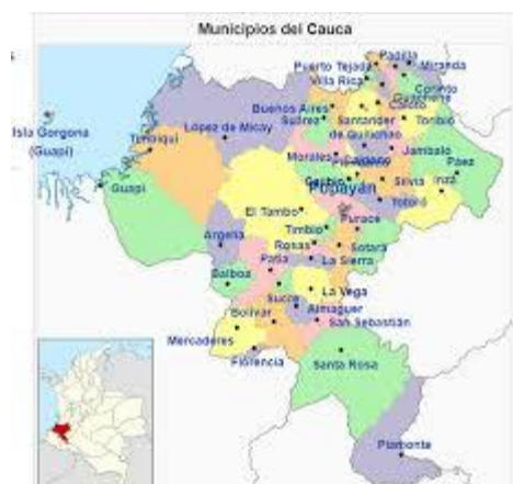
Mapa 1. Departamento del Cauca

https://www.cauca.gov.co/Dependencias/OficinaAsesoradePlaneacion/InformacioneIndicadores/Perfil%20Departamento%20del%20Cauca.pdf