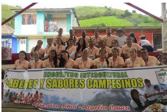
Institución Educativa Sinaí (2019)

En este encuentro se desarrollan las finales de los juegos “intercursos”, que se promueven desde la Escuela Deportiva de la Paz, torneo que se desarrolla durante el año en los descansos dirigidos. Así mismo, ha sido una estrategia para ir al rescate de los juegos tradicionales y los juegos de mesa, para recrear de nuevo la memoria campesina, como son “el ponchao”, “los bolos”, canicas, “el juego del yeimi”, el ajedrez, el parqués, el dominó, entre otros juegos que se han ido relegando ante la aparición de la tecnología. Esto lo lidera el profesor de Educación Física con el apoyo de los estudiantes que realizan las horas de servicios sociales. Este intercambio también genera mucha motivación entre los estudiantes y la comunidad en general.