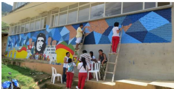
Institución Educativa Sinaí (2015)