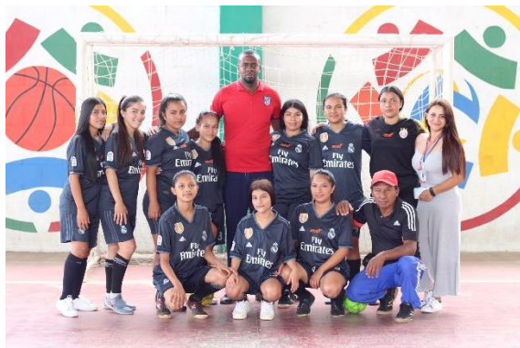
Institución Educativa Sinaí (2022)

Los juegos Supérate en los últimos ocho años, han sido un escenario muy relevante para la participación de la Institución. Incluso los estudiantes han representado el municipio en varias competencias y también han ido en representación del departamento del Cauca a intercambios nacionales. “A ellos les gusta practicar el fútbol y el fútbol sala y, en los últimos años, aquí en el colegio hemos tenido buenas presentaciones en los Juegos Supérate” (ED3.10.2). En varias oportunidades, antes de pandemia, se estuvo en las finales en este certamen deportivo.