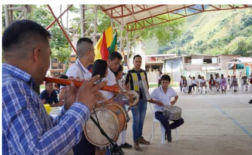
Institución Educativa Sinaí (2022)