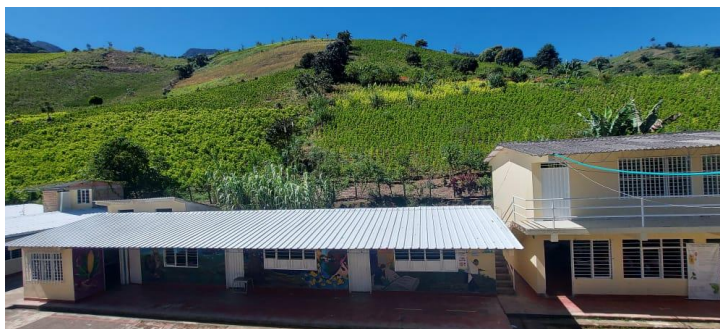
Fotografía 2 Institución Educativa Sinaí