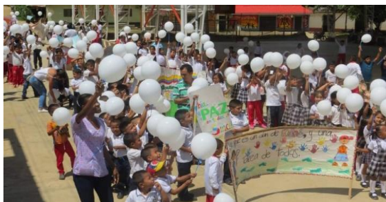
Institución Educativa Sinaí (2017)

En ese sentido la visión para el año 2025 es que la Institución Educativa Sinaí sea una institución dotada con las herramientas y recursos humanos, físicos, tecnológicos, pedagógicos y científicos necesarios para garantizar la educación integral de calidad formadora de ciudadanos competentes comprometidos con su proyecto de vida y la construcción de una sociedad pacífica y tolerante, que responda a las exigencias del mundo globalizado y contribuya al desarrollo del país, sin perder la identidad, para el crecimiento personal y comunitario (IES, 2020, p.15).