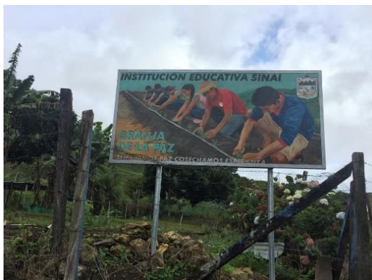
Institución Educativa Sinaí (2022)