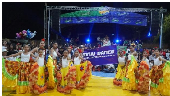
Institución Educativa Sinaí (2022)