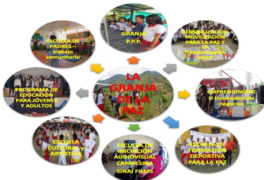
Fotografía 3. Los ocho (8) Ejes Pedagógicos de la Institución Educativa Sinaí.

Asimismo, está el “Encuentro Intercultural de Saberes y Sabores Campesinos”, como espacio de exposición y articulación de las experiencias de cada eje de trabajo.