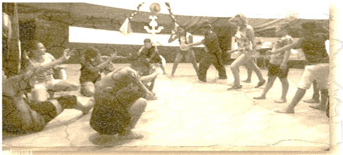
Ilustración 15 Lazos de confianza