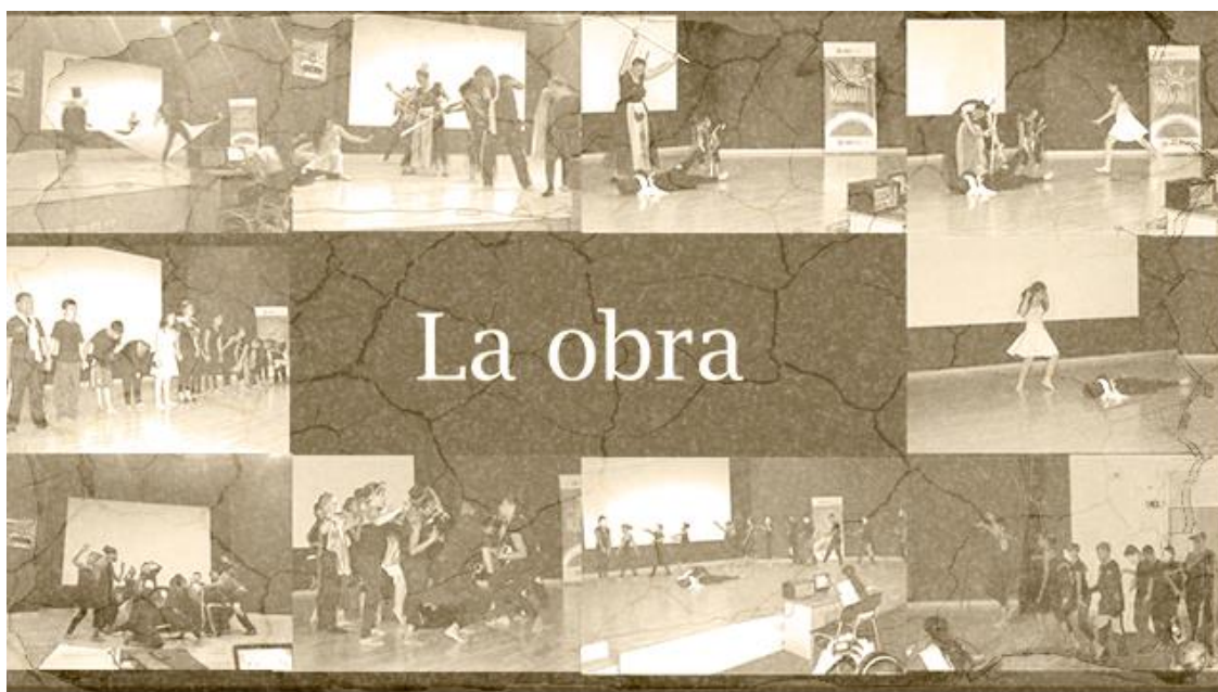
Ilustración 14 Recopilación de imágenes sobre la obra presentada por la tripulación

Se resalta la alegría de los marineros, se reencuentran los abrazos, las miradas hoy son brillantes y esperanzadoras, los aplausos no se hicieron esperar, el grito de júbilo se escuchó por todo el puerto, el día de hoy se deja constancia que el Gloria navegó por casi un año acompañado por el hermoso Mar y los cuerpos Celestes en búsqueda de un gran sueño, borrar la idea de fracaso que deja el corsario Ruido en Exceso a su paso por la vida de las personas. Fin de la anotación.