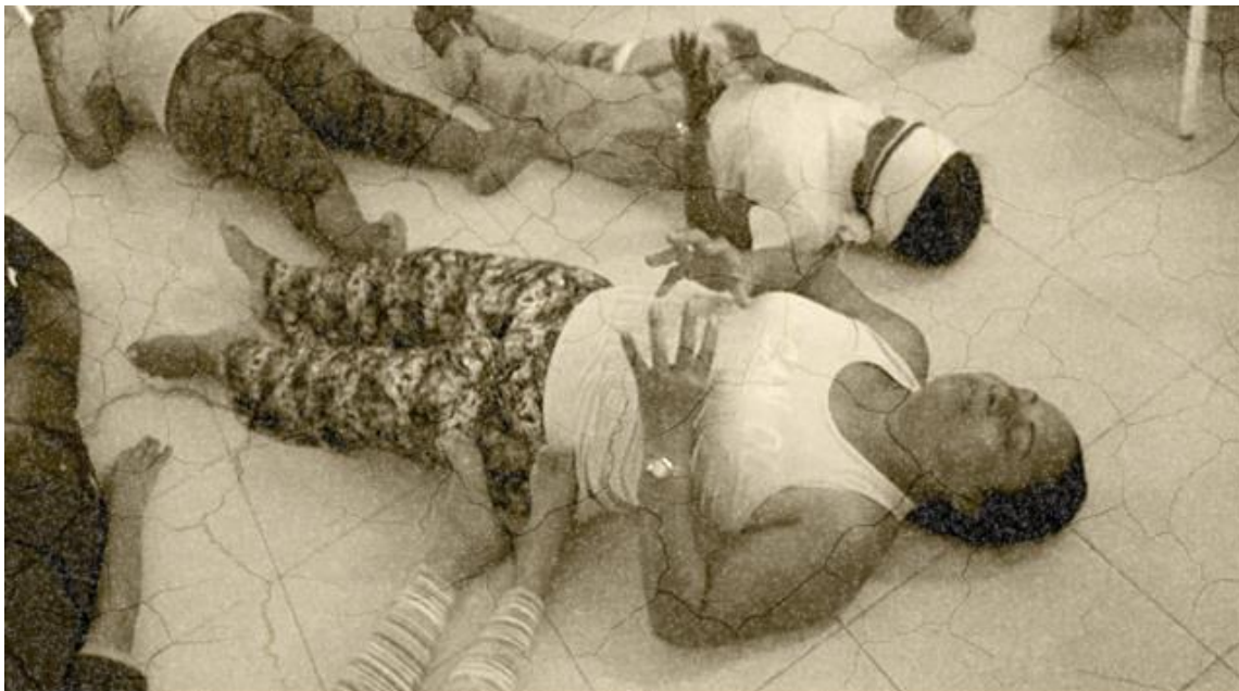
Ilustración 11 Ejercicio de introspección: la bola de fuego"

Para tal fin, el capitán Silencio se apoya principalmente de la tranquilidad y musicalidad de las olas del mar y asigna estratégicamente al serviola 7 ; un soñador y aspirante a educador para el Nuevo Mundo, la tarea de guiar la actividad desde las alturas del galeón, en el carajo 8 , donde también algún día, ansioso de terminar en paz el viaje, gritará para todos, ¡Tierra a la vista!