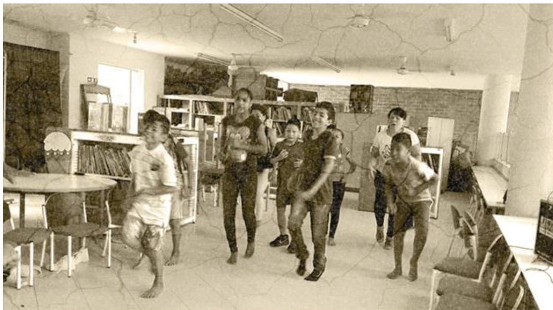
Ilustración 10 Ejercicio teatral "los caminados"