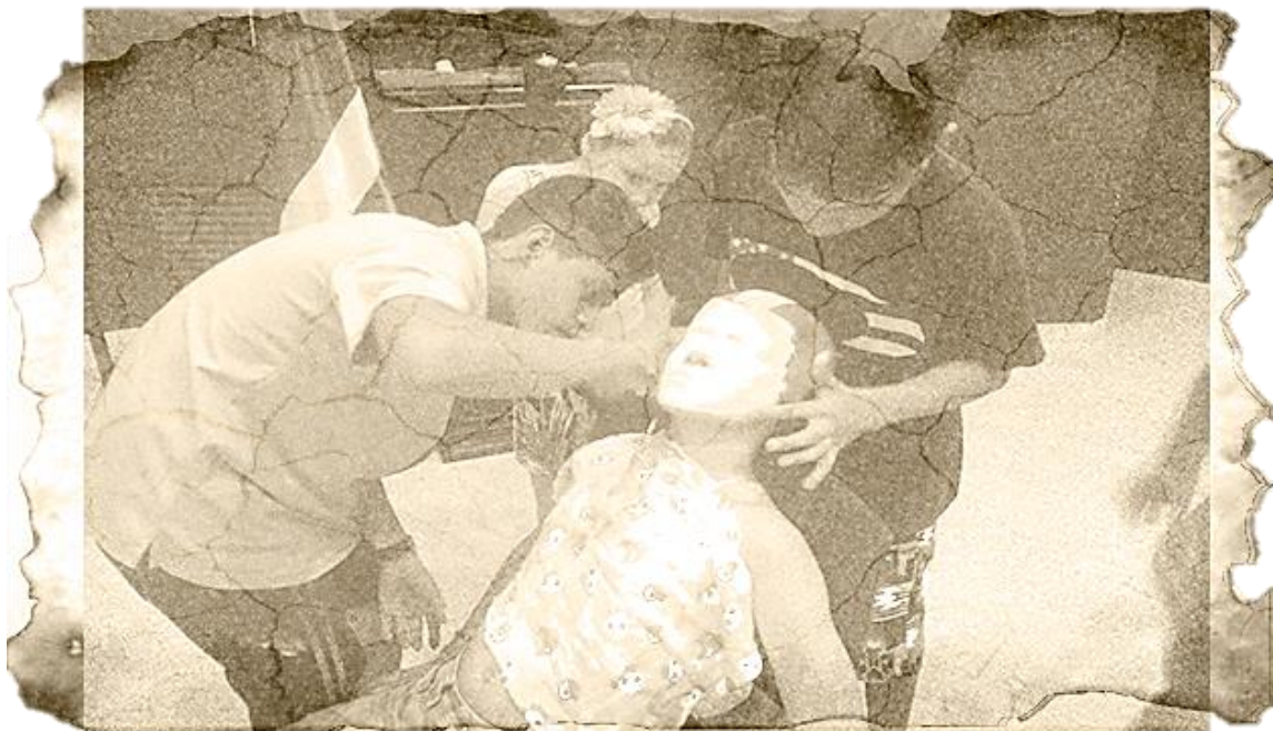
Ilustración 16 Elaboración de "mascaras neutras"

¡Y el cuerpo! Dijo el oficial Teatro Físico, con voz fuerte, allegando al barco, ¡y el cuerpo! Repitió, ¿qué sería de este viaje si la tripulación de este Galeón no hubiese concentrado su energía en su cuerpo? que mejor encuentro consigo mismo que sus momentos de respiración antes de cada jornada. Recuerde mi capitán lo que decía Goleman (1995), adjunto el oficial, los ejercicios de respiración optimizan el desarrollo cerebral de los marineros para mejorar su atención y reducir el efecto del estrés, es un buen elemento este de la respiración para empezar el día a bordo de cada galeón, el Gloria es un ejemplo de ello, su virtud, los resultados de su tripulación y su gran botín, son hoy fruto de hacer consiente lo inconsciente, respirar profundamente 1, 2, y 3, sostiene 4, 5, 6, 7, 8, 9 y suelta 1, 2, y 3.