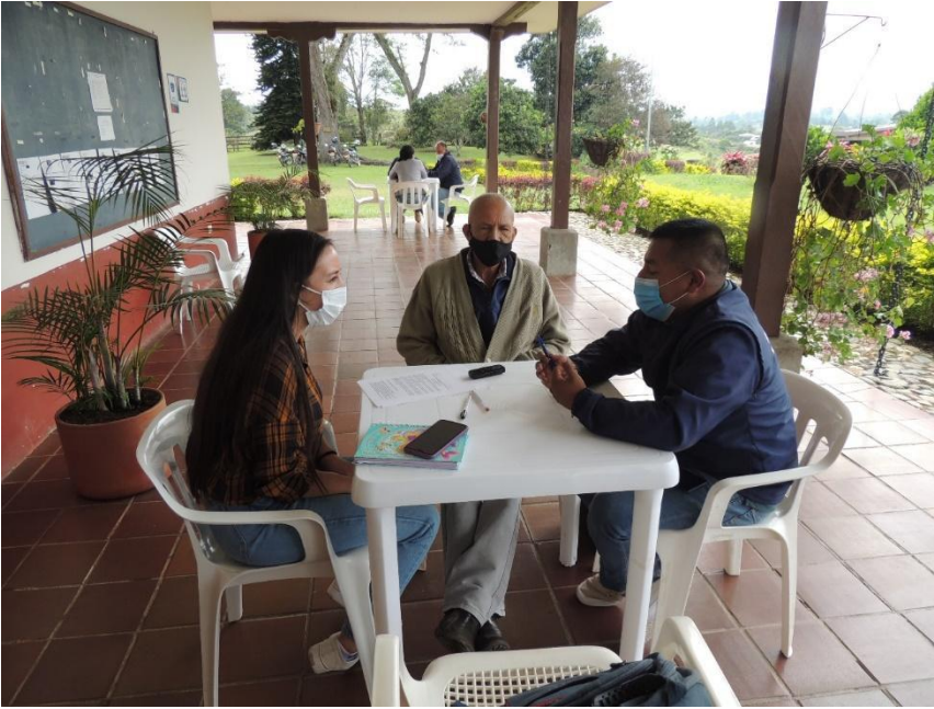
Fotografía N°5. En la foto entrevista a los representantes legales del Acueducto Comunitario Las Cruces.