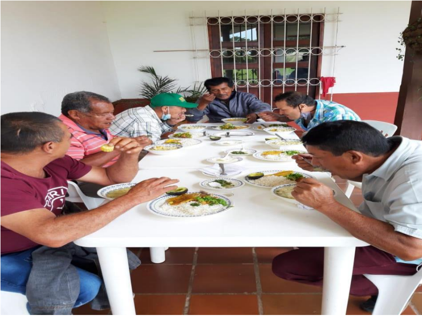
Fotografía N°9 Refrigerio con los representantes de los Acueductos Comunitarios.