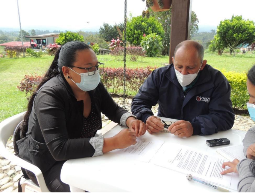
Fotografía N°7 (Nombres)