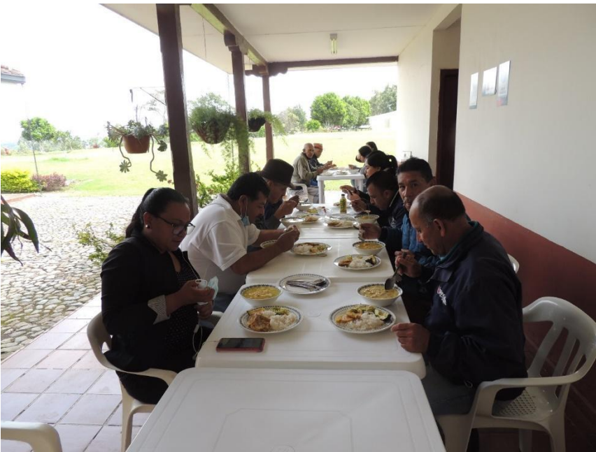
Fotografía N°13 Refrigerio a representantes Comunitarios