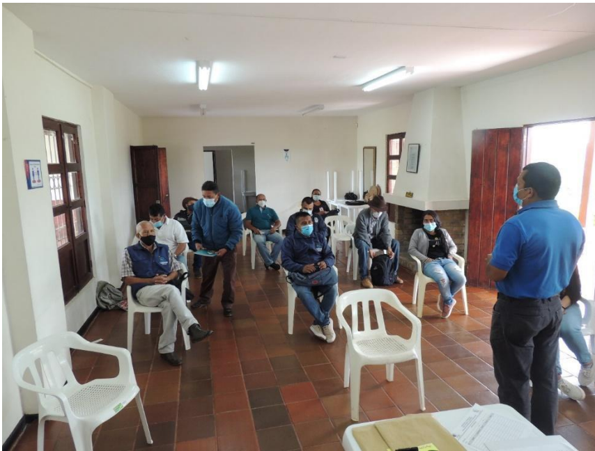
Fotografía 1 apertura del taller

Representantes de los Acueductos Comunitarios (Brisas del Paramillo, Las Cruces, Aires del Campo y Saladito)