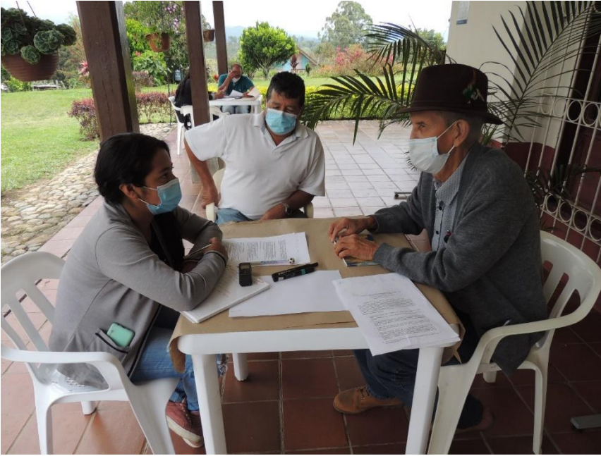
Fotografía N°12 Entrevista a representantes del Acueducto Comunitario