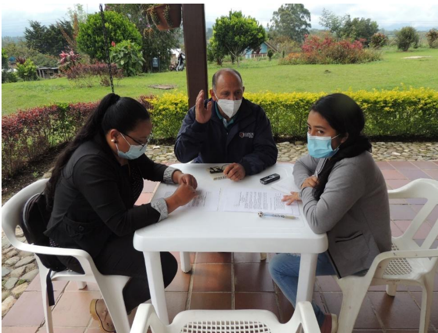
Fotografía N°4 Fotografía entrevista a Acueducto Comunitario de ...