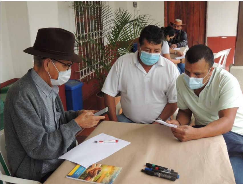
Fotografía N°11 Cartografiar Social