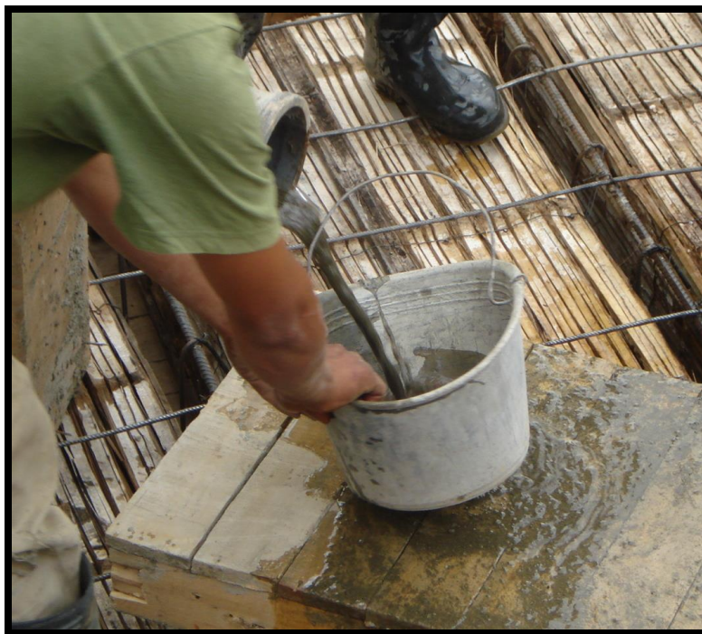
FOTO 47. SALIDA Y EVACUACION DE LA PURGA

Cuando la mezcla se aproxima a la salida, se detiene por un momento el bombeo y se procede a conectar “el moco” al extremo, y después de conectado, se continúa con el proceso.