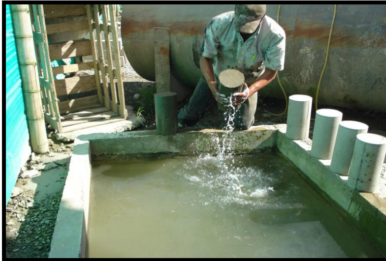
FOTO 24. OPERARIO SACANDO CILINDROS LISTOS PARA ENSAYOS

Cuando los cilindros están listos para ser llevados al laboratorio, estos se deben transportar con mucho cuidado, y el laboratorio donde se llevan, cuenta con unas cajas divididas en secciones que ayudan a transportarlos sin que sufran ningún tipo de maltrato.