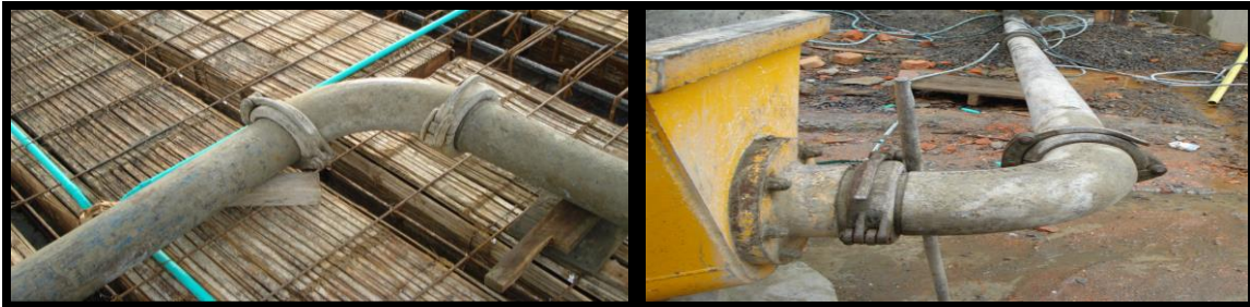
FOTO 34. DETALLE DE CODOS ACOPLADOS A LA TUBERIA

cuenta con codos y semicodos del mismo material de los tubos y en una variedad de ángulos que facilita la colocación de la tubería en lugares en donde se podría presentar alguna dificultad. Vale la pena mencionar que la primera parte de la tubería se conecta a la tolva de la bomba desde donde es impulsado el concreto.