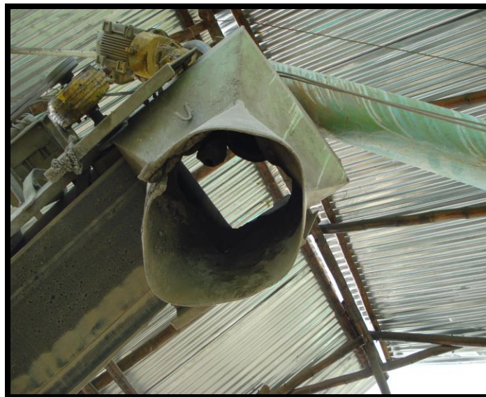
FOTO 15. TOLVA QUE RECIBE LOS AGREGADOS DE LA BANDA TRANSPORTADORA