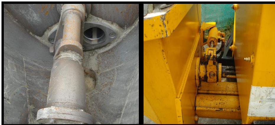
FOTO 39. MECANISMO DE BOMBEO

Una de las ventajas que pude apreciar al bombear concreto, es que la tubería ocupa poco espacio, obstaculizando al mínimo el paso de los trabajadores dentro de la obra y por los lugares donde se ha dispuesto.