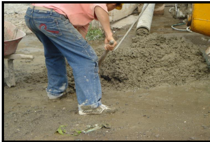
FOTO 33. RECOLECCION DE CONCRETO VACIADO EN EL PISO

cuando la descarga se hace directamente sin utilizar bomba el cuidado que se debe tener es al momento de la descarga es que el piso donde se va a acumular el concreto este limpio, o en caso de vaciarlo directamente sobre las carretillas, el operador del mixer debe controlar la cantidad de material que descarga cada vez para evitar problemas de desperdicio.