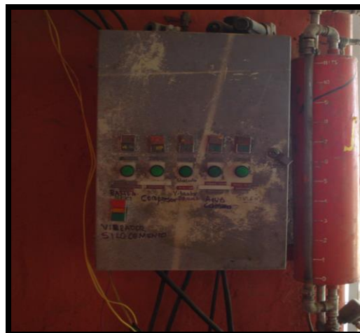
FOTO 18. CONTROLADOR DE DISPOSITIVOS ELECTRONICOS

Desde la caseta de control, un operario se encarga de ir adicionando los materiales que forman la mezcla de concreto uno a uno y en el orden correcto mediante un mecanismo electrónico conectado a las tolvas que contienen los agregados y al silo donde está almacenado el cemento.