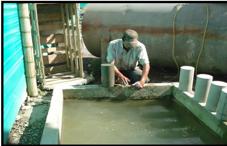
FOTO 23. OPERARIO VERIFICANDO CILINDROS ENUMERADOS