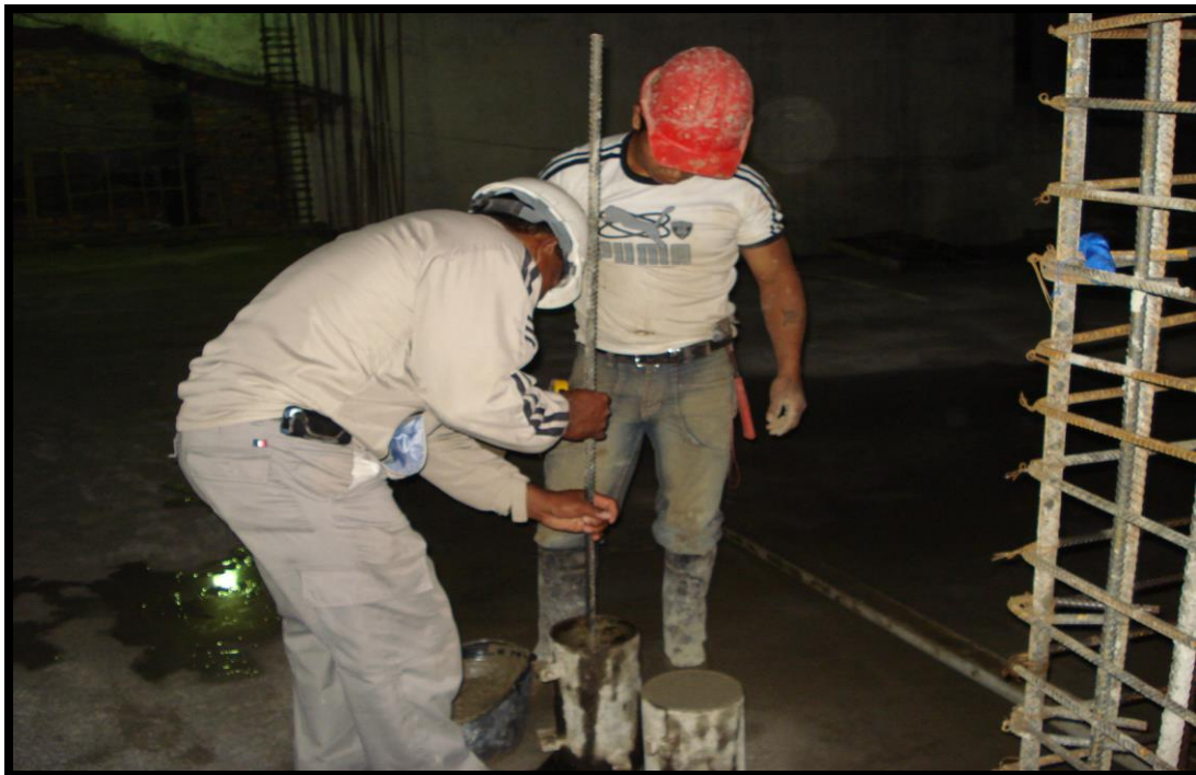
FOTO 58. ERRORES EN LA TOMA DE CILINDROS

Por esta razón es necesario que la persona encargada de hacer este tipo de ensayos se encuentre muy bien capacitada para tal fin.