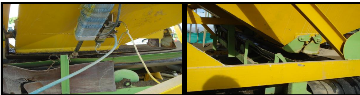
FOTO 20. COMPUERTAS DE CONTROL DE LAS TOLVAS DE AGREGADOS

Por medio de este mecanismo se puede controlar unas compuertas que están ubicadas debajo de cada tolva y que dejan caer cada uno de los agregados sobre la banda transportadora en la cantidad correcta para evitar desperdicios.