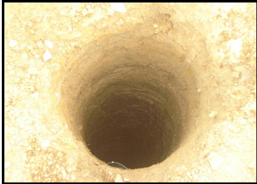
FOTO 48. EXCAVACION PARA PILOTE

Con el pilote excavado el paso a seguir es introducir el refuerzo dentro de el.