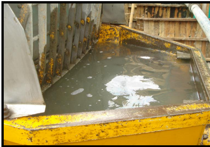
FOTO 44. AGUA CON PURGA

Para este proceso lo primero que se hace es llenar la tolva completamente con agua, garantizando que no se produzca fuga por ninguna parte, una vez llena la tolva se agrega al agua la purga y se mezcla durante algunos minutos con las manos hasta obtener una consistencia gelatinosa.