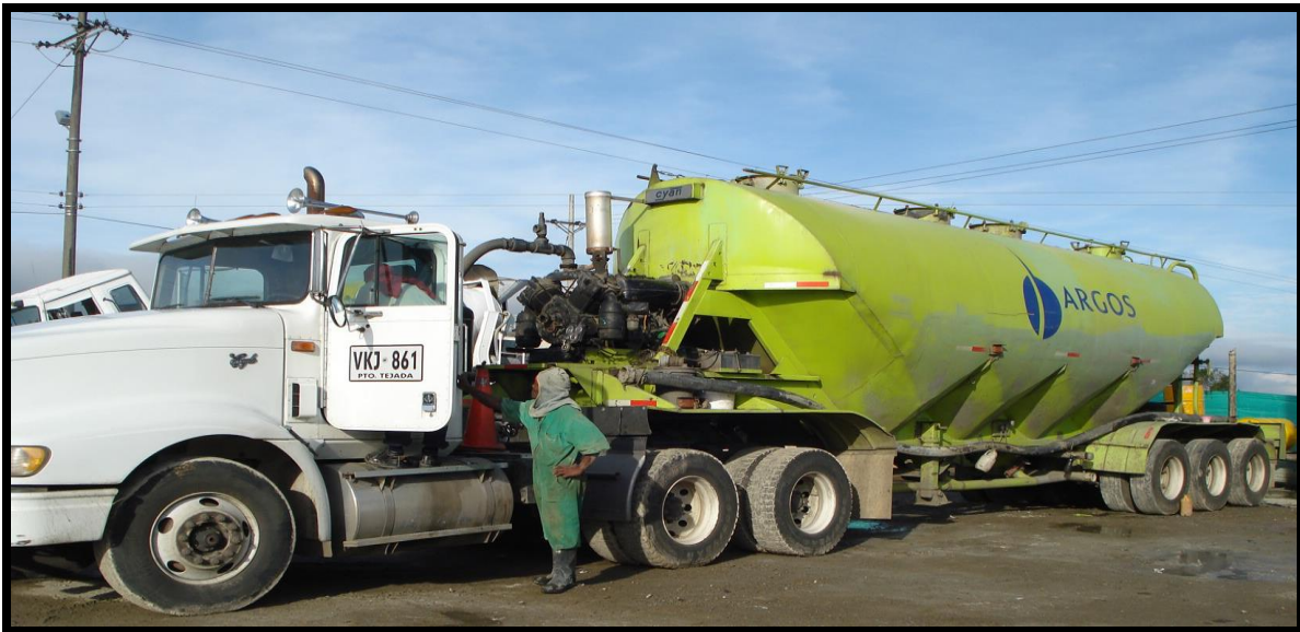
FOTO 4. CAMION TRANSPORTADOR DE CEMENTO

La planta cuenta con un dispositivo que permite dosificar la cantidad de cemento en peso que debe agregarse a cada camión para un volumen determinado. Con este mismo aparato se puede hacer el control para los agregados y el agua.