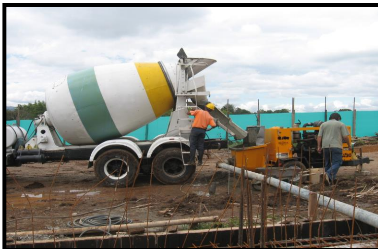
FOTO 32. DESCARGA DE CONCRETO CON BOMBA Y TUBERIA

Para poder empezar la descarga hay varias formas, la primera es directamente desde el mixer dejando caer el concreto por la canal del camión hasta el punto de colocación o sobre el piso siendo recogido y transportado en carretillas hasta su ubicación final. La segunda forma es por medio de la tubería con la bomba, se deja caer el concreto por la canal hasta la tolva de la bomba desde donde es impulsado a presión hasta el lugar asignado. Otra forma es la que se conoce como concreto tremie.