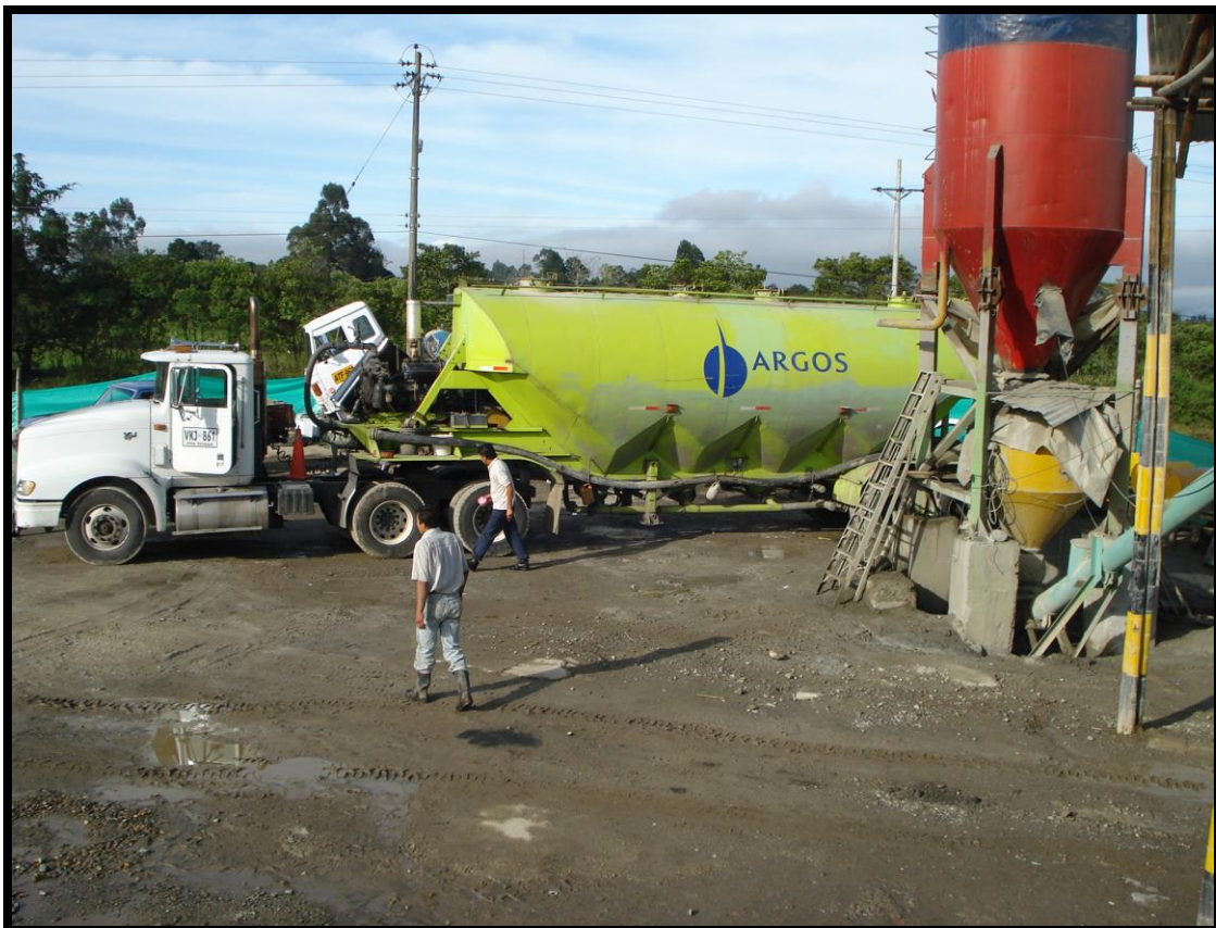
FOTO 9. PREPARACION PARA DESCARGA DE CEMENTO

Una vez se han hecho todos los controles, se procede a la descarga del material, se conecta una manguera desde el camión que trae el cemento hasta el silo, y luego este se llena a presión. El cemento almacenado dentro del silo se mantiene seguro y a salvo de la contaminación y el agua de lluvia.