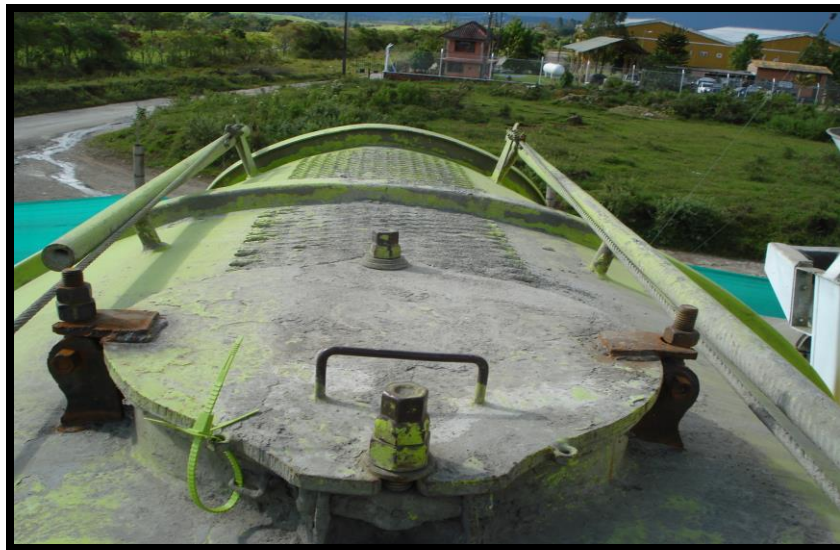
FOTO 10. SISTEMA DE SEGURIDAD DEL CAMION DE ARGOS