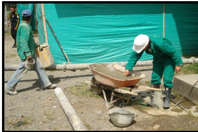
FOTO 28. ELABORACION DEL CONO PARA ENSAYO DE ASENTAMIENTO