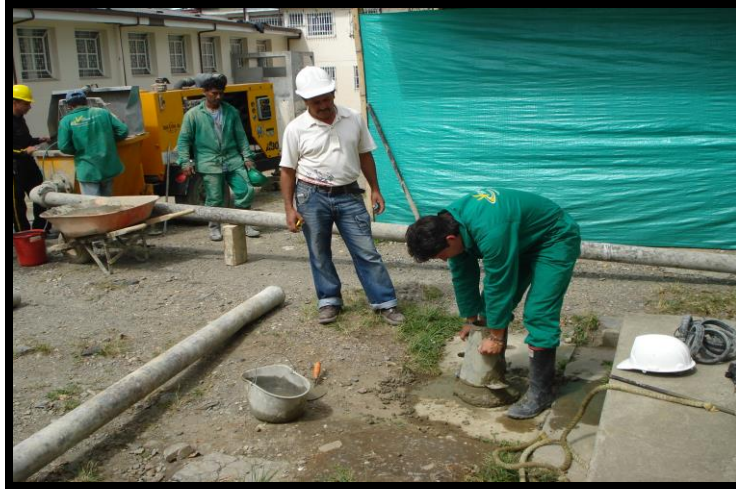
FOTO 30. LEVANTAMIENTO DEL CONO PARA PERMITIR EL ASENTAMIENTO