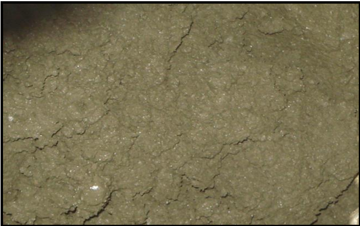
FOTO 3. DETALLE DE LA PASTA DE CONCRETO

La calidad de un concreto depende en gran medida de la calidad de la pasta y en un concreto elaborado adecuadamente, cada partícula y los espacios entre ellas deben estar cubiertos en su totalidad por la pasta.