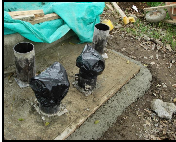
FOTO 62. CILINDROS CUBIERTOS CON PLASTICO

Se debe también proteger los cilindros con plásticos para evitar la pérdida de humedad.