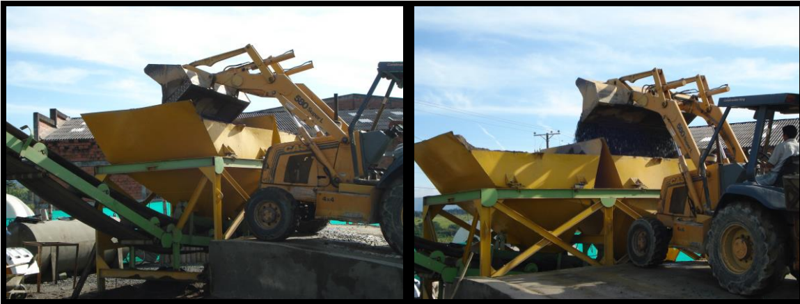
FOTO 16. RETROEXCAVADORA CARGANDO AGREGADOS

Con la retroexcavadora se toman los agregados desde su sitio de almacenamiento y son vaciados hasta llenar cada una de las tolvas.