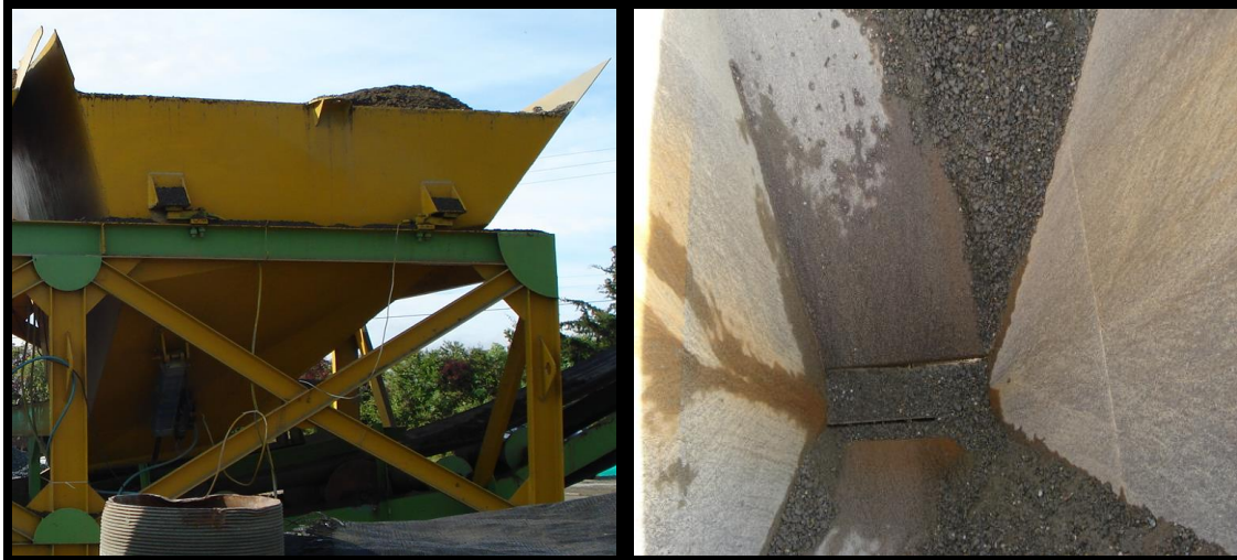
FOTO 5. BASCULA DONDE SE PESA EL AGREGADO