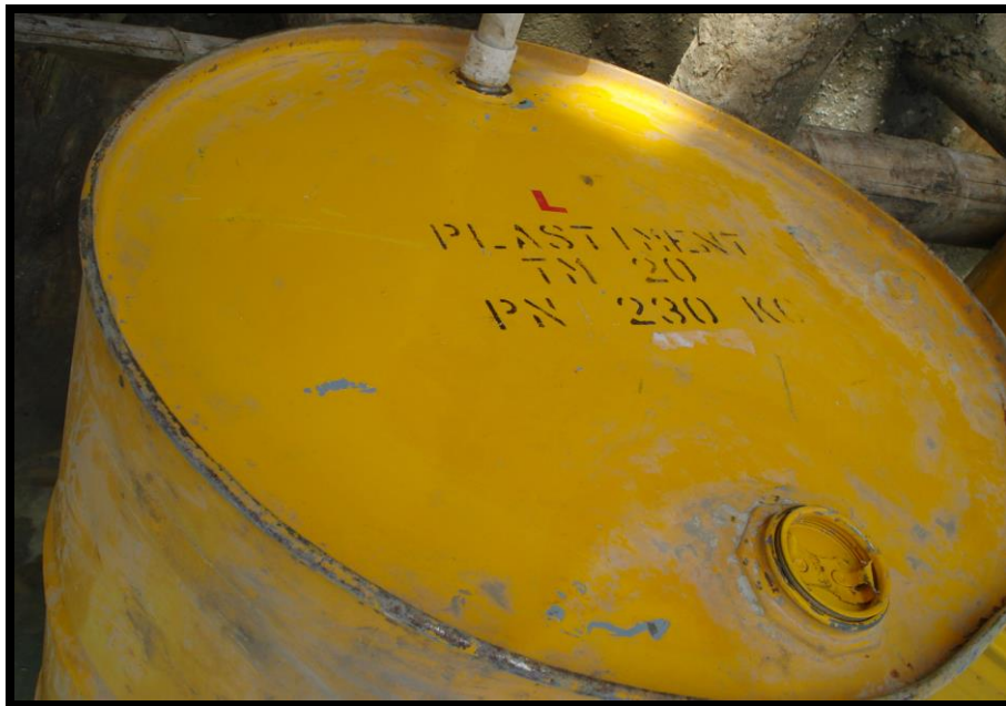
FOTO 12. DETALLE DEL ADITIVO CON SU NOMBRE

Al momento de hacerse necesario el uso de algún tipo de aditivo, cada barril se ha acondicionado con un tubo que permite la dosificación correcta de este material permitiendo su salida y evitando que se produzca algún tipo de desperdicio, lo cual resultaría demasiado desfavorable para la empresa debido al costo que posee cada uno de estos barriles, unos más costosos que otros dependiendo del tipo de aditivo.