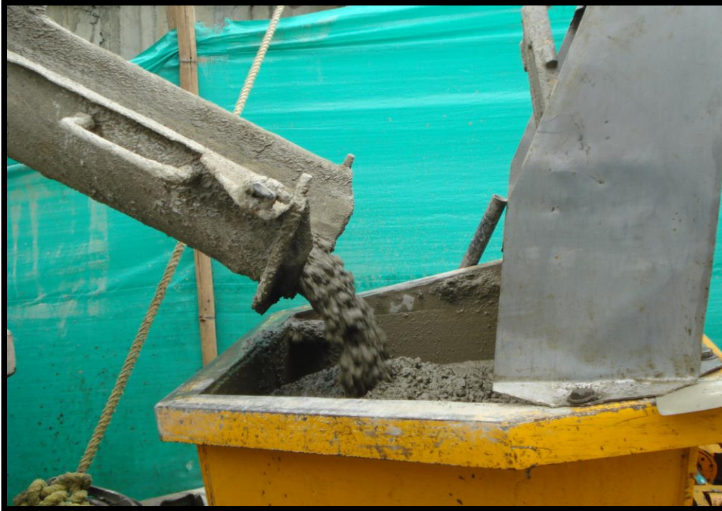
FOTO 46. DETALLE DESCARGA DE CONCRETO EN LA TOLVA

Como lo primero que se bombea es el agua con la purga, se deja que esta salga primero y se trata de evacuar procurando que no entre en contacto con el elemento que se va a fundir. Por otro lado “el moco”, es lavado tambien por dentro con esta misma purga pero aún sin acoplarse a la tubería, ya que no es aconsejable hacerlo por experiencia propia.