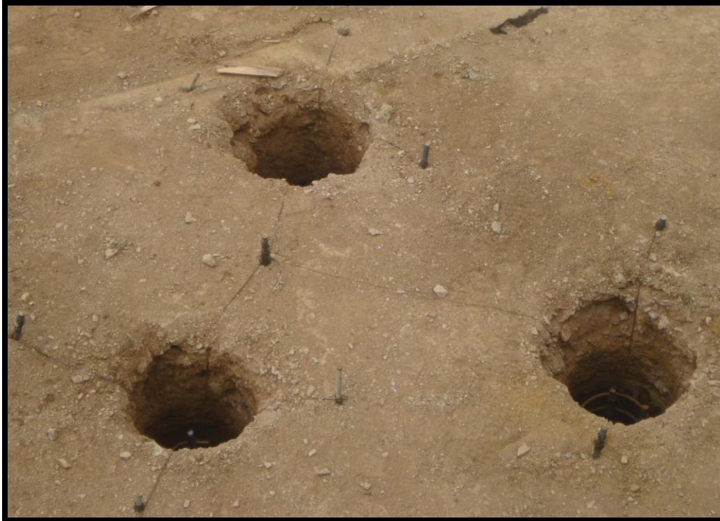
FOTO 51. GRUPO DE PILOTES LISTOS PARA VACIADO DE CONCRETO

Antes de comenzar con la descarga se realiza la prueba de asentamiento, luego se agrega el aditivo, se mezcla durante algunos minutos, y se comienza con el trabajo.