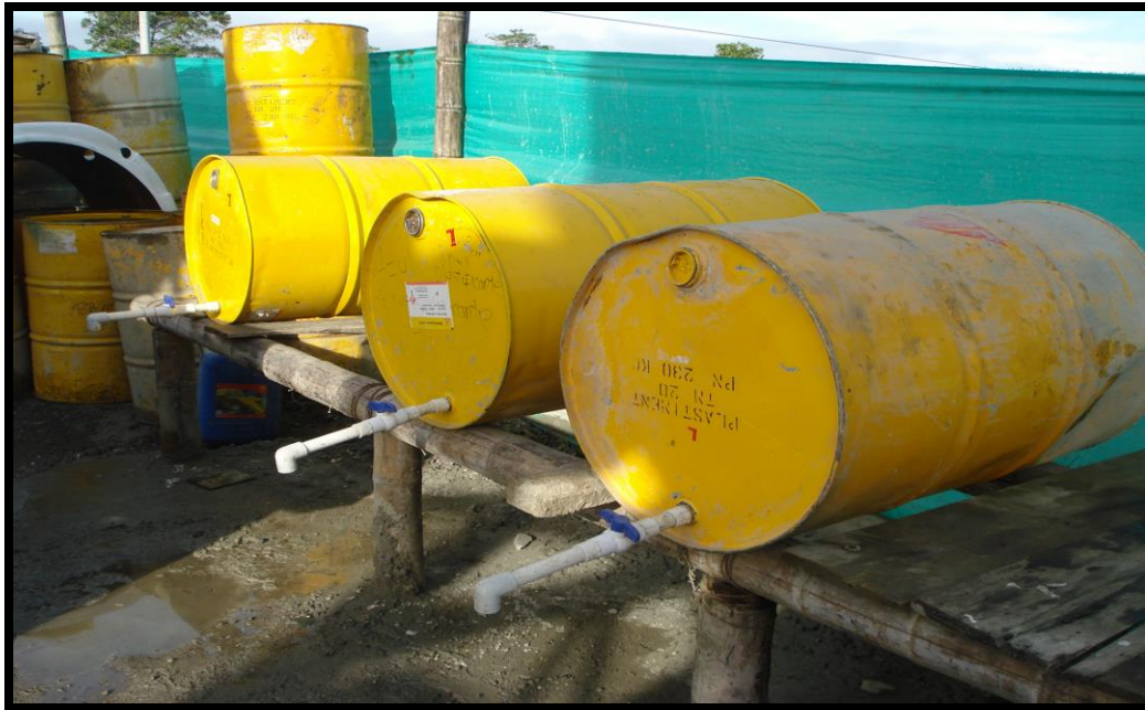
FOTO 8. DETALLE DE ADITIVOS DE SIKA