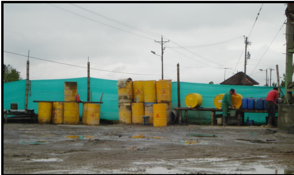
FOTO 11. ALMACENAMIENTO DE ADITIVOS

Los aditivos se almacenan en el interior del lote y se protegen debidamente de la contaminación y la intemperie dentro de los barriles donde son enviados desde la fábrica de producción.