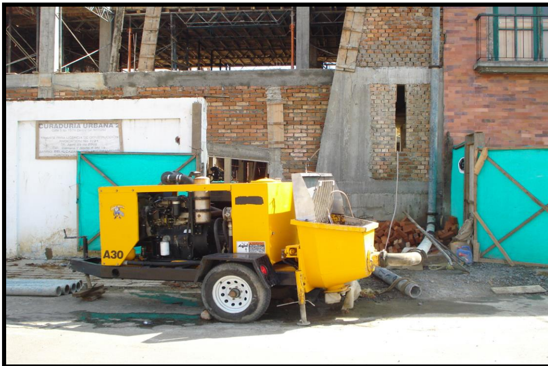
FOTO 2. BOMBA ESTACIONARIA Y TUBERIA ARMADA

Su uso resulta ser muy útil en algunos lugares y zonas donde el acceso es limitado o restringido por no disponer espacio suficiente para almacenar materiales o equipos, evitando el uso de carretillas, grúas, elevadores etc.