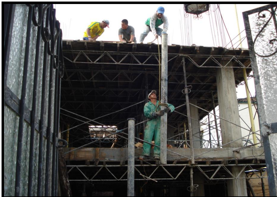
FOTO 36. SUBIENDO TUBERIA CON SOGAS

Al momento de armar la tubería hay que estar pendiente que los operarios no la tendieran por lugares en donde podrían presentarse obstáculos, o que el golpeteo producido por la presión que se ejerce dentro de los tubos pudiese dañar parte de la estructura, ya que en ocasiones se sujetaba la tubería mediante sogas a algunas partes de la estructura como por ejemplo vigas o columnas, ni que tampoco ocasionara daño alguno a cualquier elemento que se encontrara en su camino.