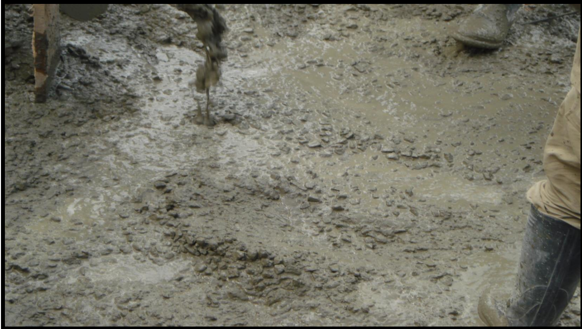
FOTO 1. IMAGEN DE CONCRETO COLOCADO SOBRE UNA LOSA