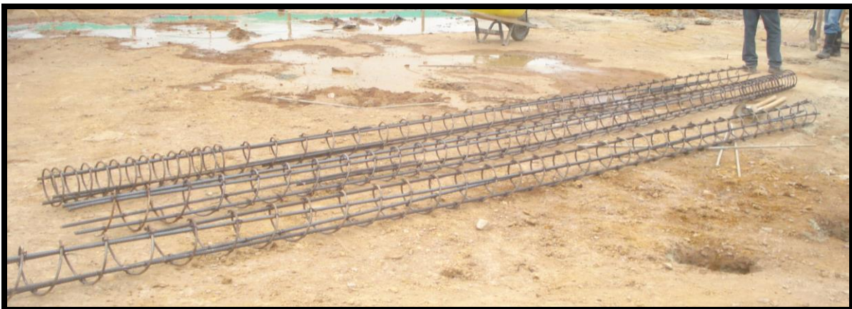
FOTO 49. DETALLE DEL REFUERZO

Con el pilote excavado el paso a seguir es introducir el refuerzo dentro de el.