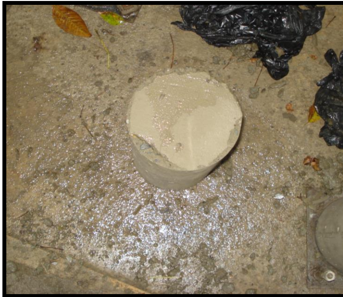
FOTO 59. CILINDRO ASTILLADO LUEGO DE DESENCOFRAR

Otro aspecto a tener en cuenta es el estado de las camisas usadas en la elaboración de los cilindros, ya que si no están en buenas condiciones se pueden presentar problemas al momento de desencofrar las muestras.