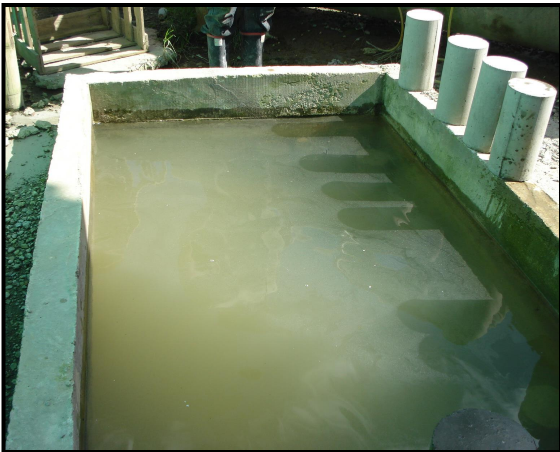
FOTO 60. PISCINA PARA CURADO DE CILINDROS

Luego los cilindros son pasados a una piscina llena de agua con cal, procurando que siempre haya agua libre sobre todas las superficies de los cilindros a una temperatura de 23\pm 2^{\circ}\text{C} hasta el día que sean llevados al laboratorio para ser ensayados.