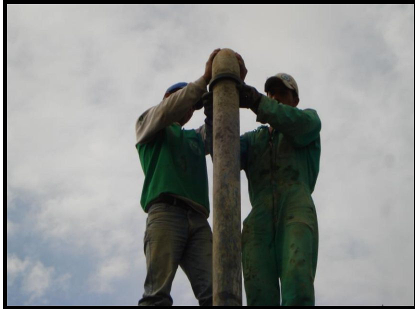
FOTO 37. OPERARIOS ARMANDO LA TUBERIA

Como algunas veces el tendido de la tubería se veía dificultoso, el trabajo del pasante en esta parte consistía en ir a la obra uno o algunos días antes de la fundición para poder establecer el grado de dificultad al armar la tubería, y determinar si se podía montar el mismo día o se presentaba la necesidad de realizar el trabajo el día anterior.