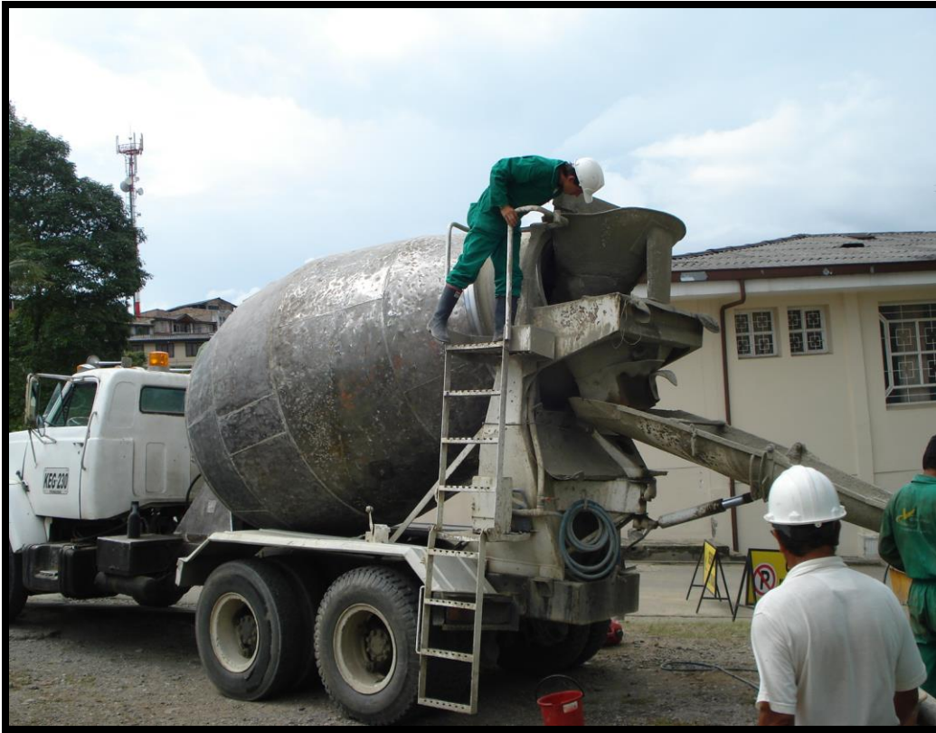
FOTO 41. REVISION DE CONSISTENCIA DE LA MEZCLA CON EL ADITIVO