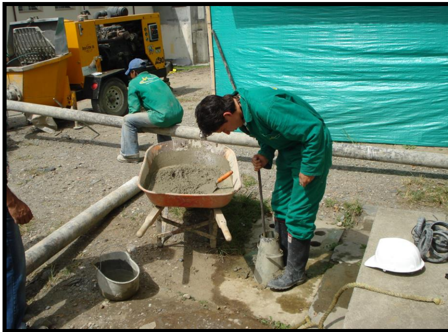
FOTO 29. APISONADO DE LAS CAPAS DEL CONO