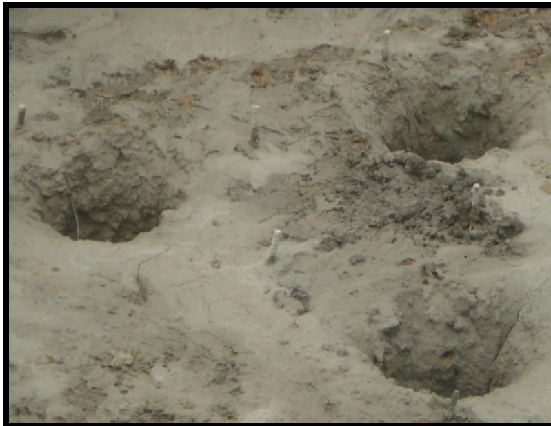
FOTO 55. PILOTES FUNDIDOS

Cuando se terminaba de llenar el primer grupo de pilotes se procedía a situar el mixer en otro grupo y se repetía el proceso.