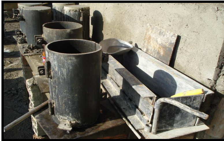
FOTO 22. MOLDES PARA ELABORAR CILINDROS Y VIGUETAS

tampoco de alguna manera en la que puedan sufrir algún daño por contacto entre ellas mismas.