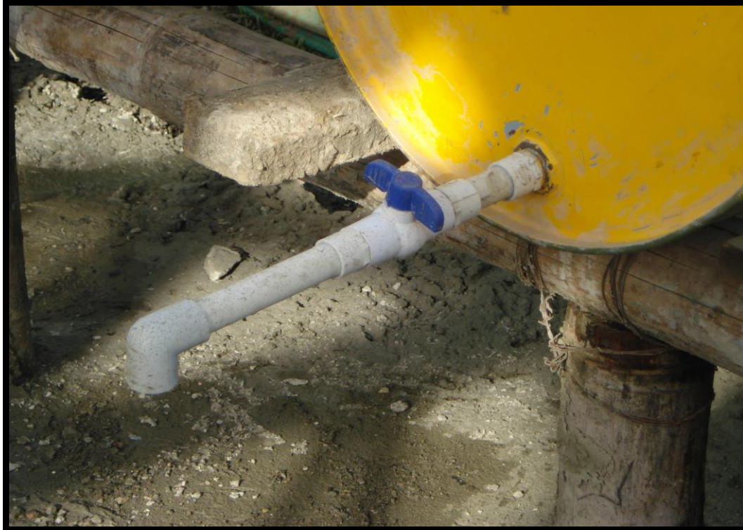
FOTO 13. SISTEMA DE DOSIFICACION DE ADITIVOS