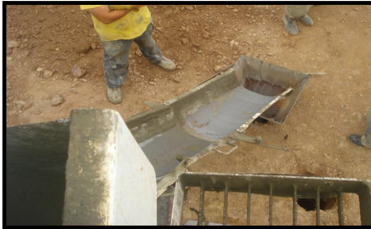
FOTO 53. EQUIPO DISPUESTO PARA COLOCACION DE CONCRETO