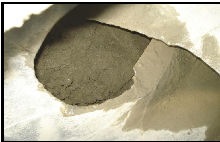
FOTO 42. DETALLE CONCRETO DENTRO DE MEZCLADORA