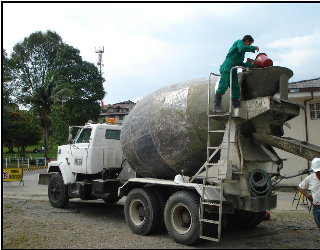
FOTO 40. APLICACIÓN DE ADITIVO A LA MEZCLA ANTES DE LA DESCARGA

Después de agregarle el aditivo al concreto, se deja mezclar por algunos minutos revisando constantemente el estado de la mezcla, tiempo durante el cual se debe realizar otra actividad que consiste en purgar la tubería.