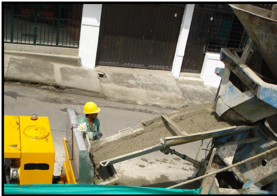
FOTO 45. DESCARGA DE CONCRETO EN LA TOLVA

Primero se bombea la purga y se espera un momento hasta que quede un poco de esta dentro de la tolva sin permitir que se acabe, en ese momento se agrega el concreto en la tolva evitando que se derrame.