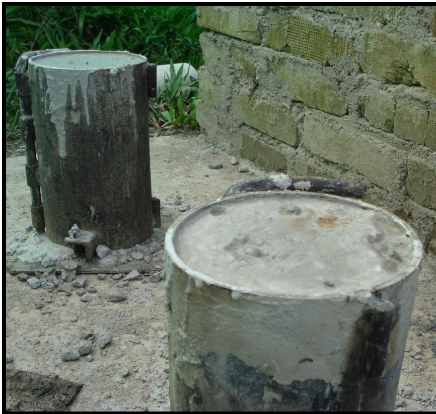
FOTO 61. CILINDROS MAL ELABORADOS

Se debe garantizar también que una vez los cilindros hayan fraguado dentro de los moldes, no se produzca pérdida de volumen, y que además sus bases sean lo suficientemente planas para que se puedan obtener resultados confiables sin necesidad de realizar el refrentado.