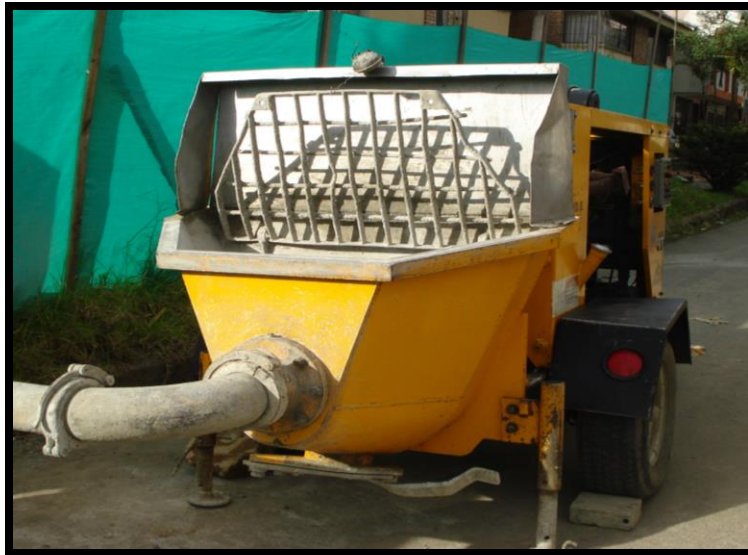
FOTO 38. DETALLE TOLVA BOMBA ESTACIONARIA