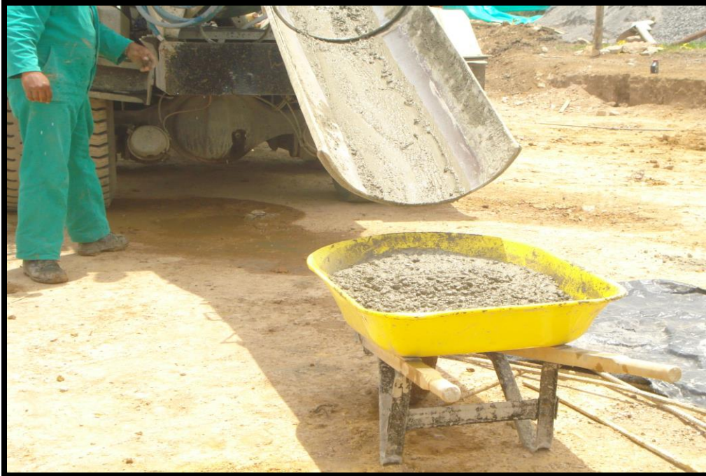
FOTO 25. TOMA DE MUESTRA EN CARRETILLA