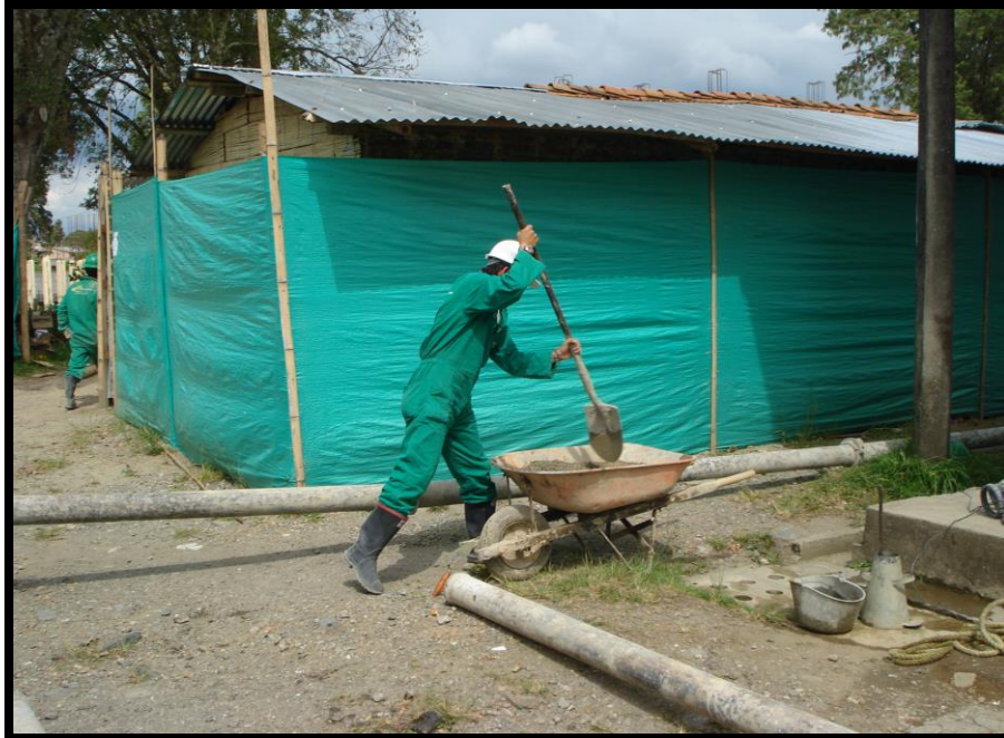
FOTO 26. MEZCLADO DE LA MUESTRA EN LA CARRETILLA CON PALA