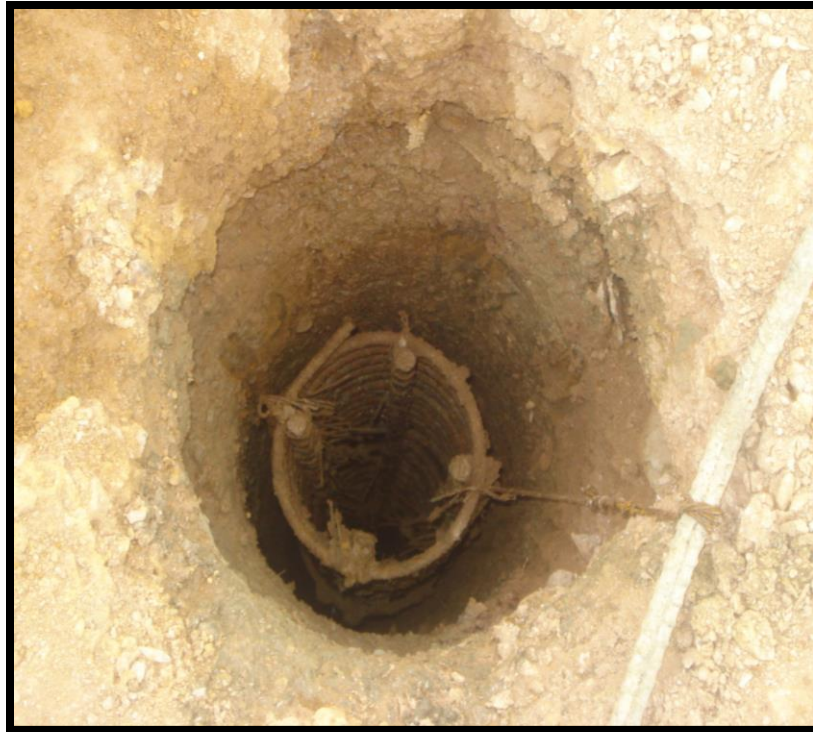
FOTO 50. PILOTE CON EL REFUERZO DENTRO

Cuando ya se tiene un grupo de pilotes listos para ser llenados (en este caso tres), se continua con el proceso.