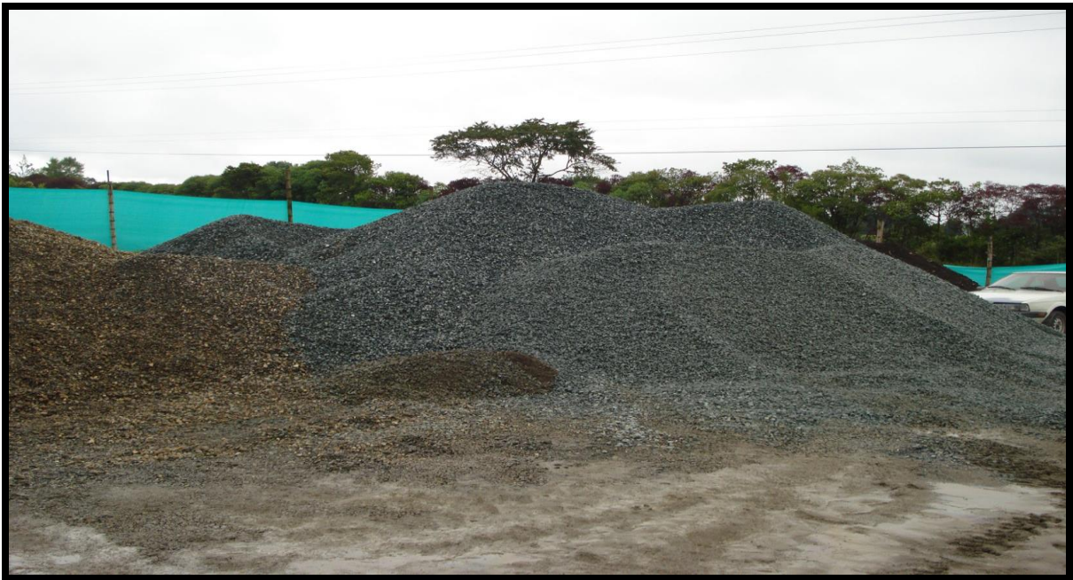
FOTO 7. AGREGADO GRUESO