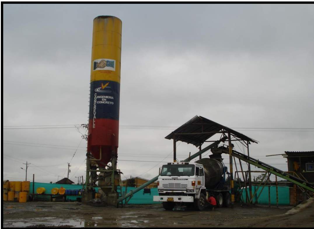
FOTO 21. SILO DE ALMACENAMIENTO DE CEMENTO Y VEHICULO CARGANDO

Siempre hay un operario encargado de revisar la banda transportadora durante la carga de cada mixer, con el fin de verificar que no pasen elementos extraños que puedan perjudicar la mezcla.