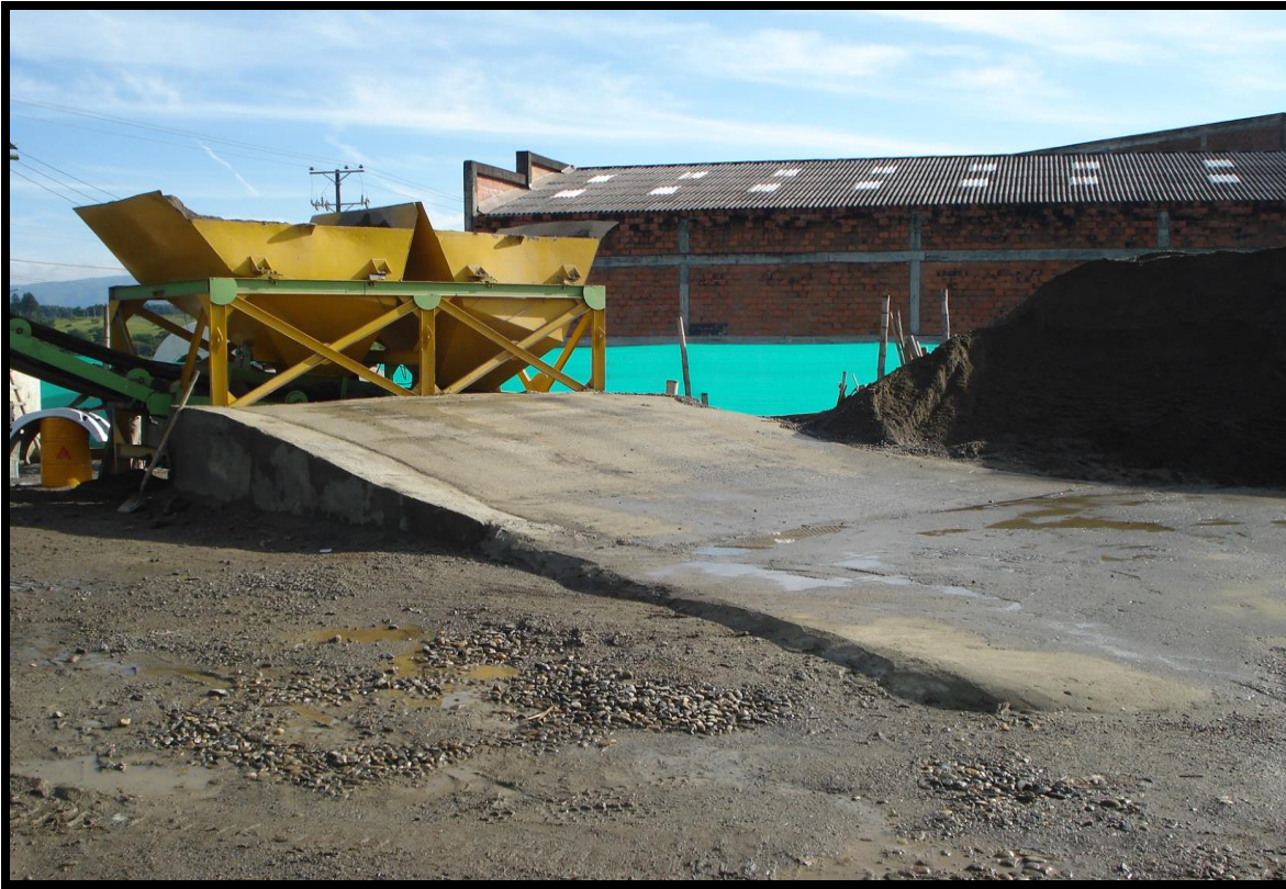
FOTO 14. TOLVAS PARA DOSIFICACION DE AGREGADOS