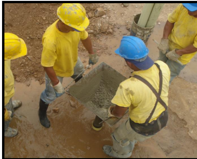
FOTO 54. CONCRETO BAJANDO POR LA TUBERIA

Para realizar el proceso de vaciado de los pilotes, se escoge un grupo de estos que ya esté listo y se comienza el llenado.