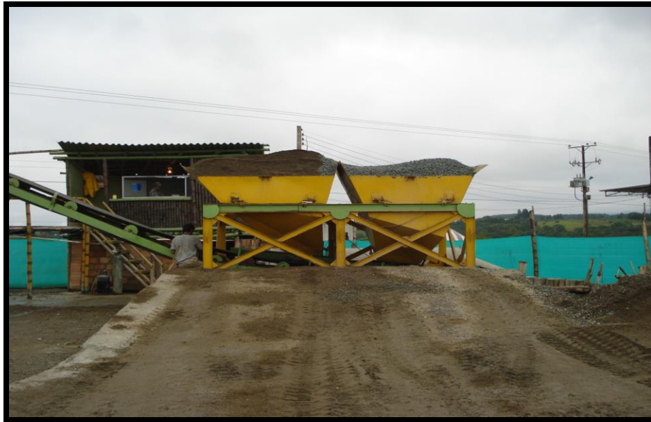
FOTO 17. TOLVAS LLENAS CON AGREGADOS

El cemento dentro del silo se deja caer en la tolva que está situada debajo de él y que dispone de una báscula similar a la de los agregados, y un operario se encarga de dosificar la cantidad correcta moviendo una palanca que abre y cierra una compuerta ubicada en el fondo del silo.