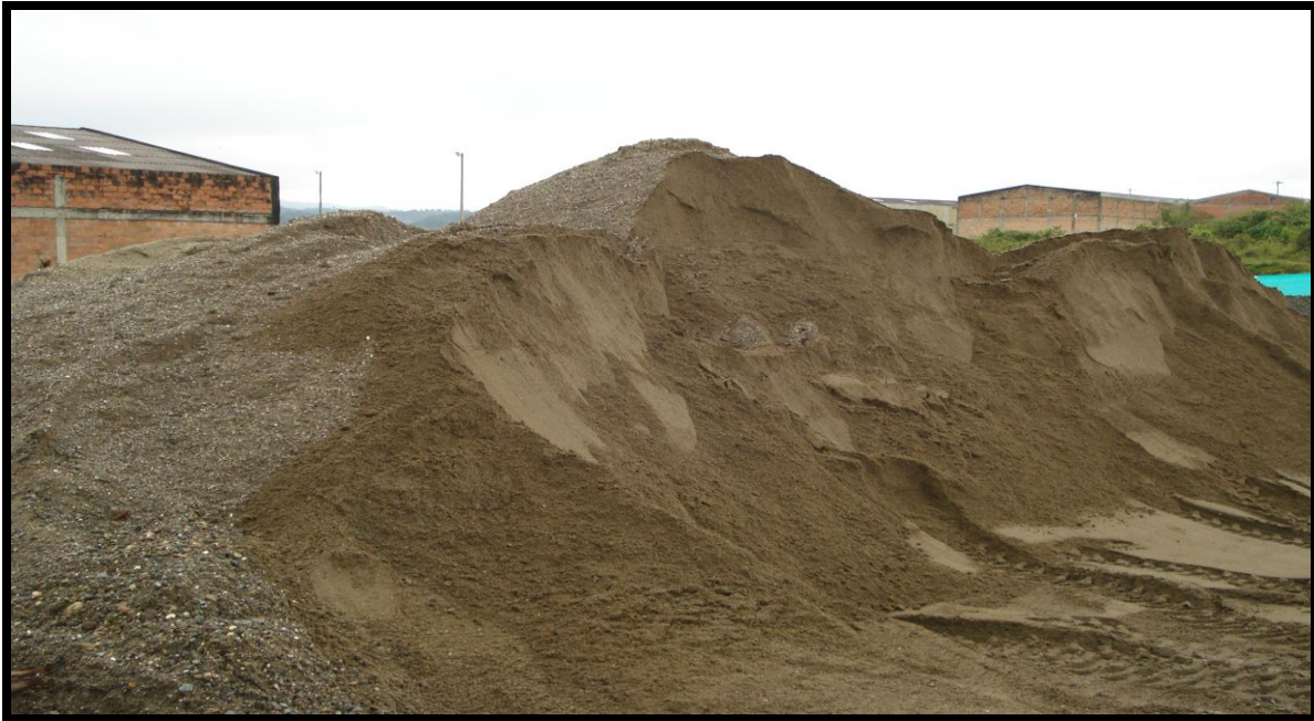
FOTO 6. AGREGADO FINO

En algunas ocasiones se utilizó materiales diferentes a los cuales se les hizo las pruebas de laboratorio respectivas para verificar su calidad.