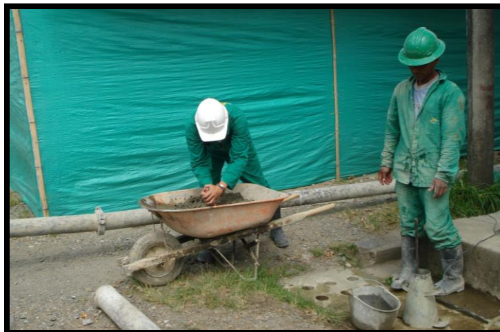
FOTO 27. MEZCLADO DE LA MUESTRA EN LA CARRETILLA CON ESPÁTULA