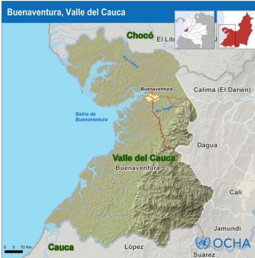
Figura 1. Mapa de Buenaventura.