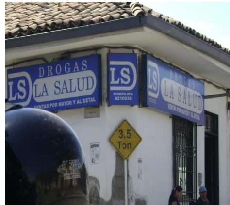
Carrera 11ª con calle 5ª esquina.