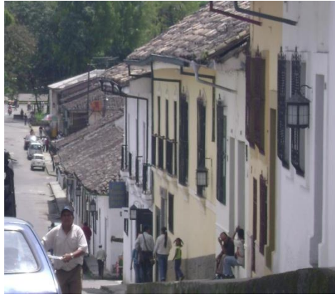
Carrera 5ª. Mayo 2008. .