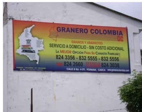
Carrera 7ª Mayo 2009.