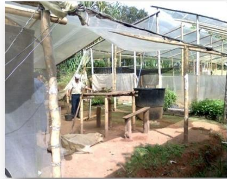
Vivero Vereda Las Huacas.