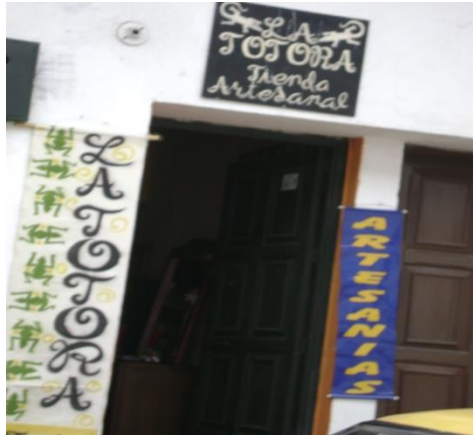
. Carrera 5ª.