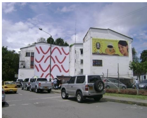
Carrera 7ª. Mayo 2008. .