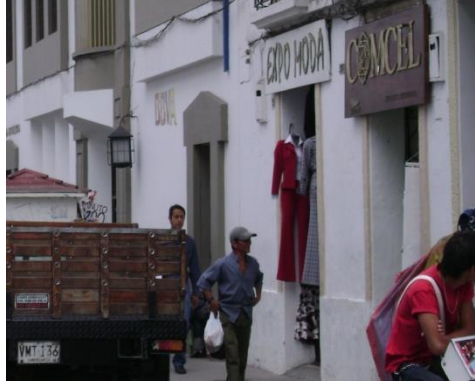
Carrera 7ª. Mayo 2008.