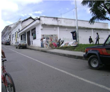
Carrera 7ª. Mayo 2008