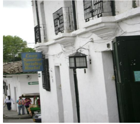
Carrera 5ª Mayo 2009.