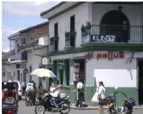
.Carrera 7ª con calle 8ª Mayo 2008