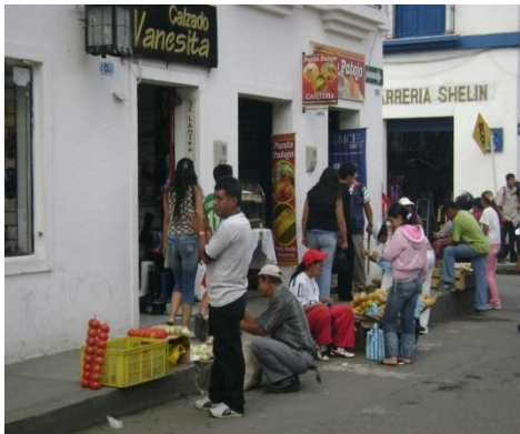
. Carrera 5ª. Mayo 2008.

En algunas zonas del Centro histórico la problemática permanece igual y en otras, es notable el aumento en el número de avisos publicitarios que no cumplen con la normatividad.