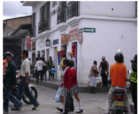
. Carrera 5ª Mayo 2009