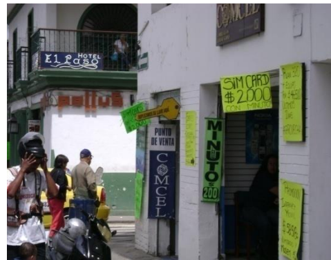
Carrera 7ª con calle 8ª Mayo 2009