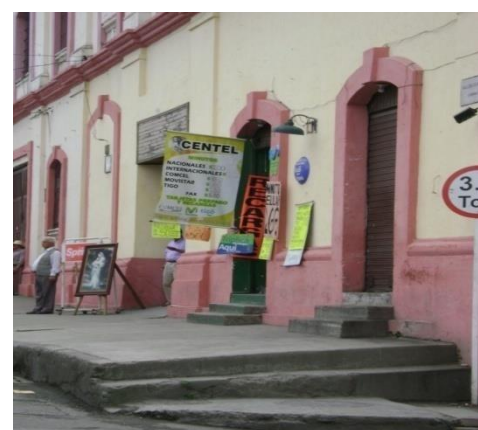
Carrera 3ª Mayo 2009.