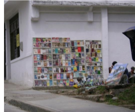
Carrera 7ª Mayo 2009.