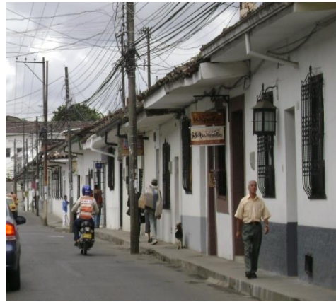
Bario Caldas por la carrera 2ª