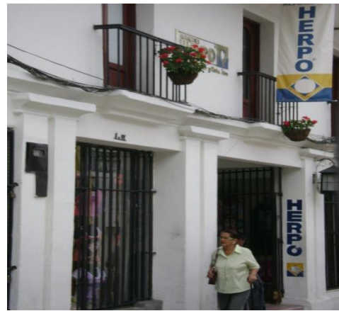
Carrera 7ª Mayo 2009.