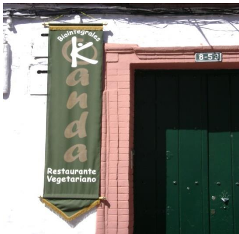
. Calle 5ª