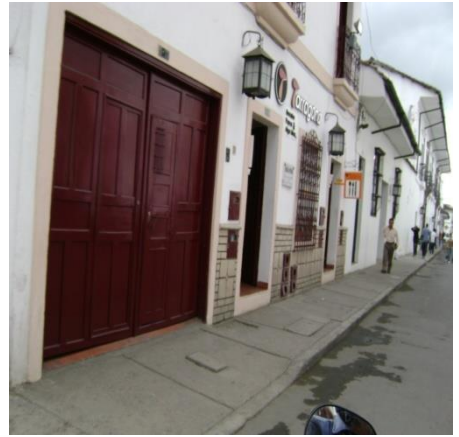
. Calle 4ª.

En algunas zonas del Centro histórico la problemática permanece igual y en otras, es notable el aumento en el número de avisos publicitarios que no cumplen con la normatividad.