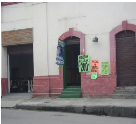
Carrera 3ª. Mayo 2008. .