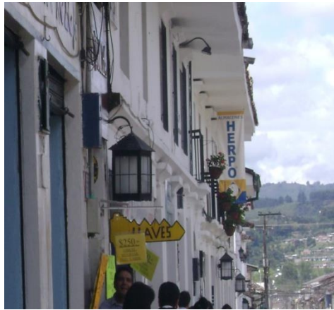
. Carrera 7ª. Mayo 2008.