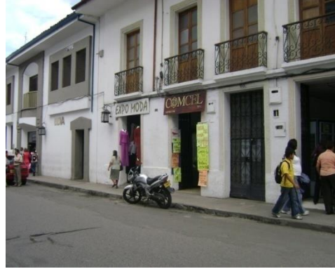
Carrera 7ª Mayo 2009.