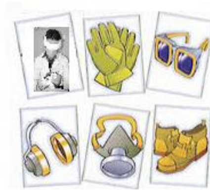
(Algunas medidas de protección personal)

La gestión integral de este tipo de residuos inicia con la minimización, verificando en qué procedimientos se están produciendo y concertando medidas para que su producción sea la menor posible.