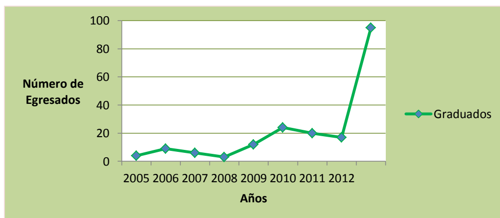
Gráfico 3. Número de Graduados del Programa de Economía de la Universidad del Cauca 2005 - 2012.

Fuente: Oficina de Egresados de la Universidad del Cauca.