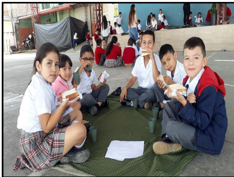
Anexo 8: Picnic literario.