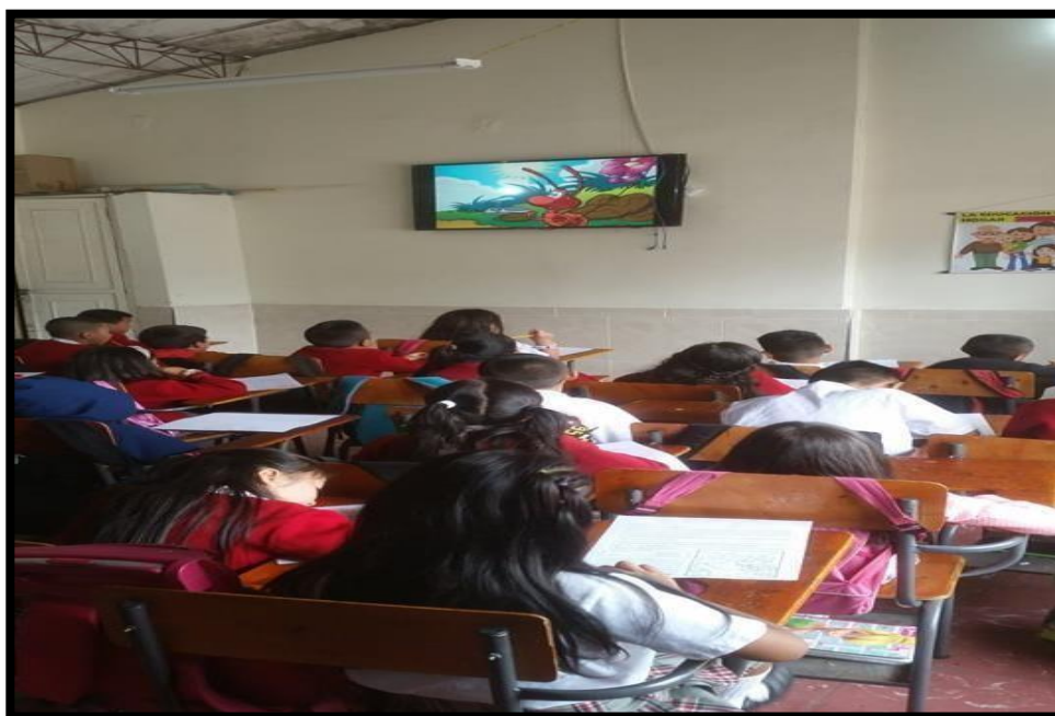
Anexo 6: Observando el video animado del cuento “La hormiga y la cigarra”.