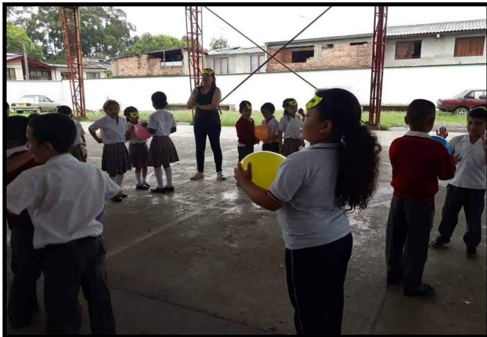
Anexo 1: Conociendo a los estudiantes por medio de una actividad lúdica.