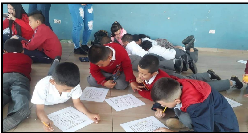
Anexo 10: Trabajo individual, yincana (sopa de letras).