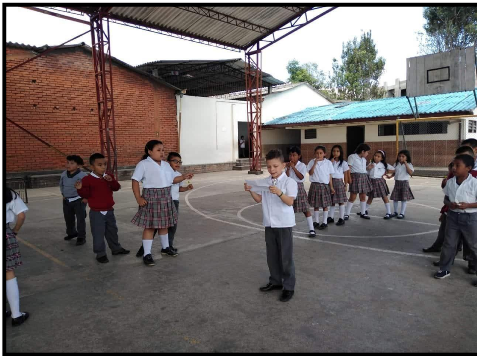
Anexo 3: Identificar los signos de puntuación mediante un juego.