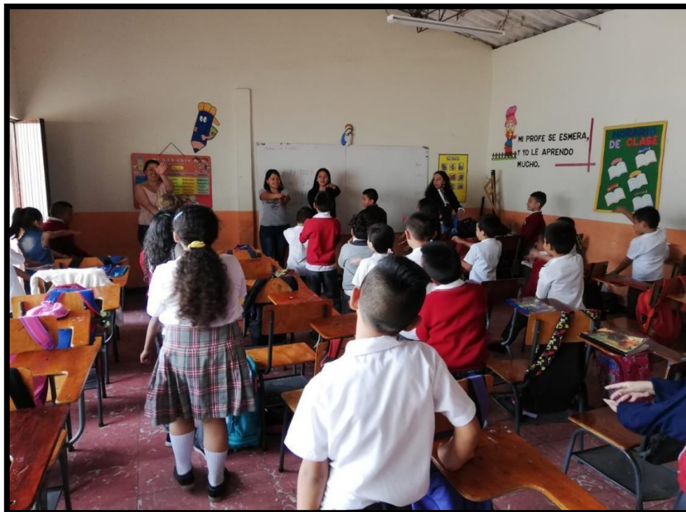
Anexo 11: Actividad inicial de la clase, cantando la canción “El cocodrilo Dante”.