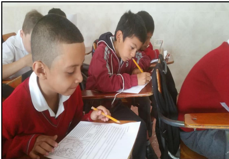
Anexo 7: Lectura del cuento “La hormiga y la cigarra”.