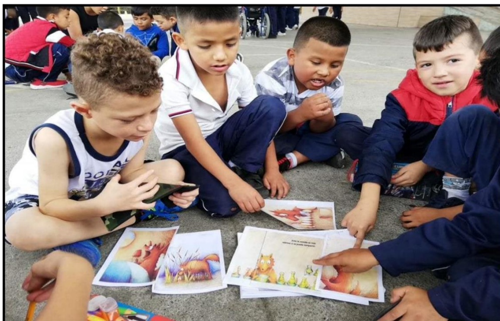
Anexo 4: Actividades de pre-lectura del cuento “¡Vaya apetito tiene el zorrillo!”