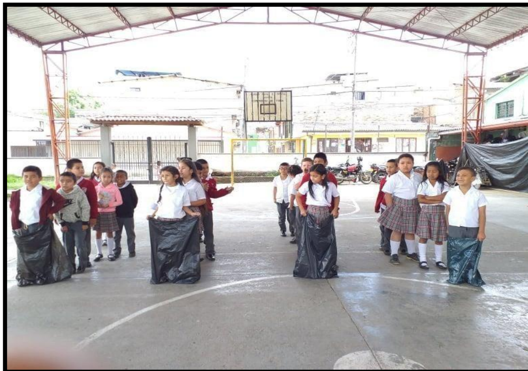
Anexo 9: Trabajo en equipo, yincana (carrera de sacos).