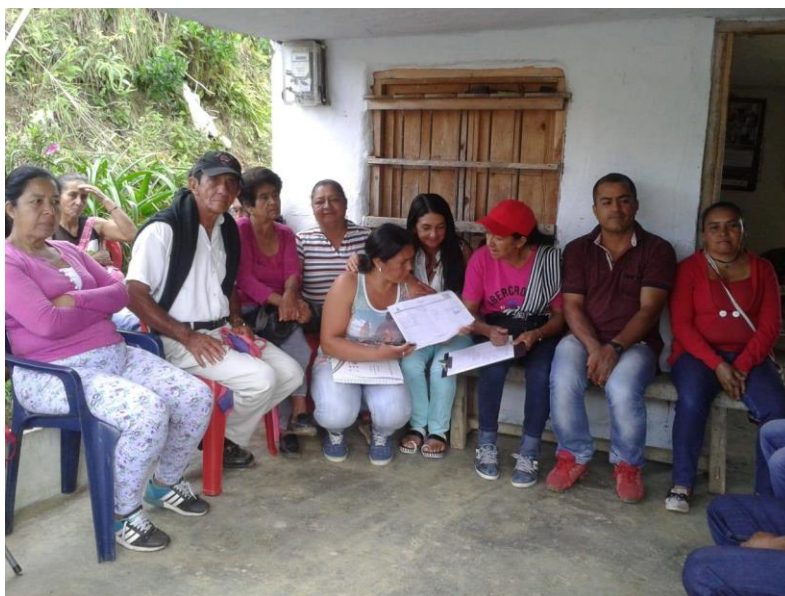
Figura 9- Jornadas de trabajo de la Asociación AMACA