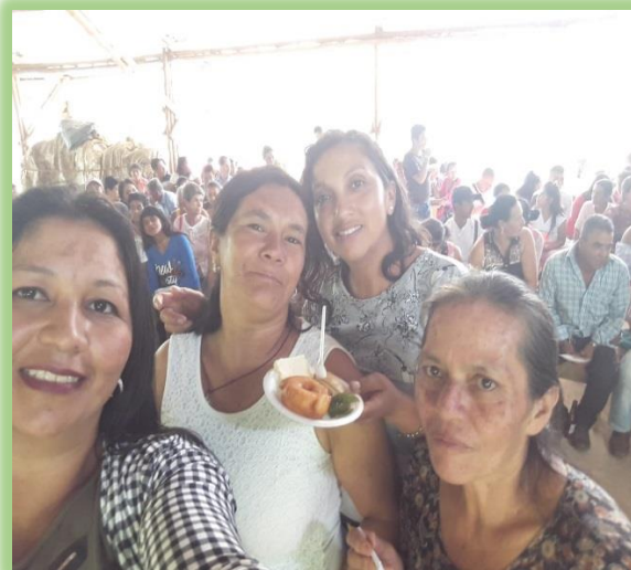
Figura3- Asamblea general de la Asociación de Mujeres Productoras Agricultoras del Departamento del Cauca AMACA