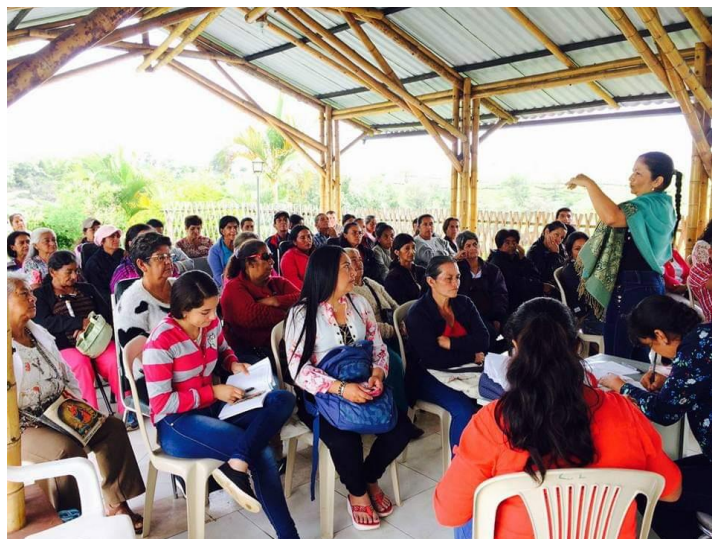
Figura 12- Asamblea de Mujeres AMACA, talleres de planeación