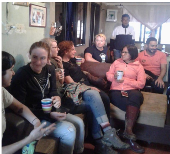
Figura 5- Trabajo comunitario y capacitación para el diseño de estrategias productivas

de derechos humanos a los que se exponen en un contexto donde siempre se ha disputado el poder.