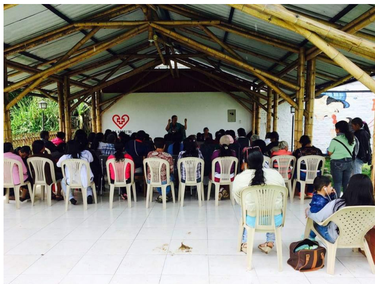
Figura 8- Asamblea de mujeres AMACA,

de la comunidad, hijos y demás actores sociales han venido trabajando colectivamente en la generación de mecanismos apropiados para potenciar la producción del café.