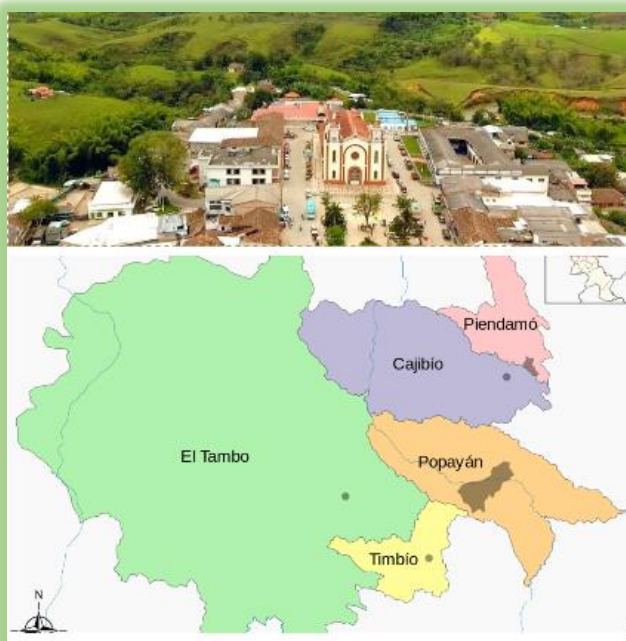
Figura 1- Mapa geográfico del Municipio de El Tambo Cauca