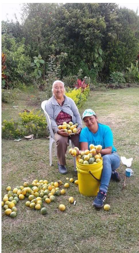
Figura 10- Mujeres productoras agricultoras en cosecha de Maracuyá