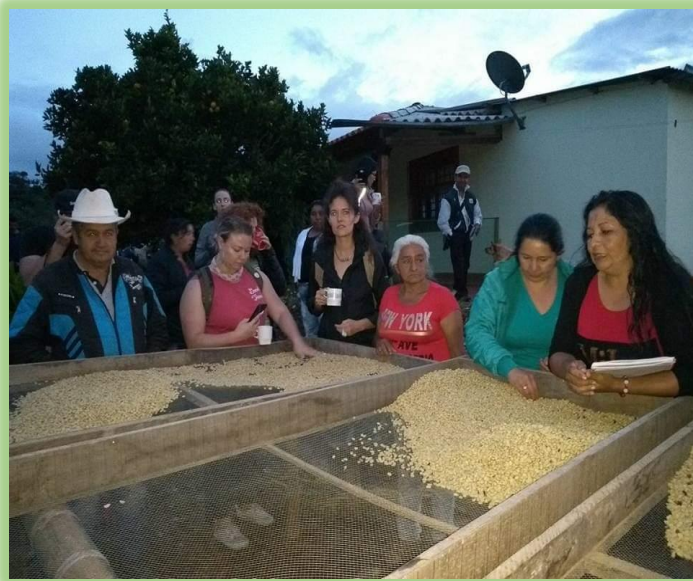
Figura 4- Trabajo Caficultor AMACA