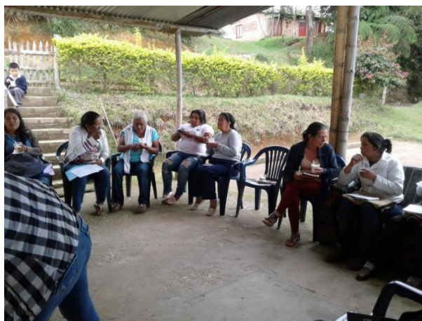
Figura 11- Planificación de trabajo, Mujeres AMACA