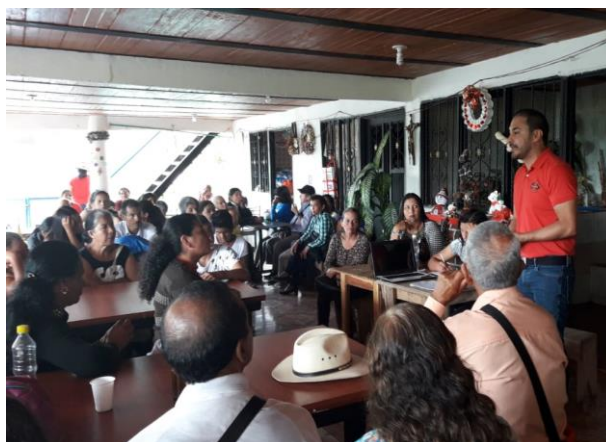
Figura 14- Capacitación de procesos productivos de la Asociación AMACA