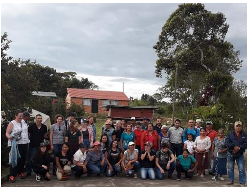
Figura 7- encuentro de mujeres campesinas y asociados