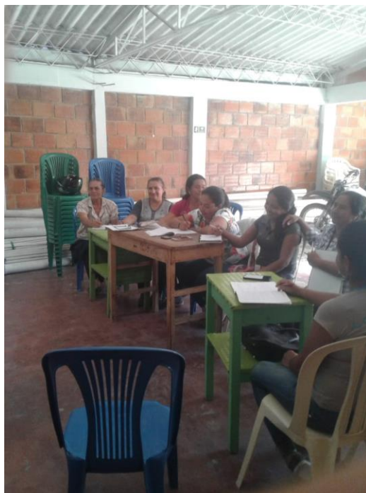
Figura 13 Taller de memoria histórica