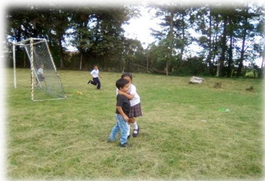
Imagen 5. Tercera actividad “Teléfono roto”