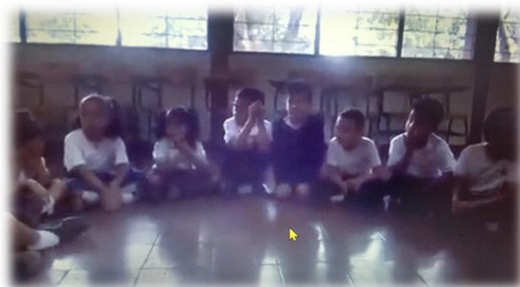
Imagen 13. Juntos construimos una historia

Esto sucedió, precisamente porque el juego teatral se volvió importante para los y las estudiantes generando la confianza y el acercamiento entre compañeros. Por ejemplo, cuando debían contar historia de manera grupal, ellos y ellas se motivaron mucho, mostrándose emocionados y atentos para continuar la historia que hacían sus compañeros. De esta manera se vincularon todos los y las estudiantes, abriendo espacio a la interacción entre pares de diferente género, así permitió que todos participaran y generan confianza entre todos.