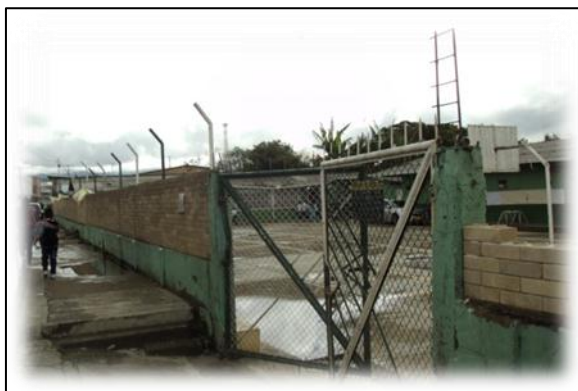
Imagen 1. Colegio Gabriela Mistral Sede el Uvo.