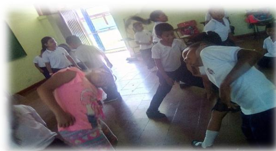
Imagen 3. Primera actividad “El espejo”

Las actividades que se diseñaron en el plan de acción se ejecutaron de manera presencial en el 2019 y otras de manera asincrónica en el 2021. Las actividades que se desarrollaron de manera presencial fueron: el espejo, completa la historia, teléfono roto, ojos vendados y el robot. Las actividades que se desarrollaron de manera asincrónica, es decir por envíos mediante WhatsApp, dado las condiciones de pandemia, fueron las siguientes: el juego teatral, taller de género, la interacción, la máscara y la obra teatral.