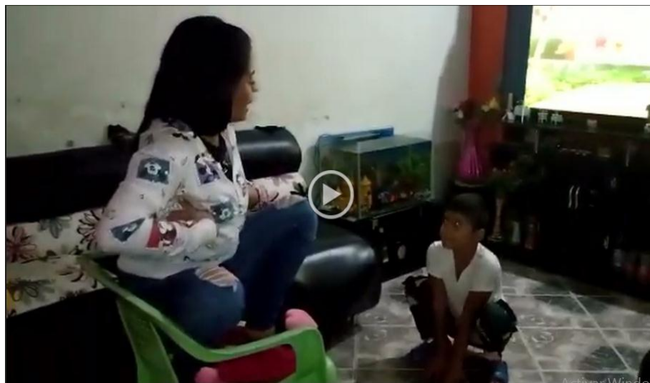
Imagen 18. Representación de la rana y la gallina

desde el juego teatral. Esto sucedió porque los familiares siempre estuvieron con los estudiantes, brindando un mejor comportamiento.