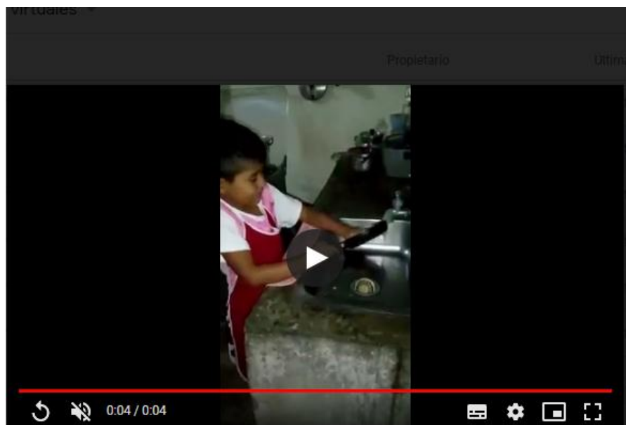
Imagen 17. Video de trabajo durante la pandemia

Así se comprende lo planteado por Meneses y Monge (2001), cuando afirman que “el juego es una actividad lúdica donde los niños representan una imitación significativa a las actividades de los adultos, donde representa el contacto con ellas a si mismo que el niño y el juego se relacionan con las habilidades y destrezas, por lo cual esto genera la creatividad natural, además eso genera de la vida cotidiana y de uno mismo”. Pág. 24