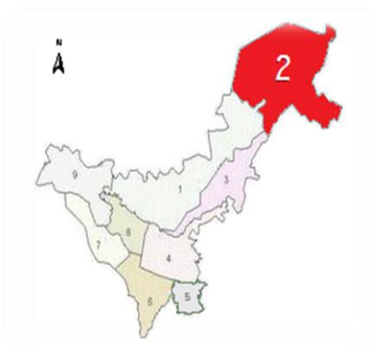
Imagen 2. Mapa de la comuna 2 I.E" Uvo"

La Institución Educativa Gabriela Mistral, sede “El Uvo”, está ubicada al norte de la ciudad de Popayán, capital del departamento del Cauca, en la carrera 17 # 64N 36. Esta institución pertenece a la comuna dos, la cual tiene el mayor número de barrios y personas de la ciudad (el 21% y 17% respectivamente); se puede decir que en esta comuna existen viviendas de todos los estratos, pero priman el 2 y 3 con el 80% y solo el 6% son estratos 5 y 6. DANE (2005)