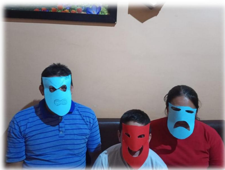
Imagen 11. Novena actividad sobre la máscara