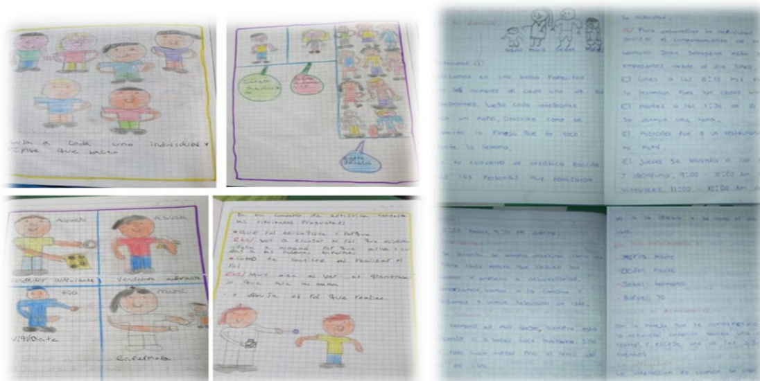
Imagen 9. Séptima actividad - taller de género