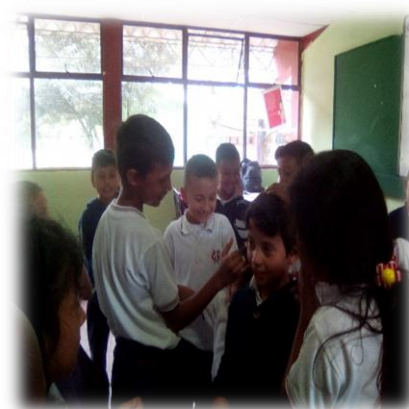
Imagen 15. Representación de una robot

De esta manera, se encontró que los y las estudiantes no se relacionaban con el género opuesto en un principio, llegando hasta agresiones físicas y verbales. Pero las prácticas pedagógicas desde el juego teatral permitieron que los y las estudiantes mejoran las relaciones de interacción, y por medio de los juegos que se realizaron en cada clase, los y las estudiantes se fueron acercando más a sus pares de género opuesto para realizar cada actividad planteada, por lo cual se generó una buena comunicación