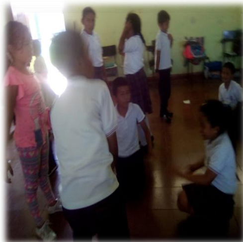
Imagen 16. Imitación de la pareja

Esta interacción entre pares, motivó a los y las estudiantes donde, por ejemplo, según la entrevista que se obtuvo con uno de los estudiantes, él comenta que le gusto el juego de los roles, que consistía en formar parejas y realizar acciones particulares del otro, así como valorar como se dio esa representación. Así, el juego teatral que debían hacer se fundamentaba en la imitación y por ejemplo, algunos hombres realizaron el rol de ama de casa, incluso hubo un caso que envió un video donde imitaba a la mamá lavando loza, utilizando su respectivo delantal, pero rescataba el orgullo que sentía al ver como cada día, realiza este oficio de la mejor manera. Así hay otros casos, por ejemplo un niño que representó a su mamá de enfermera y una niña que representó a su padre militar.