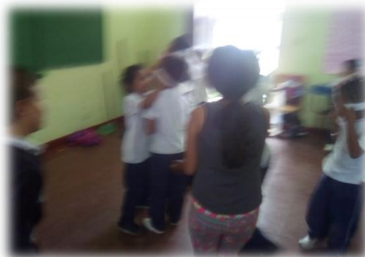
Imagen 6. Cuarta actividad “Ojos vendados”