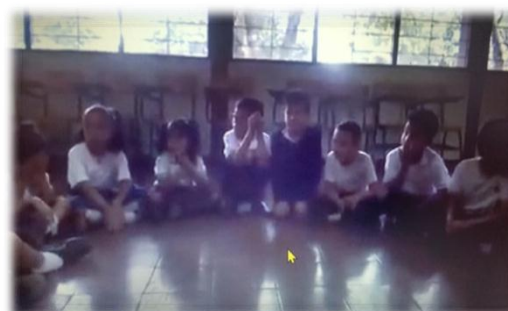
Imagen 4. Segunda actividad “Completa historias”