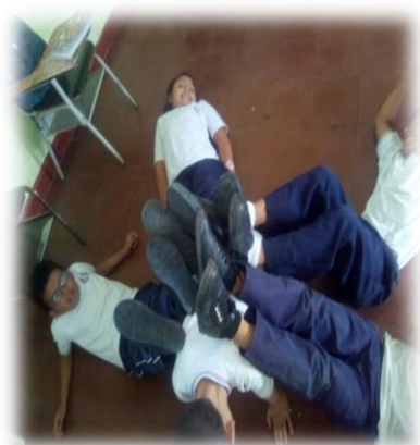
Imagen 14. Representación de un robot de manera grupal

Otra actividad como es la denominada “El robot”, cuyo propósito era realizar con el cuerpo una figura, permitió evidenciar que cuando se pidió a los niños y las niñas que se organizaran en grupos para que hicieran la figura de un robot con los cuerpos, ellos recurrieron desde el juego teatral a la comunicación e interacción entre pares, permitiendo que se vincularan entre los mismos géneros ya que no tenían una buena comunicación entre los géneros. Sin embargo luego al proponer realizar un robot grupal, todos y todas querían participar sin importar el género, evidenciando que el juego teatral mejoraba las relaciones de género.