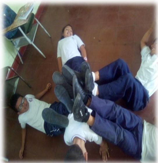
Imagen 7. Quinta actividad “El robot”