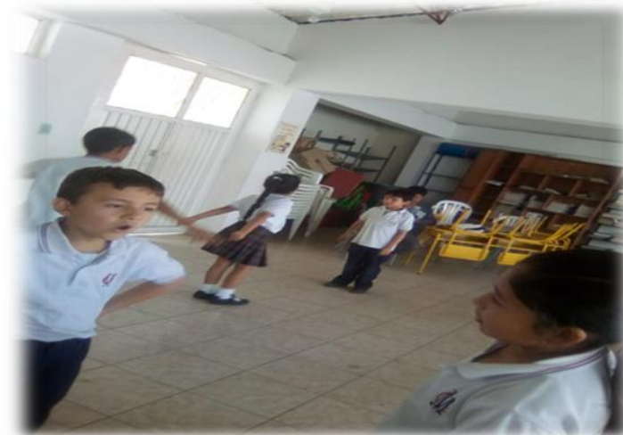
Imagen 12. Juego de imitación

Esto sucedió, precisamente porque el juego teatral se volvió importante para los y las estudiantes generando la confianza y el acercamiento entre compañeros. Por ejemplo, cuando debían contar historia de manera grupal, ellos y ellas se motivaron mucho, mostrándose emocionados y atentos para continuar la historia que hacían sus compañeros. De esta manera se vincularon todos los y las estudiantes, abriendo espacio a la interacción entre pares de diferente género, así permitió que todos participaran y generan confianza entre todos.