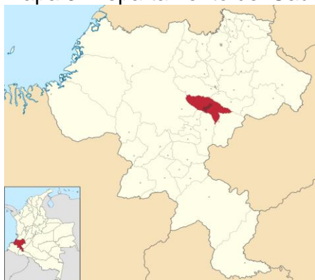
Mapa 3. Departamento del Cauca.

El municipio de Popayán es eminentemente urbano, tiene un 88,1% de población urbana y 11,9% de población rural (OPS et al., s.f.). Políticamente está conformado por 23 corregimientos: Cajete, Calibío, El Canelo, El Charco, El Sendero, El Tablón, Santa Bárbara, Figueroa, Julumito, La Meseta, La Rejoja, La Yunga, Las Mercedes, Las Piedras, Los Cerrillos, Poblazón, Puelenje, Quintana, Samanga, San Bernardino, San Rafael, Santa Rosa y Vereda de Torres; y la cabecera municipal, Popayán conformado por nueve comunas (Ramírez, Pérez y Ramírez, 2008).