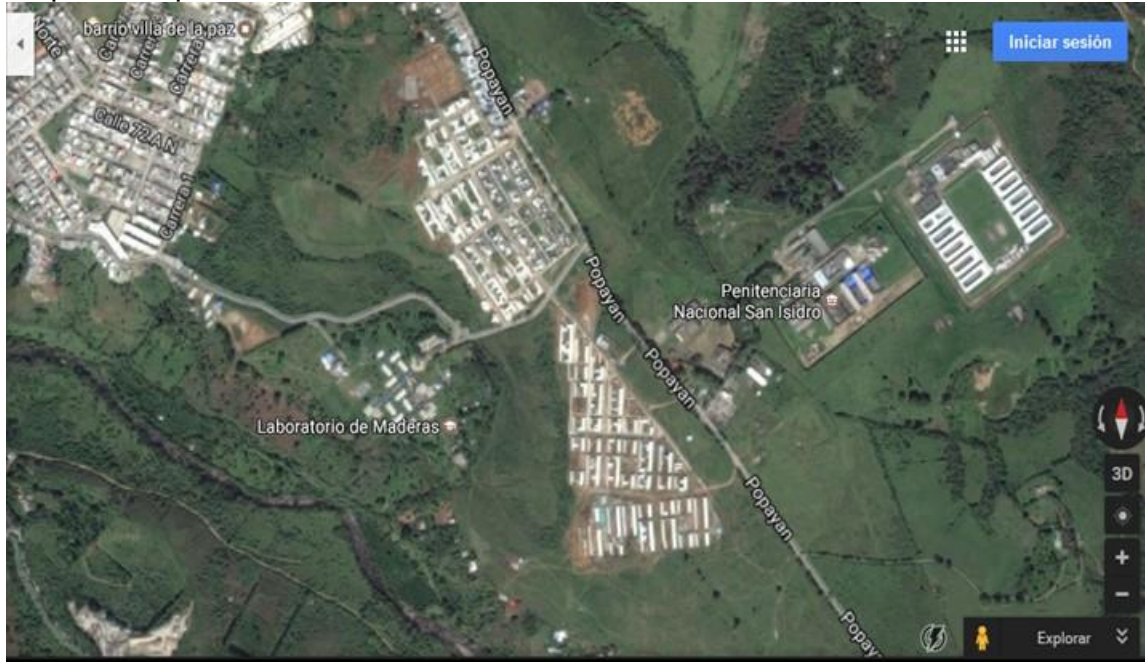
Mapa 6. Mapa satelital CIUDAD FUTURO LAS GUACAS