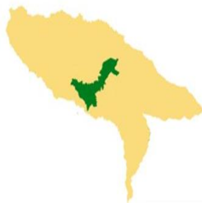
Mapa 4. Municipio de Popayán.