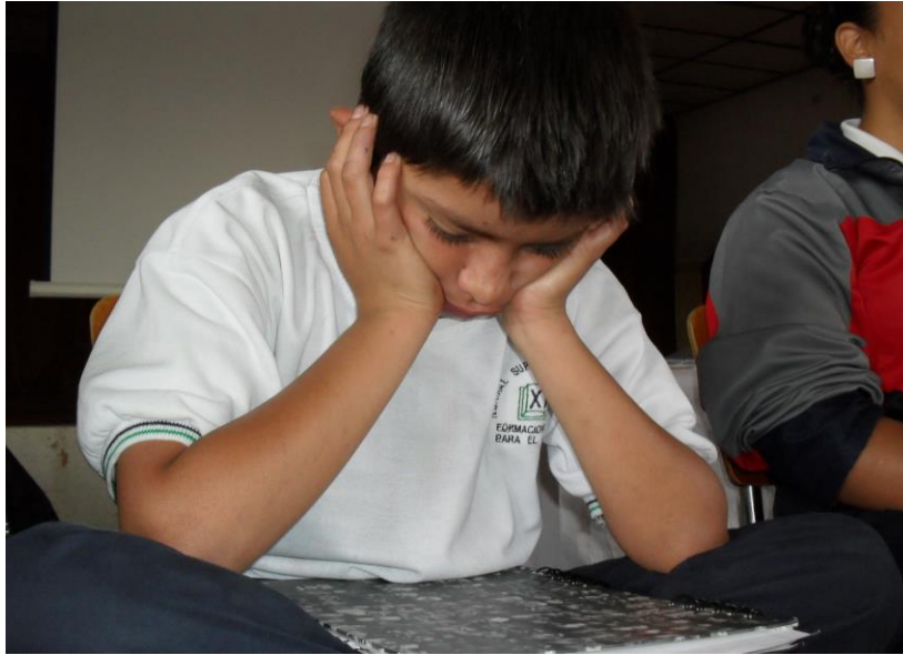
Foto 8: estudiante captando efectos sonoros. Abril 2010

Vemos entonces que los efectos de sonidos como elemento radiofónico permite al estudiante una actitud propositiva en colectivo, se asumen una actitud de pertinencia creativa, donde los sonidos cobran vida y la magia de corazones juveniles regocijan sonidos que convierten letras en ondas rítmicas y agradables para el oyente.