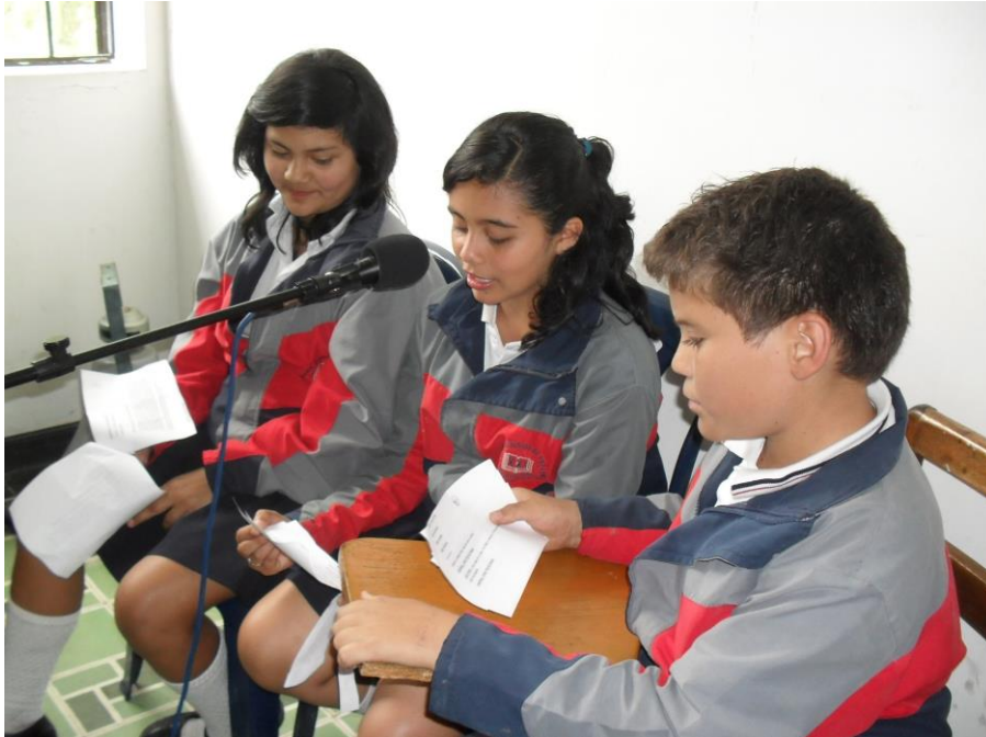
Foto 3: estudiantes grabando. Septiembre 2010

de proyectar a los oyentes imágenes auditivas, básicamente porque la radio es imaginación tanto para el que crea como para el que escucha .