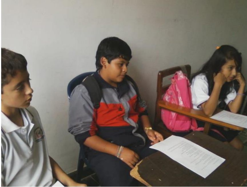
Foto 11: estudiantes construyendo guiones. Octubre 2010

PAPA: que pasa Jaimito. ¿Porque llegas sin saludar y golpeando todo lo que te encuentras?