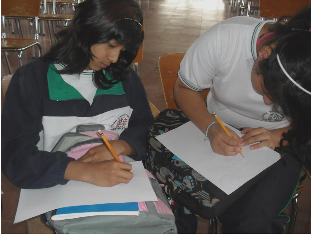
Foto 9: estudiante escribiendo pequeños guiones. Abril 2010