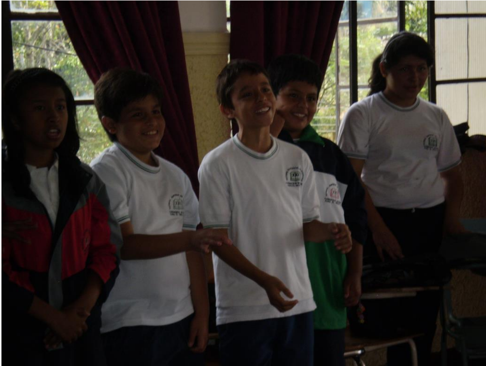
Foto 5: estudiantes jugando con la voz. Febrero 2010