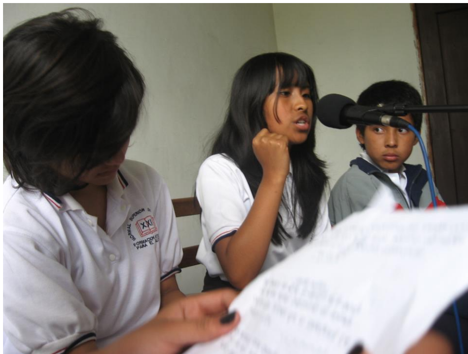
Foto 13: estudiante haciendo radio. Octubre 2010

modalidades que existen en la educación artística nos ayudan a sacar a flote nuestros mejores dotes humanos.