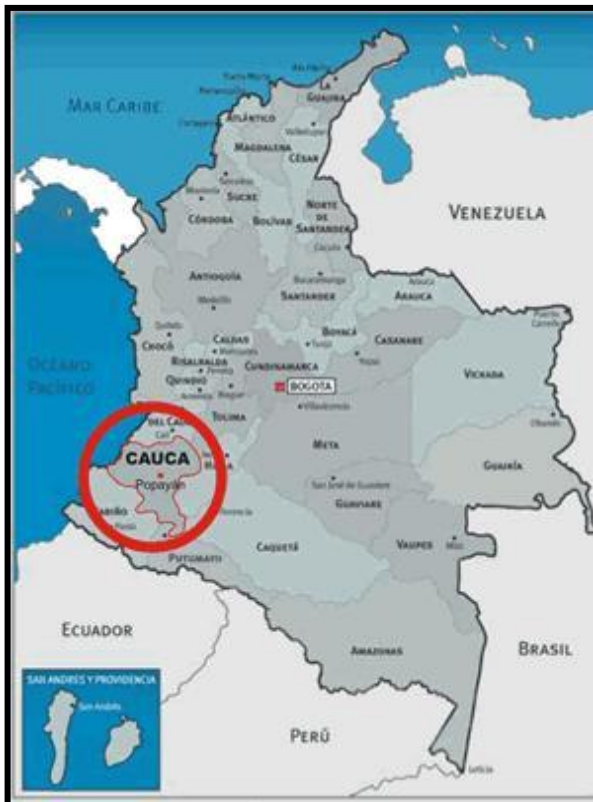
Mapa 1: Municipio de Popayán del Depto. del Cauca en Colombia

La Institución Educativa Escuela Normal Superior de Popayán, Cauca, Colombia, se encuentra ubicada en la calle 17 N° 11 a 43 salida Vía Sur, corresponde a las instituciones educativas de la Comuna seis, de acuerdo al POT (Plan de Ordenamiento Territorial)