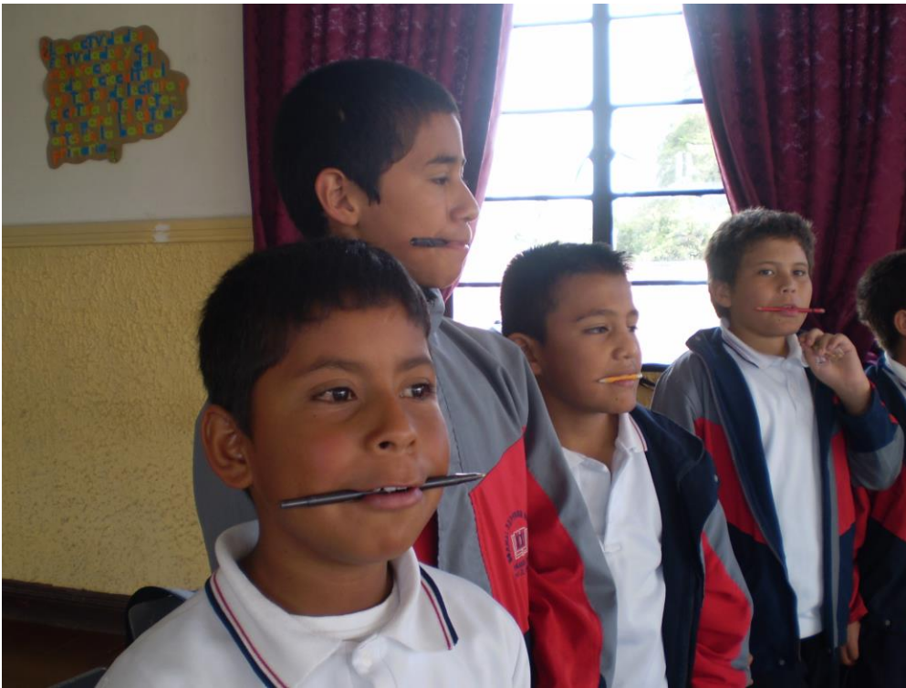
Foto 4: estudiantes trabajando la voz. Febrero 2010

haciendo que aumentaran y disminuyeran el volumen de sus voces a su vez trabajando la inspiración y expiración de aire para pronunciarla para ejercitar la intensidad y duración; de esta forma evitar daños que puedan causar en el aparato fonador logrando que la voz no tuviera altibajos y previniendo la disfonía, de la misma forma los estudiantes reconocieron que la voz sirve como terapia puesto que es la forma de manejar nuestras intenciones y fundamentos comunicacionales.