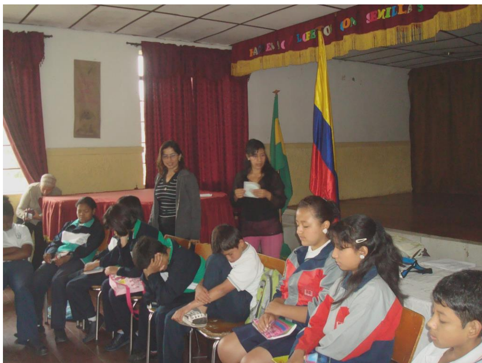
Foto 7: estudiantes realizando ejercicios de sensibilización. Marzo 2010

La música como elemento radiofónico en el taller de sensibilización, nos lleva a hacer una referencia en cuanto al entorno sonoro en el que viven inmersos los niños de nuestra sociedad, una sociedad en la que la música es utilizada con una intencionalidad claramente mercantilista, puesto que se produce en su mayoría hoy día con una intención lucrativa personal y/o empresarial, perdiendo casi completamente los mecanismos más tradicionales de transmisión (la familia, el juego, las celebraciones rituales de la comunidad, etc.) transformando a los individuos en consumidores pasivos de música, sin