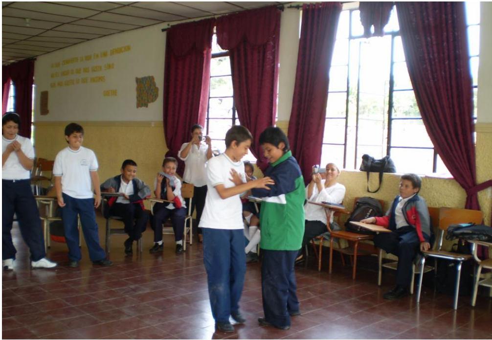
Foto 6: estudiantes reconociendo y creando a partir de melodías. Marzo 2010

se trabajó en un salón amplio, utilizando grabadora y CD de diferentes tipos de música (clásica, llanera, del oeste, andina) con la intención de que las y los niños con los ojos cerrados hicieran un viaje, transportándose de manera imaginaria a diferentes geografías y contextos.