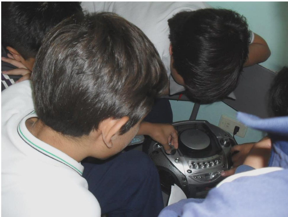
Foto 10: estudiante haciendo uso de las herramientas tecnológicas.

La voz como recurso natural fue el elemento primordial y esencial en este ejercicio para hacer los sonidos que necesitaban y que la historia llegara al oyente con naturalidad y con el efecto de misterio que ellos querían transmitir. A la vez hicieron uso de las herramientas tecnológicas como los celulares, grabadoras de mano, música en CD, en mp3, involucrándolos a la necesidad de la recursividad para dar gusto y esencia al producto de la narración, buscando en el escucha atracción y emotividad. Lo artístico está ligado a la facilidad de convertir una fantasía en una realidad mediante efectos sonoros, este ejercicio permite la participación, la concentración, la imaginación y el apoyo grupal.