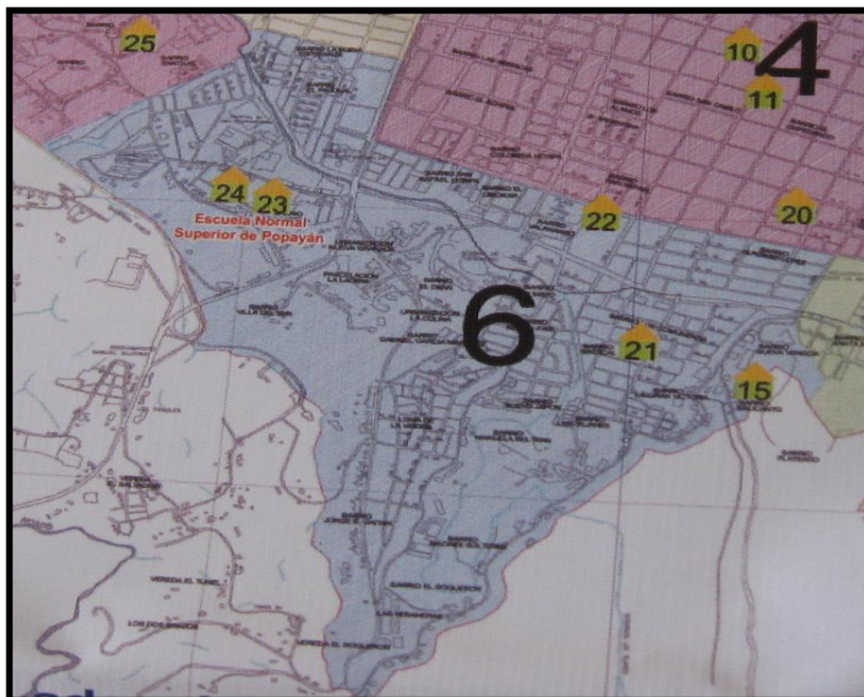
Mapa 3: ubicación institución Educativa Escuela Normal Superior en la Comuna 6