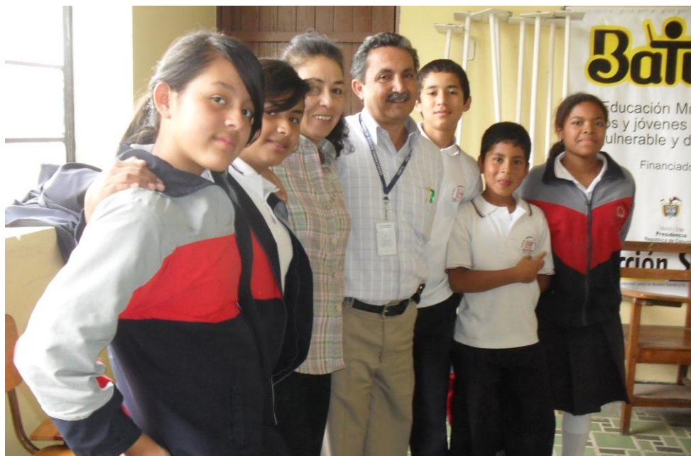
Foto 2: estudiantes con el rector de la institución. Marzo 2010

Actualmente, se llevan a cabo varios proyectos comunitarios y proyectos internos dedicados a la enseñanza y la proyección de la institución educativa, todos estos procesos bajo la dirección del especialista Hermes Idrobo.