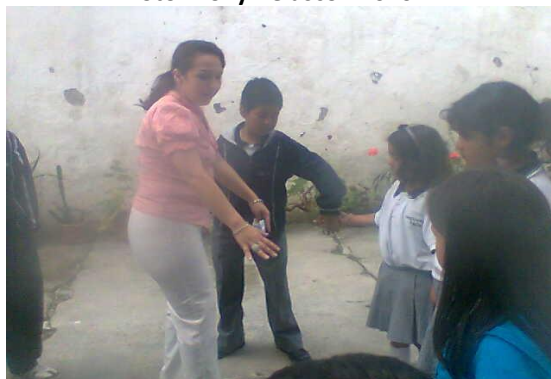
Taller para estudiantes dramatizando la lluvia– La Merced Foto: Dolly Velasco - 2010