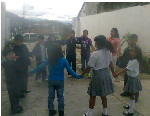
Taller para estudiantes – La Merced Foto: Diana Agredo - 2010

Artística. Es de ahí que consideremos que en nuestra práctica pedagógica hemos utilizado dos elementos importantes en la vida de los niños y niñas pues en las actividades de su vida escolar como son el juego y las manifestaciones artísticas- cantar, bailar, dibujar, actuar, tocar un instrumento- donde se les ve muy felices, pues pueden desempeñarse a partir de sus propios gustos e intereses. Es así que podemos decir que el juego y la educación artística van de la mano para el beneficio de los estudiantes por que con estos dos elementos se evidencia un desarrollo integral del estudiante donde con ayuda se puede hacer que los niños y niñas participen activamente se expresen y aprendan a manejar sus propias gustos y intereses desarrollando la capacidad de reconocer sus potencialidades ya sean artísticas y sociales.