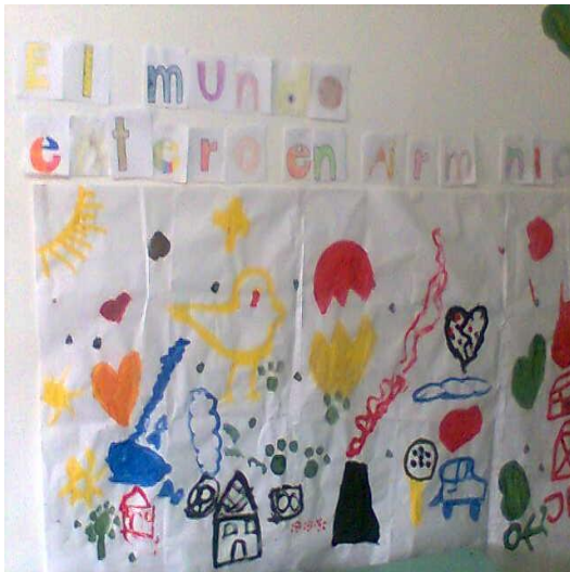
Exposición trabajo realizado en grupo – La Merced Foto: Diana Agredo - 2009