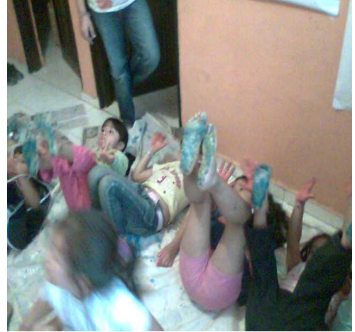
Taller para estudiantes jugando a pintar con los pies y las manos – La Merced Foto: Diana Agredo – 2010