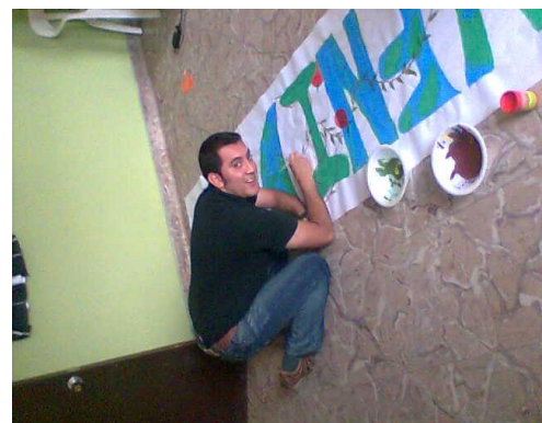
Taller con Docentes – La Merced Foto: DOLLY VELASCO 2009

Pero nos hemos encontrado una caracterización en los docentes que son los que permanecen una buena parte de tiempo con los niños y niñas, es que algunos no les gusta jugar y aun más preocupante, tampoco les interesa la educación artística.