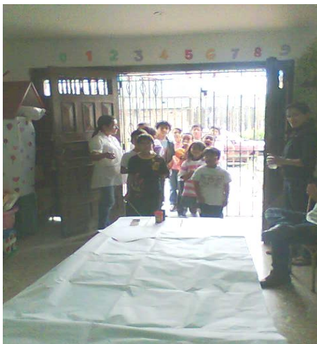
Taller para estudiantes – La Merced - 2010

De lo descrito anteriormente podemos reflexionar con una frase de Makarenko(1937:46)que dice “el desarrollo del juego infantil atraviesa por varios estadios cada uno de los cuales exige un método distinto” es claro que cada uno de los juegos realizados es desarrollado de manera distinta de acuerdo a la disposición de los niños y niñas puesto que su estado de ánimo, sus preferencias, su integración con los miembros del grupo puede en algunos casos generar dificultades que las maestras no podemos solucionar es entonces cuando buscamos apoyo (psicológico) dependiendo de el caso para así remediar a tiempo las dificultades que se presenten.