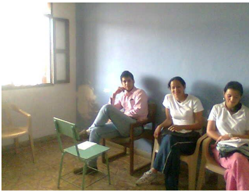
Taller con Docentes – La Merced

Es de ahí que consideramos que el juego es una oportunidad para el quehacer docente pues es el juego algo muy llamativo para los niños y niñas sin importar la situación en que se encuentren, en nuestra practica pedagógica investigativa utilizamos lo juegos de expresión y comunicación para hacer que la educación artística sea una área en la cual proporcione a los estudiantes una forma espontanea de expresar sus ideas, sentimientos y gustos.