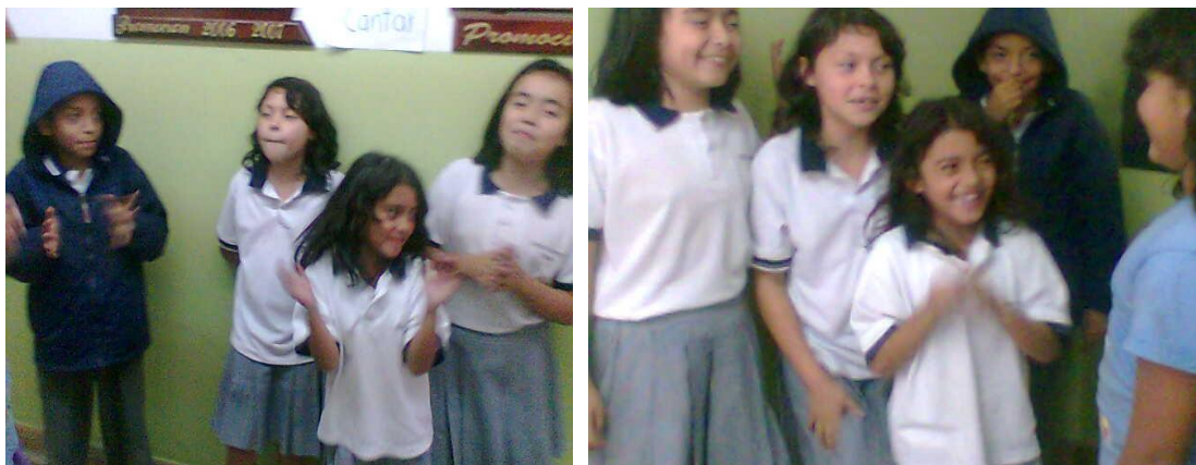
Taller para estudiantes – La Merced Foto: Diana Agredo - 2009