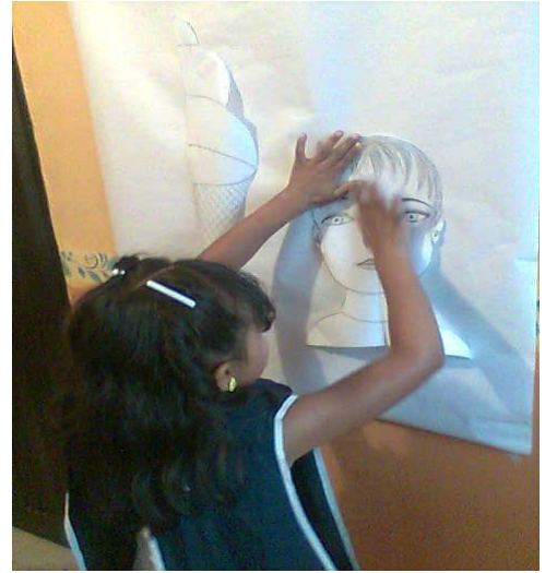
Taller para estudiantes jugando a armar simetrias – La Merced