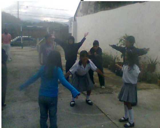
Taller para estudiantes dramatizando el viento – La Merced Foto: Dolly Velasco - 2010