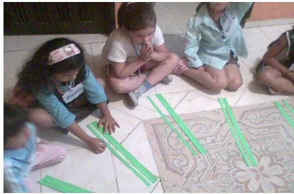
Taller para estudiantes jugando a crear – La Merced