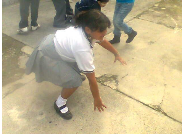
Taller para estudiantes – La Merced Foto: Diana Agredo - 2009