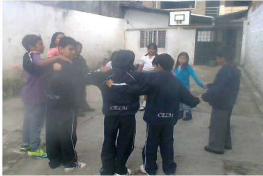
Taller para estudiantes – La Merced Foto: Diana Agredo - 2010