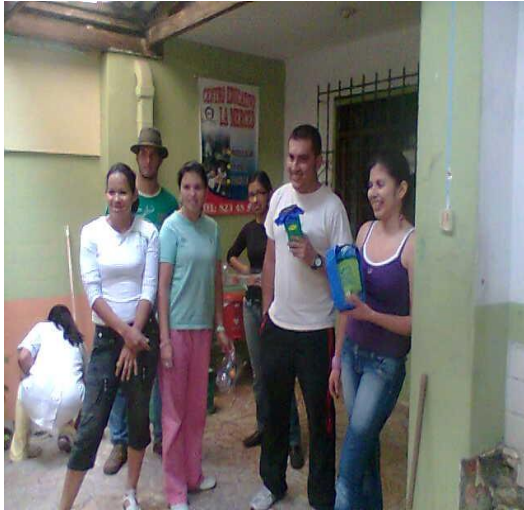
Taller Docente – La Merced