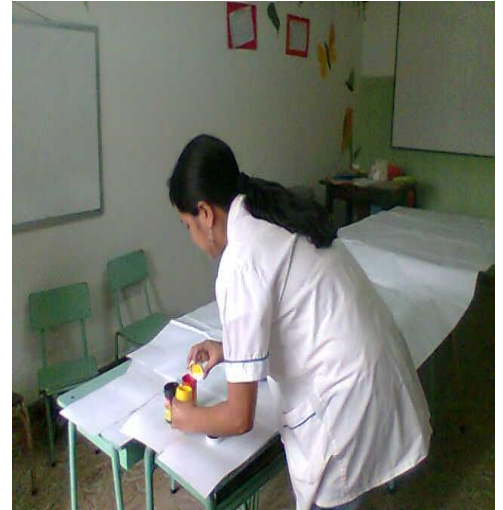
Taller Docente – La Merced