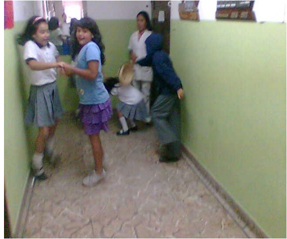
Taller para estudiantes – La Merced Foto: Diana Agredo - 2009

“Los jugadores a partir de los siete años tienden a fijar la unidad de las reglas admitidas durante una misma partida y se controlan unos a otros con el fin de mantener la igualdad ante una ley única”