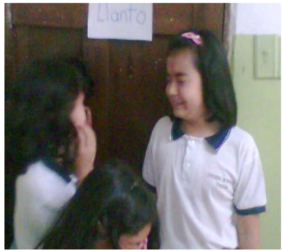
Taller para estudiantes – La Merced Foto: Diana Agredo - 2009

En el cual distribuimos el salón en cuatro rincones, en el primero les pedimos que rieran de la forma más natural posible, en este se observó que unos se miraban con otros y cuando empezó a reír el primero todos lo siguieron, en el segundo rincón un pequeño baile en el que uno de los niños prefirió no hacerlo y retirarse, los demás lo invitaban constantemente, pero se reía manifestando que no le gustaba, en el siguiente rincón debían fingir llorar, en este se mostraron mucho más espontáneos, fingieron llorar pero al final termino en risa. Por último el rincón donde debían cantar una canción de libre elección en este las niñas quisieron hacer un grupo aparte de los niños por que cuando estaban juntos no pudieron ponerse de acuerdo, las niñas al final cantaron una canción muy bonita, a los niños como no lo hicieron se les dio otras opciones como declamar una poesía o contar un gracioso chiste.