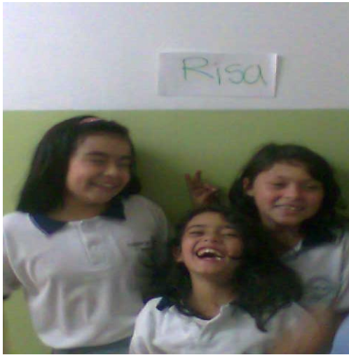
Taller para estudiantes – La Merced Foto: Diana Agredo - 2009