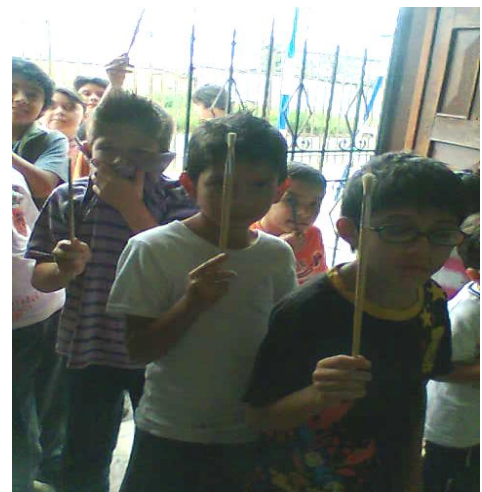
Taller para estudiantes – La Merced Foto: Diana Agredo – 2010

Continuamos el desarrollo del cronograma con el juego que consistía en representar con el cuerpo una historia, en esta ocasión les dimos la opción de