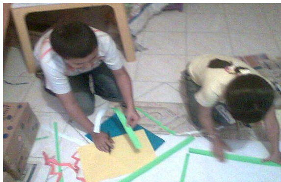
Taller para estudiantes jugando a crear – La Merced