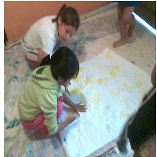
Taller para estudiantes jugando a pintar con los pies y las manos – La Merced 2010