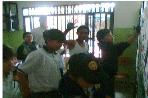
Taller para estudiantes – La Merced - 2009