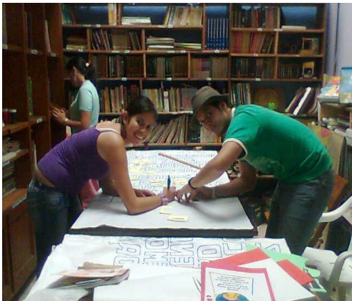
Docente Pintando – La Merced Foto: DOLLY VELASCO 2009

” Hábleme de problemas matemáticos le resuelvo, pero de educación artística si pocon, pocon por no decir que casi nada, siempre desde el colegio mis intereses han ido por las matemáticas y los deportes nunca he intentado tocar un instrumento, ni actuar y menos pintar y cuanto el juego con los niños es también muy limitado, a menos que sean juegos matemáticos”