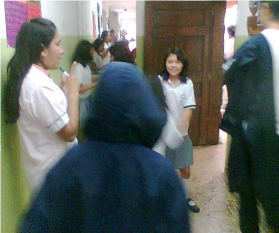
Taller para estudiantes – La Merced Foto: Diana Agredo - 2009