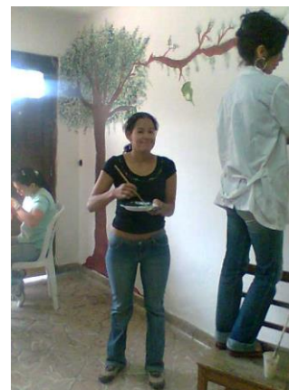
Docentes pintando en el taller – La Merced