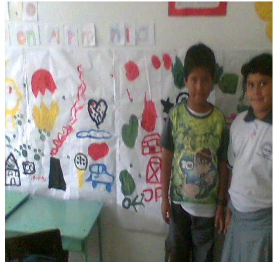
Estudiantes – La Merced Foto: Diana Agredo - 2009

También se evidencio por medio de los personajes que representaron el liderazgo de algunos, la creatividad de los más callados, el apoyo al talento y el cómo los niños y niñas viven la realidad de nuestro país, puesto que las películas escogidas fueron las realizadas en Colombia.