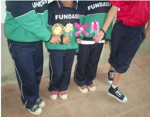
Figura 7. Títeres de varilla

Algunas actividades desarrolladas con las niñas fueron la fabricación de títeres como: muñeco de trapo, muñeco de calcetín, animalitos, títere de guiñol, títere de varilla, dicha actividad permitió evidenciar la importancia que cada estudiante le da a su muñeco realizado, para ellas, este era considerado como algo que sus manitas crearon y donde manifestaron una serie de aspectos con los cuales ellas se sentían identificadas, ya que esta serie de situaciones hacen parte de su vida.