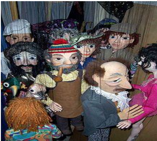
Figura 6. Títere de hilo o marioneta