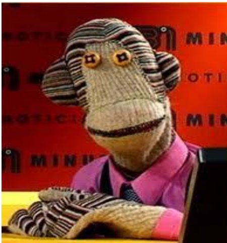
Figura 1. Muñeco de trapo