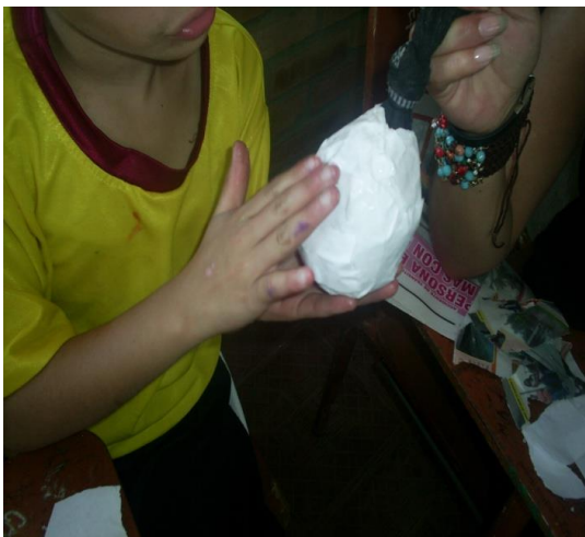
Figura 2. Muñeco de calcetín o media