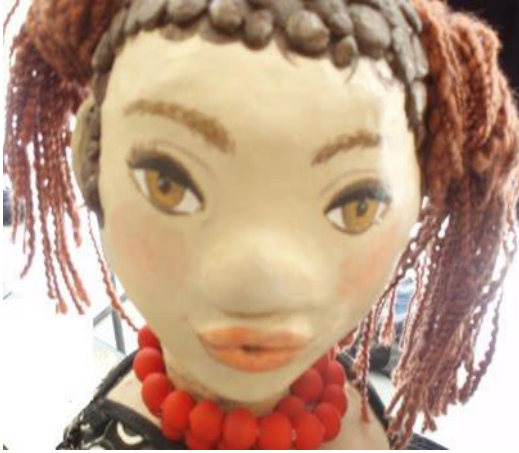
Figura 3. Muñeco ce tiras de papel