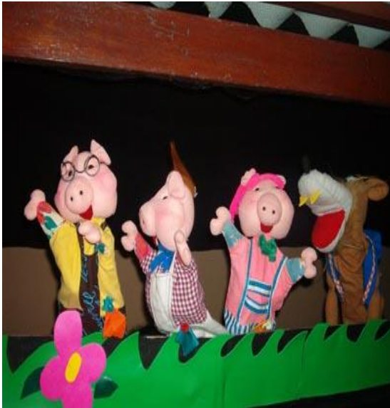
Figura 4. Animalitos