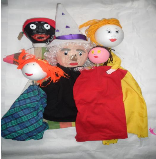
Figura 5. Títeres de guante o guiñol