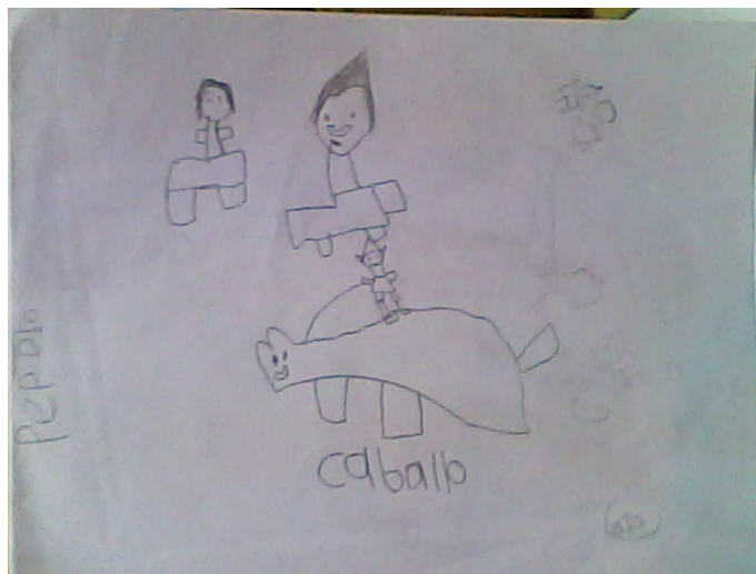
Pedro Castro (6 años)