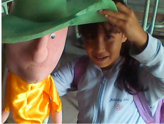
Abril de 2010. Estudiante interactuando con títere.