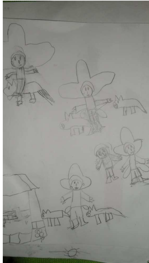
Leidy Tatiana Tumbo (7 años)