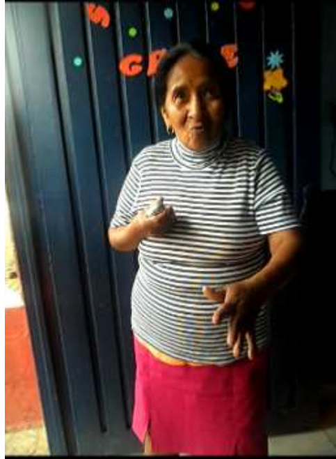
Mayo de 2010