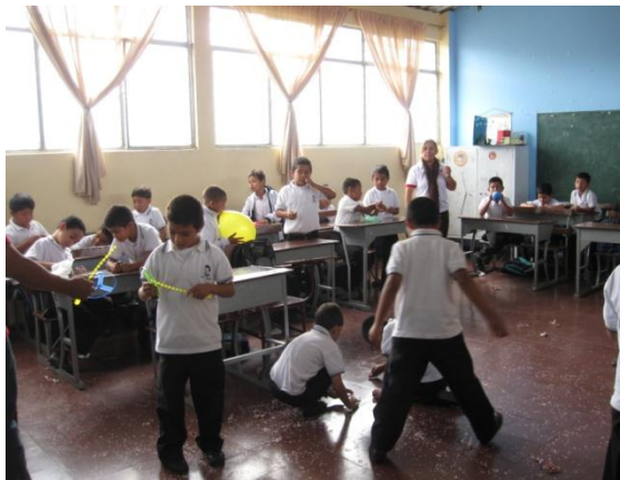
Fotografía 6. Taller de expresion corporal