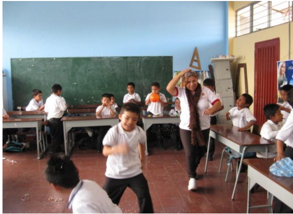
Fotografía 5. Integración grado segundo, fiesta y juegos dirigidos