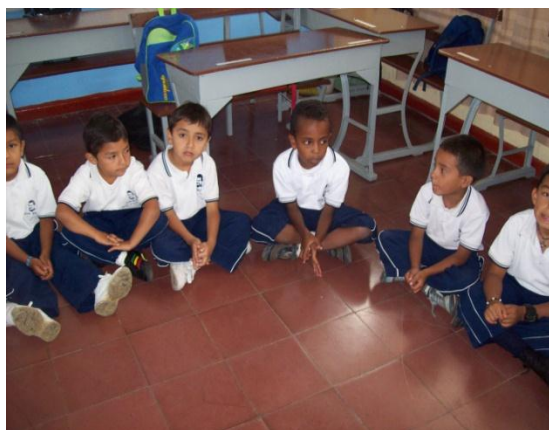
Fotografía 2. Estudiantes de primaria en formación general