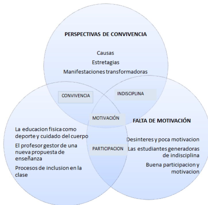
Ilustración 2. Perspectivas de convivencia