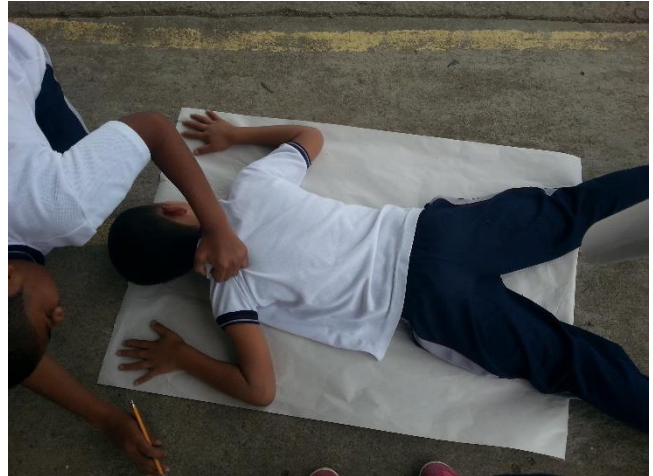
Figuras 3 y 4. Fotografía taller de memoria silueta o mapa del cuerpo