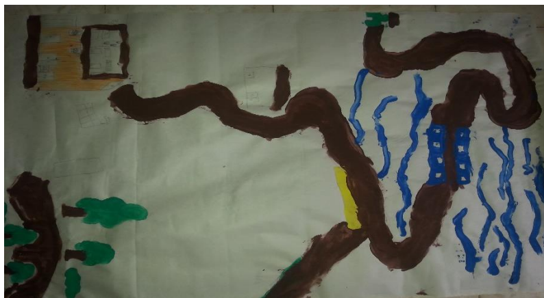
Figura 5 Fotografía taller de memoria mapa mental