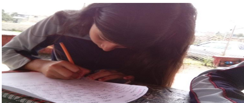
Figura 6. Fotografía taller de memoria “Mi cuento uno, dos, tres”

Mediante este cuento creado a la imaginación por cada niño y niña, se relacionaban los tres momentos en sus vidas; presente, pasado y futuro, los cuales deberían ir estrechamente relacionados entre sí, dentro del cuento sus propios nombres podían cambiar utilizando personajes de la televisión, o de sus muñecos favoritos pero relacionados con su historias de vida, en la clase siguiente se realizó una entrevista con cada uno de los niños y niñas sobre lo que habían escrito en sus cuentos, y se realizaron preguntas que iban saliendo referente a sus cuentos.