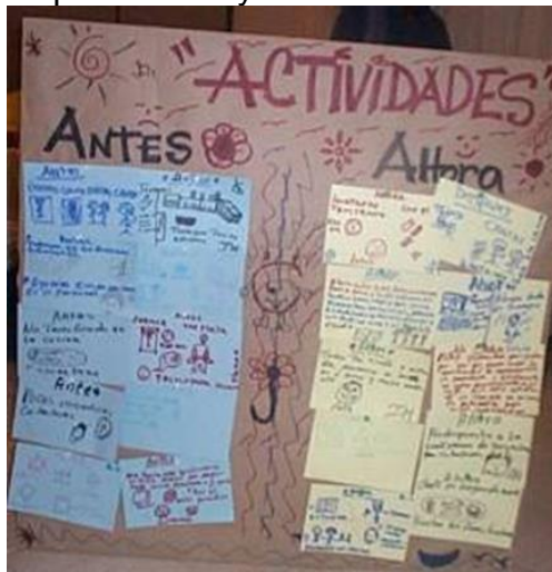
Figura 12. Ejemplo: logros personales y familiares

4.6.5.9 Plenaria y socialización del trabajo en grupos. 30 minutos. El objetivo es socializar el trabajo realizado en cada grupo con respecto al proyecto donde el relator es escogido por el mismo grupo que explicará a todo el grupo en general por espacio de 3 minutos.