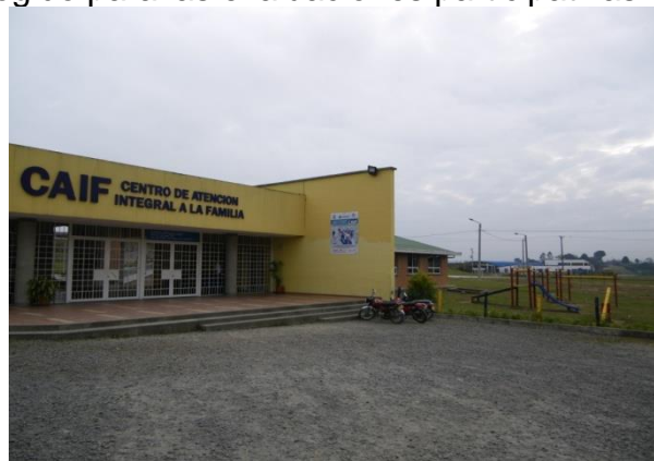
Figura 7. Lugar escogido para las evaluaciones participativas

4.7.5 Guía metodológica. A continuación se describirán las actividades que se desarrollan con el tiempo para cada actividad. Estos eventos tienen una duración efectiva de cuatro horas con la siguiente distribución propuesta.