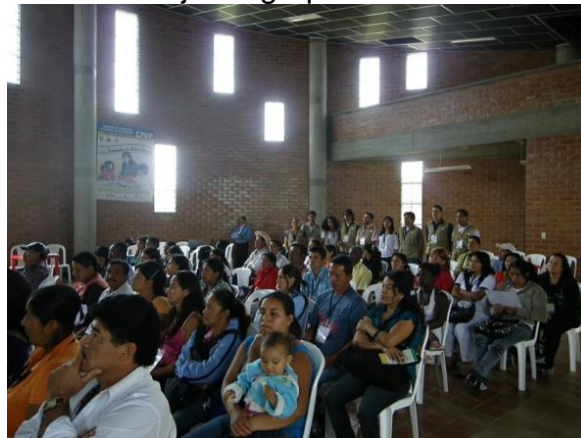
Figura 13. Socialización del trabajo en grupos

4.6.5.9 Plenaria y socialización del trabajo en grupos. 30 minutos. El objetivo es socializar el trabajo realizado en cada grupo con respecto al proyecto donde el relator es escogido por el mismo grupo que explicará a todo el grupo en general por espacio de 3 minutos.