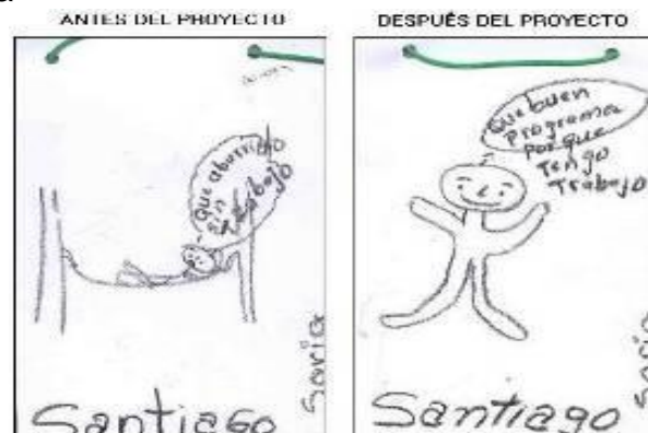
Figura 8. Escarapela