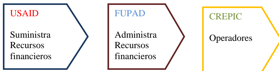
Figura 2. Relación y Función Entidades implicadas Proyecto “Formación y acompañamiento empresarial a familias desplazadas”

El Centro Regional de Productividad e Innovación del Cauca, CREPIC, busca mejorar la competitividad de las organizaciones regionales, a través de la articulación y desarrollo de las capacidades de innovación y productividad de sus actores con el propósito de elevar su calidad de vida y es seleccionado por FUPAD para desarrollar el proyecto mencionado.