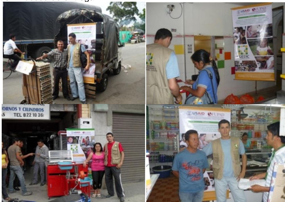
Figura 5. Proceso de entrega

El lugar de encuentro donde se hace entrega de las mercancías es el sitio de compra como muestra la figura 5 en el lado derecho; puesto que no se tiene