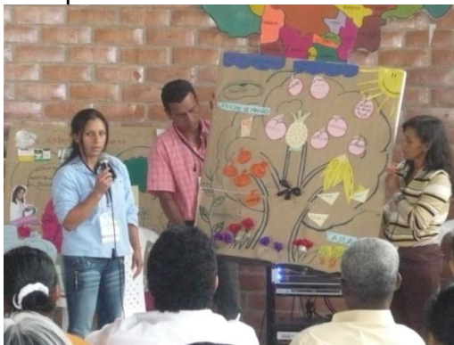
Figura 14. Soluciones y compromisos

4.6.5.14 Compromisos y conclusiones. 10 minutos. El objetivo es establecer las principales conclusiones del evento y los compromisos adquiridos a partir de las soluciones planteadas. Corresponde al cierre del evento con las conclusiones por parte de la Dirección del Proyecto de la entidad ejecutora (identificando compromisos con base en los resultados de la evaluación) y la Gerencia del Proyecto por parte de la FUPAD. Tener en cuenta en la planeación el tiempo adicional requerido para almuerzo, actividades lúdicas y evaluación del evento con el grupo de facilitadores, equipo de la entidad ejecutora, representantes de la FUPAD y otros actores.