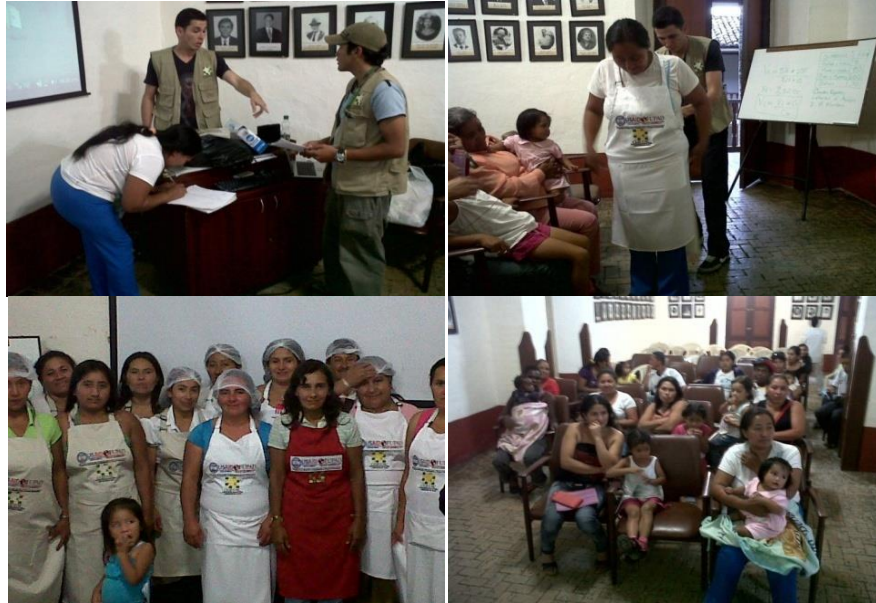
Figura 4. Capacitaciones

4.4.7 Manejo Ambiental. Este taller se dio basado en un plan de manejo ambiental al proyecto, y que de manera detallada, establece las acciones que se requieren para prevenir, mitigar, controlar, compensar y corregir los posibles efectos o impactos ambientales negativos causados en el desarrollo de cada uno de los planes de negocio de cada beneficiario.