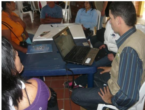
Figura 10. Presentación visualizada

4.7.5.4 Presentación visualizada. 10 minutos. El objetivo es establecer la conformación del grupo participante y el número de asistentes a la actividad: beneficiarios, entidad ejecutora, facilitadores, FUPAD, Red de Solidaridad, alcaldía y otras entidades; sin hacer una presentación individual.