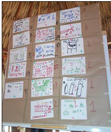
Figura 11. Perfil productivo

4.7.5.6 Perfil productivo. 30 minutos. El objetivo es definir las características del grupo de participantes con relación a las actividades económicas que en el momento de realización del evento les están generando ingresos.