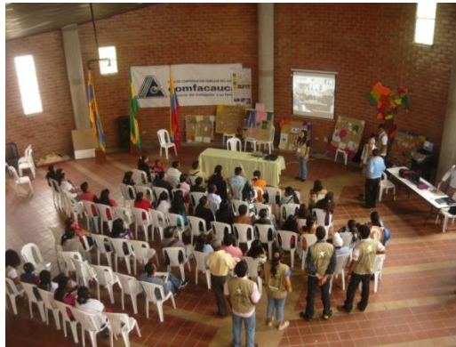
Figura 9. Iniciación del evento

4.7.5.4 Presentación visualizada. 10 minutos. El objetivo es establecer la conformación del grupo participante y el número de asistentes a la actividad: beneficiarios, entidad ejecutora, facilitadores, FUPAD, Red de Solidaridad, alcaldía y otras entidades; sin hacer una presentación individual.