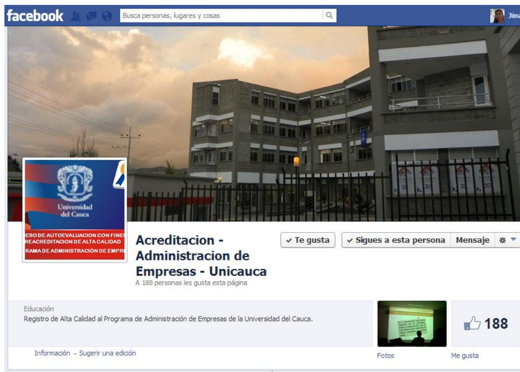
Imagen N° 04. Página en Facebook del proceso de autoevaluación del PAE.

Con el fin de dar a conocer a la comunidad universitaria el proceso de autoevaluación con fines de renovación de la acreditación del programa de Administración de Empresas se manejó la página en la red social Facebook creada en la primera fase del proceso y esta segunda fase se logró incentivar la participación de la comunidad universitaria, mediante publicaciones de interés general.