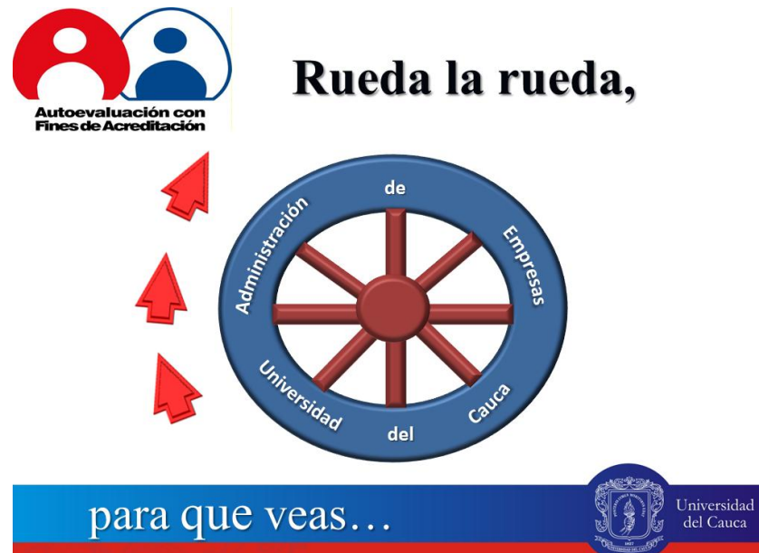
Imagen N° 02. Portada de Rueda la Rueda

Esta actividad se realizó en el anterior proceso de acreditación del programa y se retomó para el presente, el proceso de renovación se llevaron a cabo varias reuniones donde se hizo la socialización en tres sesiones a los estudiantes, directivos, profesores y administrativos.