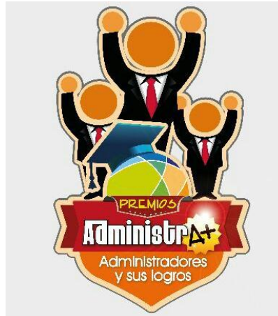
Imagen N° 05. Logo de evento ADMINISTRAMAS