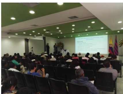
Figura 11 . Asistentes al evento

Se dio inicio al evento a las 8 de la mañana con la lectura de la programación establecida para el desarrollo de las jornadas propuestas, a continuación algunas imágenes del desarrollo del evento.