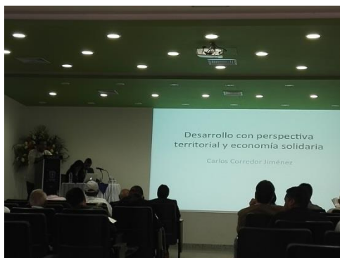
Figura 12 . Caso exitoso local