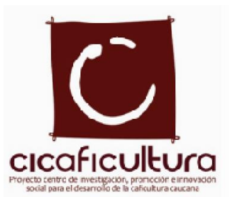
Figura 5 Proyecto Centro de Investigación , Promoción e Innovación Social para el Desarrollo de la Caficultura Caucana (CICAFICULTURA)