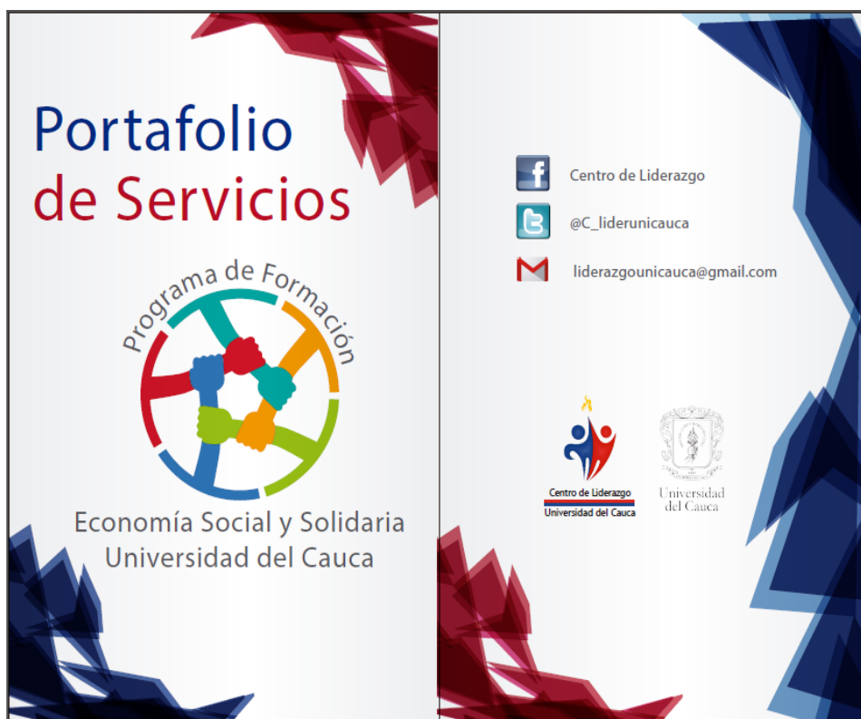
Figura 14 Portada Portafolio de Servicios Programa de Formación en Economía Social y Solidaria