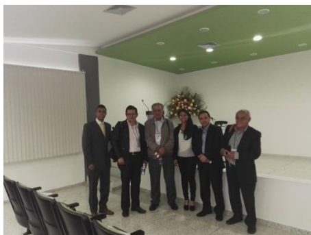
Figura 13 Organizadores y ponentes del evento

El Simposio de Economía Social y Solidaria logro la participación de 150 personas representadas en comunidad estudiantil de las diferentes Universidades, así como Organizaciones del sector solidario que operan en la Ciudad de Popayán.