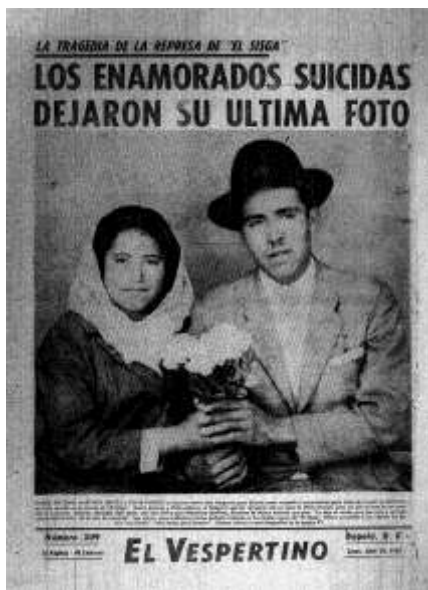
Fig.13. Los enamorados suicidas dejaron su última foto.

Banksy es un referente artístico que fortalece la producción de las piezas, la revisión de su obra influyó en reforzar la parte técnica, a la hora de crear la imagen donde me permite explorar las ventajas y características que puede ofrecer el stencil. El trabajo de este artista presenta un contenido satírico, sobre política, cultura pop, moralidad y etnias, propuestas que hacen parte del arte urbano, que han ganado un valor popular al ser visibles en varias ciudades del mundo, especialmente en Londres.