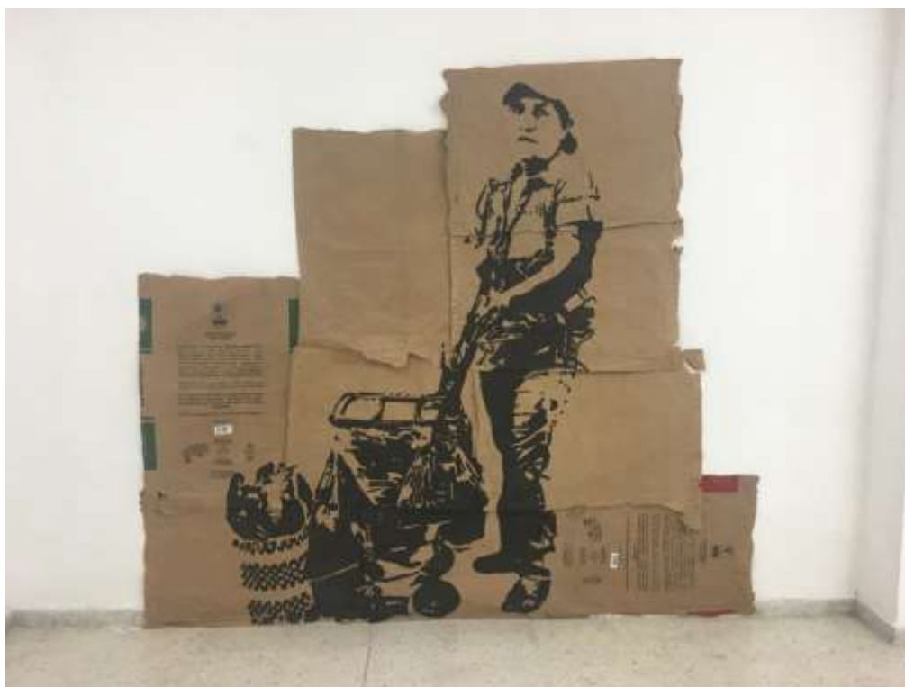
Fig.10. Ensamblado 1. (2018)

Corresponden a dos piezas elaboradas entre los años 2018 y 2019, como resultado a la indagación del proceso construcción de los artefactos ambulantes. Las imágenes que hacen parte de esta propuesta artística, son las vendedoras ambulantes con sus objetos de trabajo, que fueron creadas por medio del “stencil” sobre papel kraff industrial, soporte que fue encontrado en bodegas y plazas de mercados de la ciudad de Popayán.