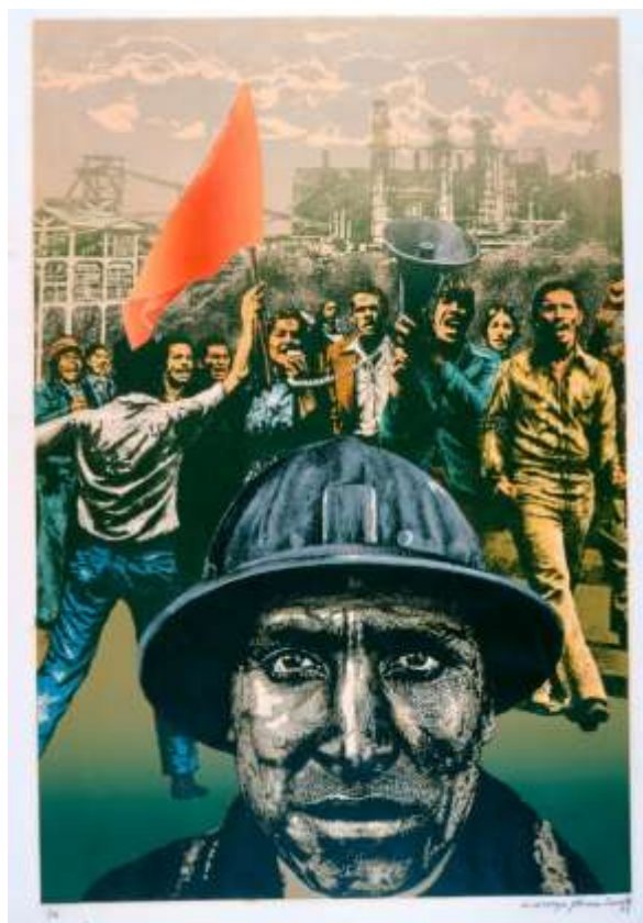
Fig.8. A la huelga 100, a la huelga 1000, 1979.Taller Cuatro Rojo.

desarrolló al lado de grupos estudiantiles, campesinos y obreros. Su propuesta plástica se perfiló bajo la idea de lo informal, con la idea de que su obra estuviera fuera del museo; pues la estrategia que tiene el museo es que la obra llegue a un espacio donde pueda ser formalizada como una obra de arte.