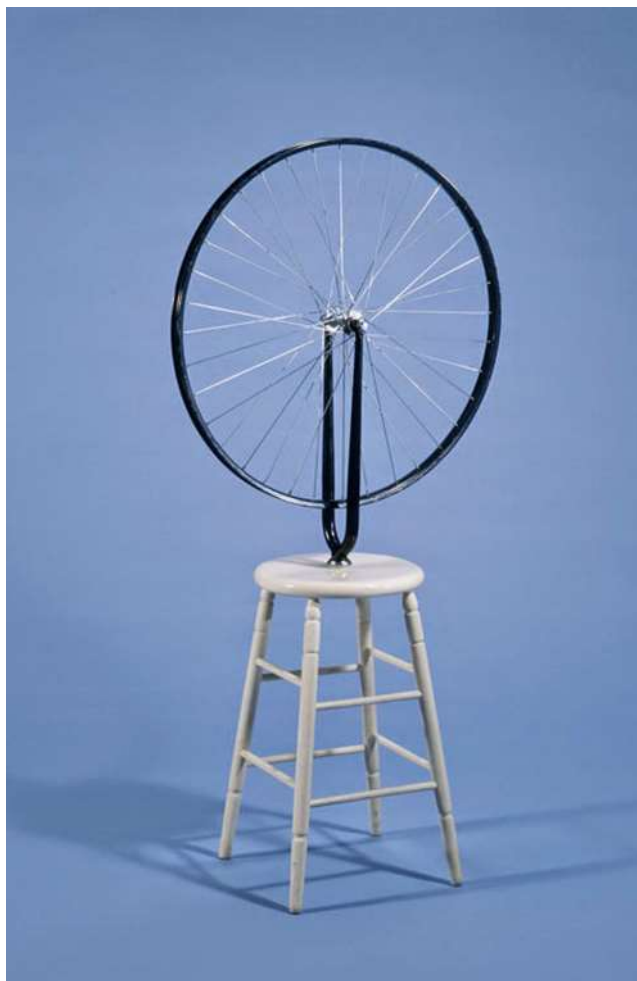
Fig.7. Rueda de bicicleta, 1913.Marcel Duchamp.

Como resultado del proceso de indagación enfocado en los vendedores ambulantes de Popayán y sus estructuras de trabajo, surge una propuesta plástica titulada Ensamble y proyecto , piezas artísticas que consisten en la elaboración de proyectores artesanales de características análogas, los cuales fueron elaborados con madera, lupas y una bombilla de luz led, teniendo como fin apartarme de dispositivos tecnológicos y digitales como video beam.