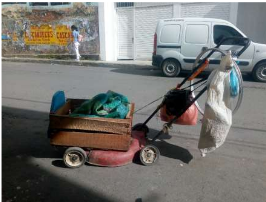
Fig.1. objeto ambulante 1.

Los elementos evocan en el creador opciones e ideas de cómo puede acoplarse cada uno de ellos, para formar un artefacto móvil; en algunos casos los artefactos ambulantes fueron la evolución de un solo elemento o parte que dio inicio de manera individual a la comercialización de un producto en las ventas informales, esto se debe a la adición de otros elementos al que se tuvo en el momento de iniciar con esta idea de trabajar en las calles, e hicieron que su forma y su función cambiara llegando a obtener un artefacto móvil, fácil de trasportar por los vendedores ambulantes, ejemplo: una caja de plástico que se configuró como vitrina para comercializar empanadas, cargada por un individuo por los diferentes espacios de una ciudad; con el paso del tiempo a la caja se le adiciona un coche de bebé o carro de súper - mercado, termos, canastas plásticas etc. con la idea de “ampliar” el negocio, debido al progreso e incremento de las ventas que llevan a la necesidad de modificar este elemento para encontrar en este mayor comodidad y espacio dado que los productos de comercialización son mayores a los inicialmente ofertados.