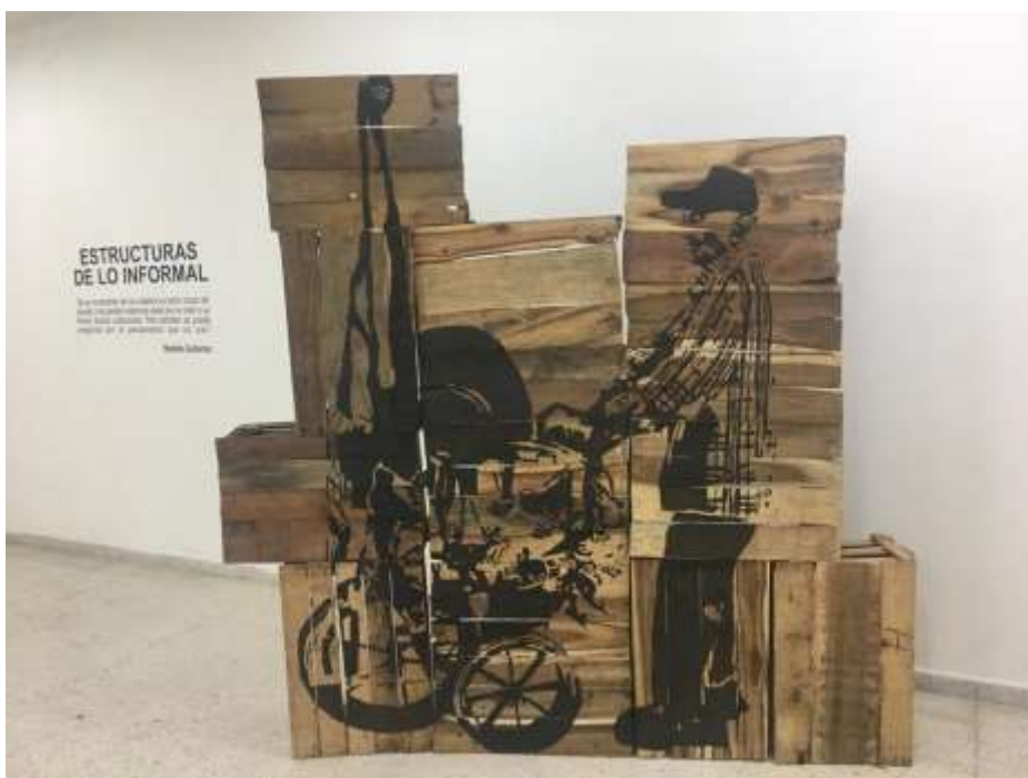
Fig.17. Artefacto 2. (2018)