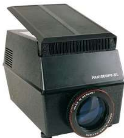
Fig.21 . Episcopio, 1906. Gerbrüder Bing.

personas que a diario se movilizan y trazan líneas invisibles en los diferentes espacios de una ciudad, como una forma de resaltar el papel que estos individuos desarrollan en la sociedad.