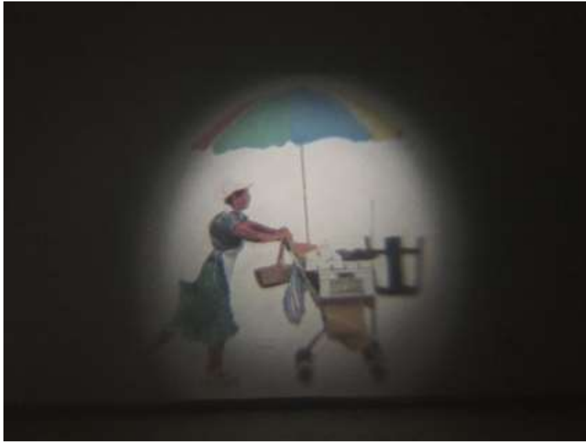
Fig.20. Ensamble y proyector 2. (2018)

Para la creación de los proyectores fue necesario la revisión de inventos del pasado como el “Episcopio” fabricado por el alemán Gerbrüder Bing, en el año 1906, utilizado para la proyección de tarjetas postales y diapositivas en una pared. Este artefacto es un referente que fue de mayor influencia para llegar a solucionar estos dispositivos, por ser un portador de la información necesaria de los principios que ejecutan su función. Además de Ana Claudia Múnera, otro referente artístico, su trabajo influyó para la creación de las imágenes a proyectar del vendedor y su objeto que complementan a estas piezas, a partir de la fotografía que es empleada como medio, para indagar a los individuos y las estructuras que hacen parte del comercio informal de la ciudad de Medellín. En “ A la rueda rueda ”, Performance del año 2007 realizado en la ciudad de Medellín con 120 vendedores ambulantes entre ellos hombre y mujeres, tiene como enfoque presentar la estética y la decoración particular de los coches usados para la distribución de productos en las ventas callejeras, con el propósito de dignificar a estas