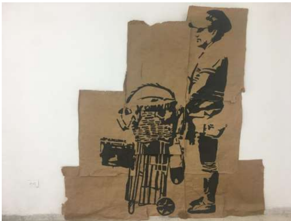
Fig. 11. Ensamblado 2. (2018)

El “stencil”, término procedente de la lengua inglesa, es una técnica que surgió en la época del Imperio Romano y tiempo después se popularizó en Francia y los Estados Unidos como un medio de expresión artística o arte urbano. El uso de esta técnica como lenguaje artístico empleado para la creación de mi trabajo plástico, recae en el propósito de enaltecer el acto de creación desarrollado por los individuos que forman parte de esta indagación, además de la labor que ejercen en la sociedad y el uso de elementos cotidianos de segunda mano, que son empleados para la producción de sus artefactos ambulantes, son las razones que me llevó a la transformación de su imagen y el objeto en piezas artísticas, donde el arte juega un papel importante desde la sensibilidad, la reflexión y primordialmente crea un pensamiento que se resalta, a partir de las formas pictóricas que funcionan como un rompe cabezas para dar vida a la imagen. Adicionalmente los recursos que ofrece este medio permite “reinterpretar” la fotografía