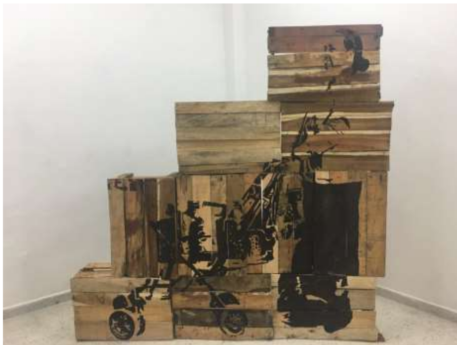
Fig.16. Artefacto 1. (2018)