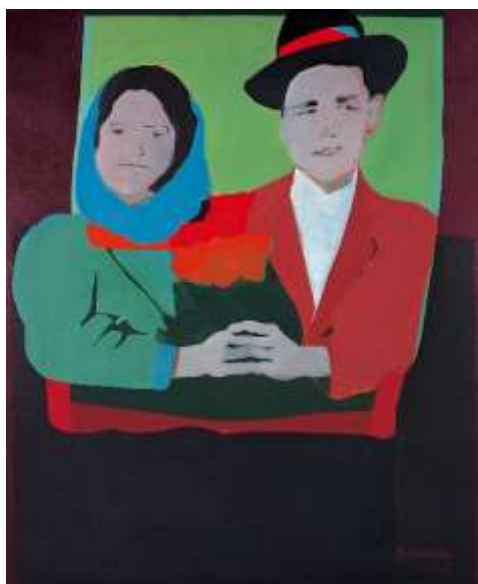
Fig.12. Los suicidas del Sisga, 1965. Beatriz Gonzales.

Un Ejemplo a la idea planteada por Barthes es la pintura titulada “los Suicidas del Sisga” de 1965, de la artista colombiana Beatriz González. Este trabajo fue creado mediante la reinterpretación de una fotografía publicada en las páginas de un periódico Bogotano, que relata el suicidio de una pareja de enamorados en el embalse Sisga, individuos que optaron por una muerte voluntaria, bajo la idea de impedir que la novia perdiera su pureza. El propósito de esta pintura da inicio a una exploración gráfica que parte de relatos periodísticos, que busca construir la memoria popular de un país, azotado por la violencia.