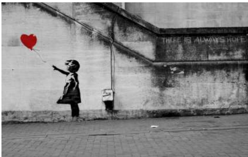
Fig.14. Niña con Globo, 2002. Banksy.