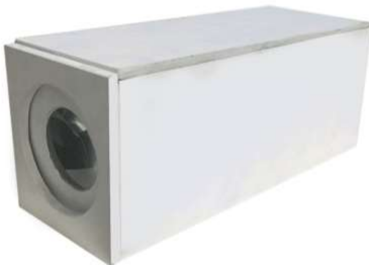
Fig.18. proyector artesanal.

Teniendo en cuenta los factores que hacen parte del acto de creación que aplican los vendedores ambulantes, donde predomina el pensamiento de encontrar una solución para materializar una idea, surge la creación de dos proyectores artesanales de características análogas, contruidos con madera, lupas y una bombilla de luz led, cuyo objetivo principal radica en apartarme de los dispositivos tecnológicos y digitales como los video bean, para la creación de estos como piezas de arte, en los que se proyecte las imágenes de los vendedores informales y su objeto de trabajo, captadas por medio de fotografías.