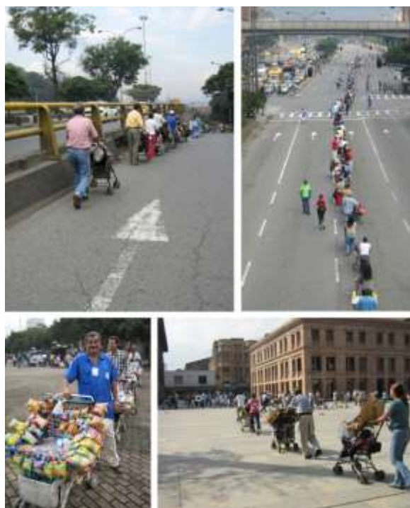
Fig.22. A la rueda y rueda, 2001. Ana Claudia Múnica.