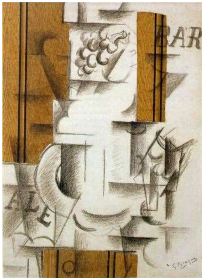
Fig.5. Plato de fruta y vaso, 1912. George Braque.

George Braque es otro artista que utiliza la técnica del “assemblage” para la creación de su trabajo plástico; Plato de fruta y vaso , 1912, collage que se caracteriza por el uso del dibujo como una técnica adicional a esta propuesta, empleando, para la construcción de los objetos como el plato, las uvas y los elementos fragmentados que hacen parte de su composición. Braque es el pionero en experimentar con materiales que se componen de texturas utilizados para la decoración de paredes, además de ser otro de los artistas que aplica a su trabajo la técnica papier collé; la idea de assemblage se remonta en intervenir su trabajo con este tipo de papeles texturizados, además de la combinación de dos técnicas.