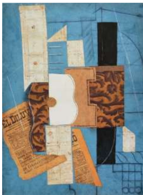
Fig.4. Guitarra, 1912. Pablo Picasso.

Individualmente los elementos tienen su propia identidad y función, pero en el acto de unirlos se sostiene un equilibrio de fuerzas que se distribuyen entre sí, fusionándose como un solo objeto sin importar la forma, material y color ante una composición. En el campo artístico Pablo Picasso fue uno de los artistas que empleó la técnica de “assemblage” para la creación de la obra Guitarra , del año 1912. La segunda década del siglo XX fue una época en la que Picasso hizo un experimento compositivo a partir de la proyección de elementos espaciales sobre una superficie plana, además su construcción recae en la intersección de formas geométricas de manera que aludan al objeto representado mediante la técnica del papier collé usando materiales como periódicos y papel de pared, lo que llevó a que las formas representen el objeto.