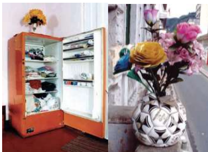
Fig.2. Bricolages, Signos de segunda mano. Colectivo Bricolage de Bogotá.

Una particularidad que podemos apreciar en los vendedores ambulantes con relación al acto de creación que cada una de estas personas aplica en el proceso constructivo es el siguiente: cada método que se emplea para la producción de los artículos informales se diferencia uno del otro, el método se convierte en un sello o marca personal del creador, este se adapta a las necesidades que el vendedor pretenda satisfacer, lo que hace que sus objetos cobren un valor de nivel de artístico, por el solo hecho de que su resultado final, despertaron un interés para la mirada de un grupo de artistas (Pablo Adarme, Sandra Mayorga y Carolina Salazar) pertenecientes al “Colectivo Bricolage”. Su trabajo se interesa por los objetos que fueron contruidos con elementos que la gente ya no usa, por medio de la fotografía, su trabajo se enfoca en los artefactos ambulantes y los domésticos con el fin de registrar el ingenio detrás de su construcción, empleado por un individuo, como una forma de solución ante los problemas cotidianos.