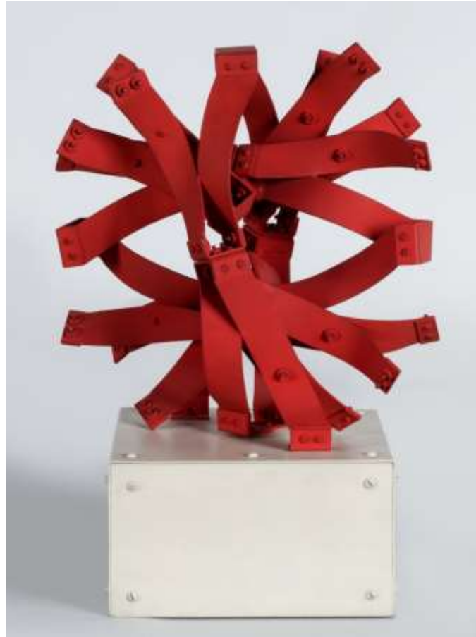
Fig.6. Sol, 1987. Edgar Negret.

La “apropiación” es otro de los términos que se puede identificar en el método de construcción de los artefactos ambulantes. Bourriaud (2001) define el término “apropiación” de la siguiente manera: “la apropiación es en efecto el primer estado de la posproducción; ya no se trata de fabricar un objeto sino de seleccionar uno entre los que ya existen y utilizarlo o modificarlo de acuerdo a una intención específica” (p 24). Lo que el autor afirma tiene un acercamiento con el proceso de construcción que aplican los vendedores ambulantes a los objetos que utilizarán como su medio de trabajo, quienes, al encontrarse con una variedad de materiales, seleccionan aquellos que mejor encajen en la estructura de acuerdo a la necesidad que presenten y la función que estos vayan a cumplir. Una vez realizada la selección, el creador sin