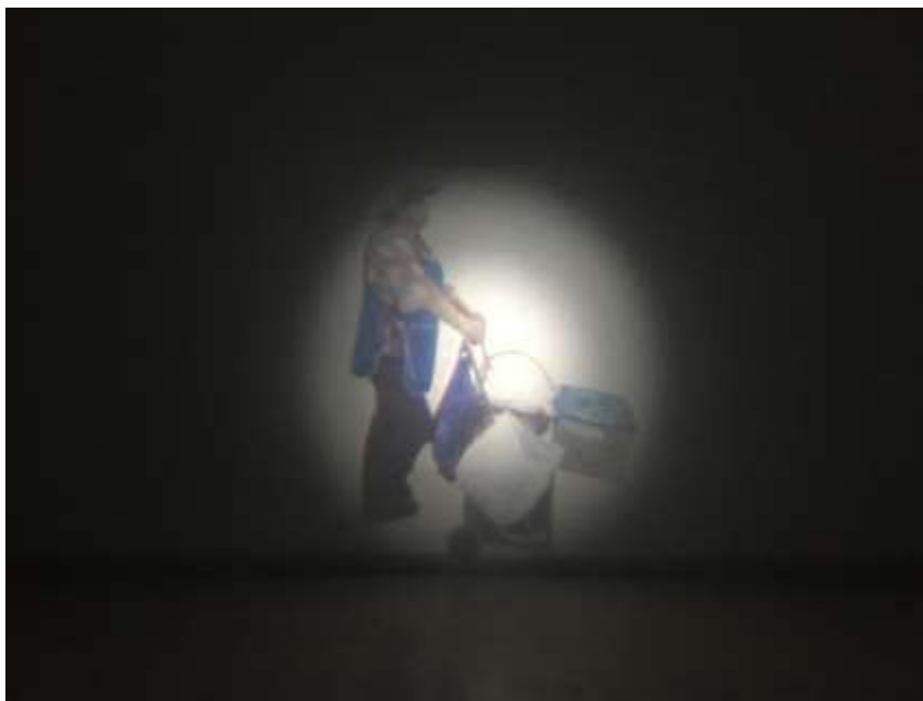
Fig.19. Ensamble y proyecto 1. (2018)

El interés reside en que estos objetos son inductores habituales de asociaciones de ideas (biblioteca = intelectual) o bien, de un modo más misterioso, auténticos símbolos (la puerta de la cámara de gas de Chessmann remite al portal mortuorio de la antigua mitología) (p.18).