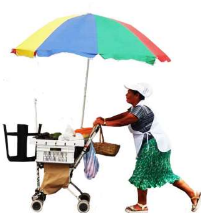
Fig.3. vendedora con objeto 1.

Así un producto no se volvería realmente un producto sino en el acto de consumo, puesto que un vestido no se vuelve vestido real más que en el acto de llevarlo puesto; una casa deshabitada no es de hecho una casa real. (Bourriaud, 2001, p.22)