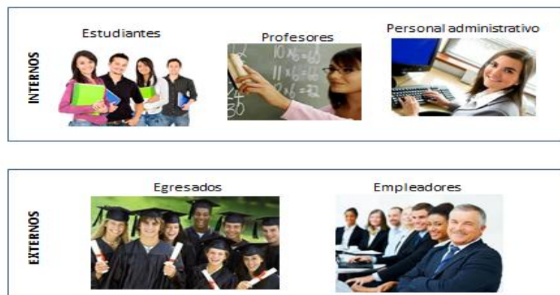
Figura 4: Población objetivo de aplicación encuestas.