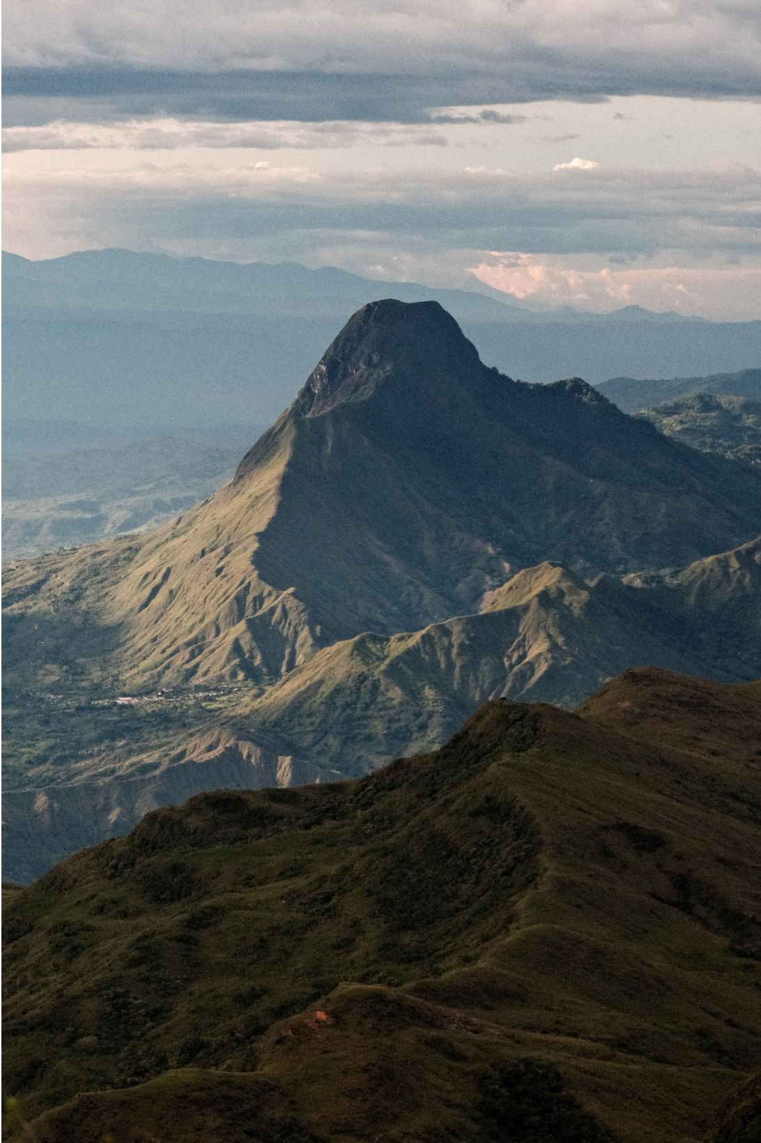
Imagen 1 "Lerma desde el cerro de Bolívar"