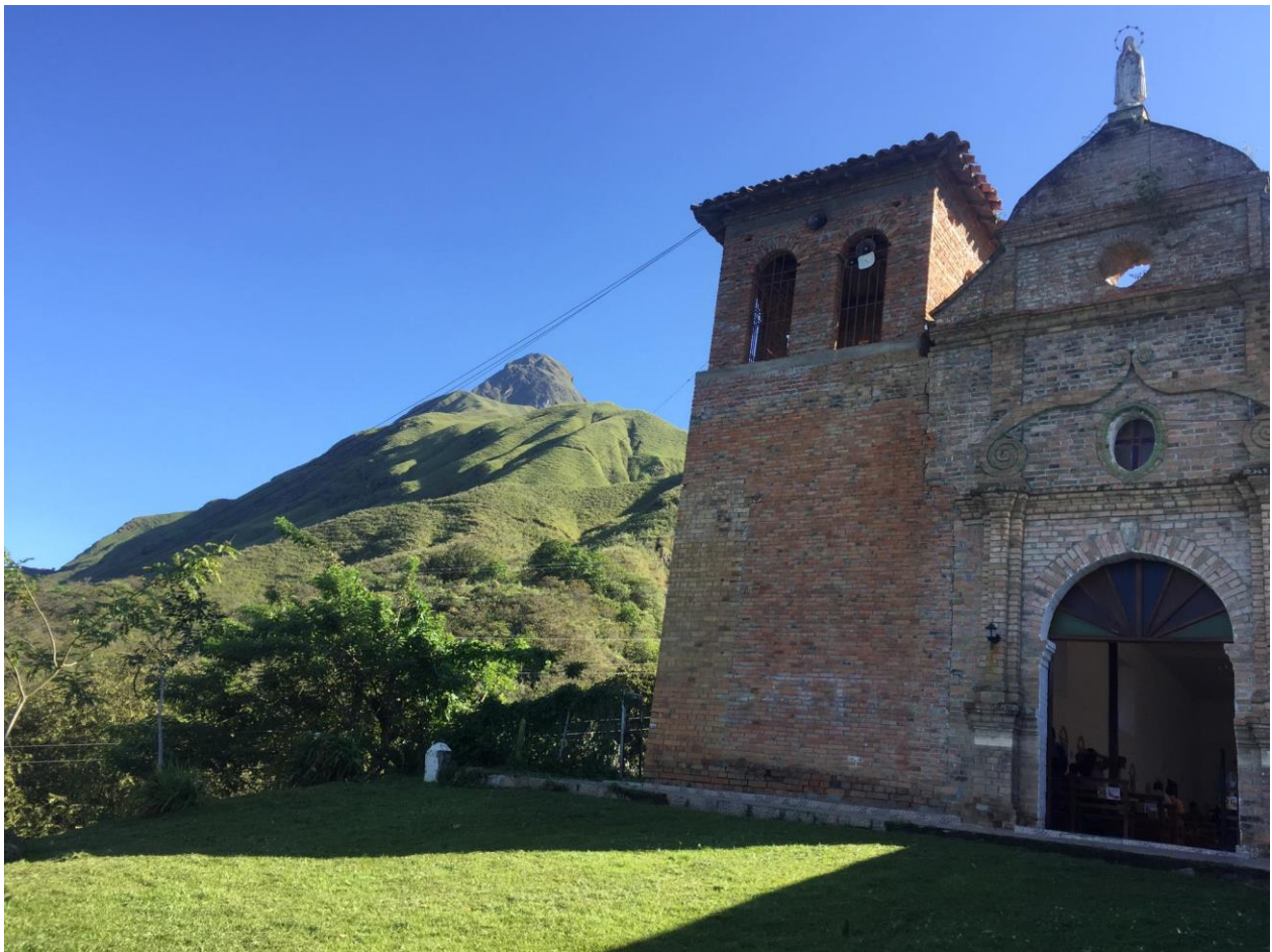
Imagen 9 “Iglesia San Antonio de Padua”.

De este modo, tales entidades y espectros en guerra perpetua son el proceso mediante el cual se encubre, calibra y contiene la violencia intrínseca a esta labor incansable de lograr el consenso. En el afán por proteger el carácter igualitario de la sociedad, emerge una violencia espectral, la cual conforma mundos que “son el fulcro de la imaginación moral, y también una especie de reserva creativa de un potencial cambio revolucionario” (Graeber, 2011: 43), erigiéndose como espacios invisibles al poder, que problematizan las implicaciones morales del mismo y de las lógicas que ponen en riesgo la comunalidad campesina. Son, en términos de Graeber, formas de contrapoder profundamente arraigadas, que hunden sus raíces en la imaginación.