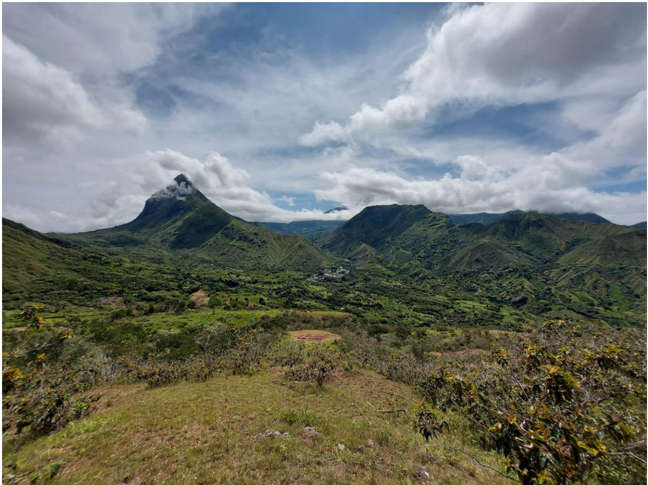
Imagen 4 “Paisaje del corregimiento desde el cerro del cobre”.

¿Cómo son representados los múltiples usos de la planta de coca, por los distintos actores que convergen en el corregimiento de Lerma, al sur del Cauca?