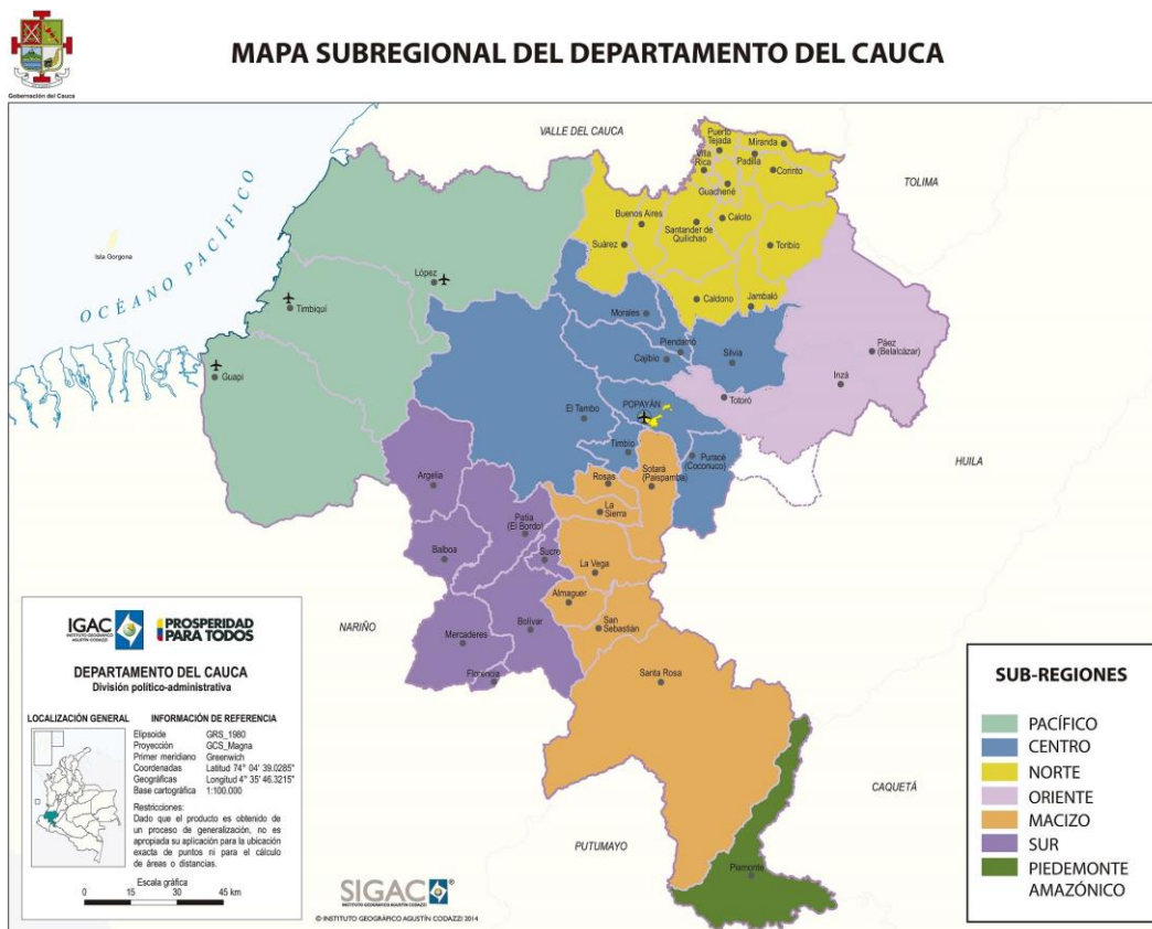
Imagen 2 Mapa subregional del departamento del Cauca.