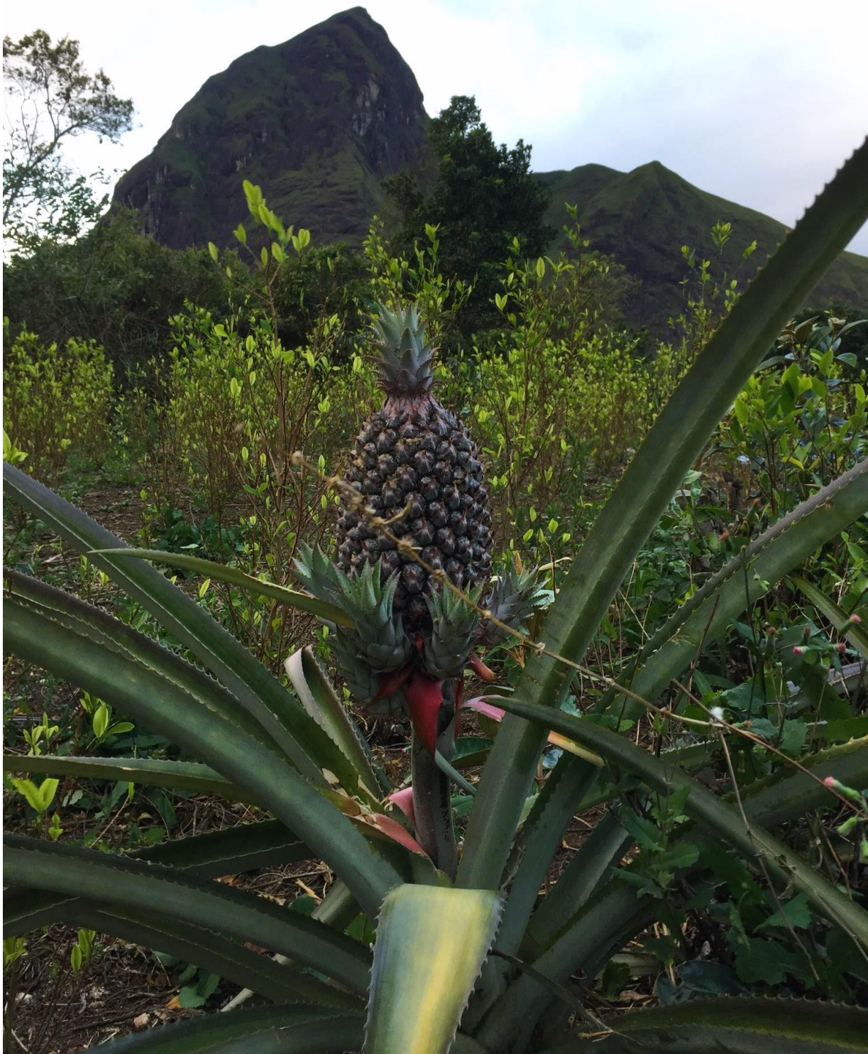
Imagen 8 “La piña, el cocal y el cerro”