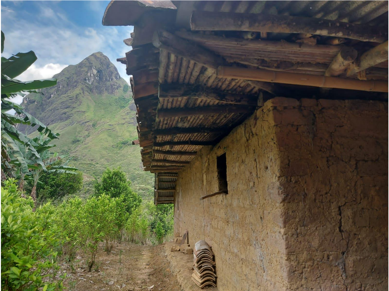
Imagen 10 “El cocal junto al rancho de adobe”.

límites no sólo de su corregimiento, en el que ya se empiezan a hacer más cotidianos los usos alternativos de la hoja de coca, sino también del país, teniendo participación en congresos nacionales e internacionales que, no obstante, serán tema del próximo apartado.