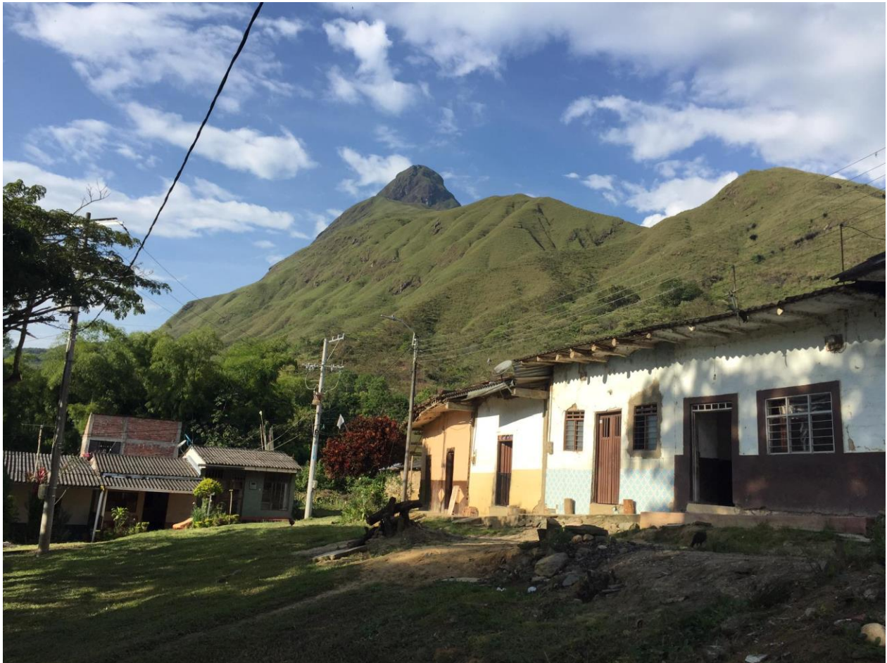
Imagen 6 “El cerro de Lerma desde la sombra del Ceibo” Foto: Alexander Quiñonez.

A raíz de ello, y de la exacerbación de la violencia en estos escenarios, en el 2021 durante mi estancia en campo, se tomó la decisión de prescribir el consumo de alcohol con el propósito de desescalar estos altercados nocturnos. De modo que, este ritmo no es, ni homogéneo, ni fijo en el tiempo, sino que, se ha visto atravesado y perturbado por distintos acontecimientos, de los cuales vale la pena resaltar, por ejemplo, la pandemia del Covid-19 en 2020, el estallido social del 2021, o la reconfiguración y recrudecimiento del conflicto armado que se experimentó en la región del sur del Cauca, durante la segunda mitad del 2022, que, aunque recientes, hacen parte fundamental de la memoria colectiva de los pobladores de Lerma.