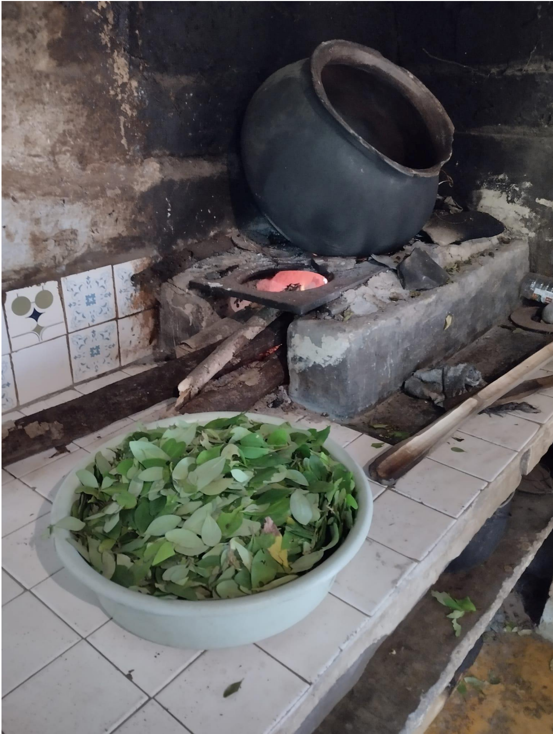
Imagen 5 “Callana sobre el fogón”.