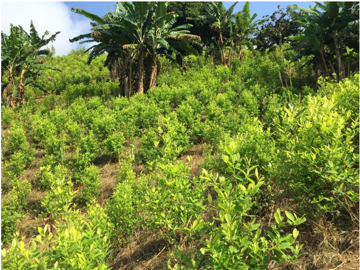
Imagen 7 “Eras de coca pajarito caucana”

Una aridez intermitente se ha agazapado entre el índice y el pulgar. Parecía fácil, pero quema desde dentro de la piel. Aun así, pasaré a la siguiente era; no de tiempo, sino de coca. Doña Berta había