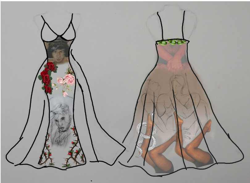
Figura 19. Diseño digital, boceto de la obra la novia, 2022.

Para la pieza de la parte superior decidí bordar el fragmento de la creación de Adán, pero muestra su mano más delicada, sus uñas están pintadas de rojo, los separan otros fragmentos de mi cuerpo, que muestran desnudes, separando ambas manos por el pecado de la carne, las rosas rojas son el símbolo de la divinidad cristiana y la pasión de cristo. También es símbolo de feminidad por presencia de la virgen como ser puro.