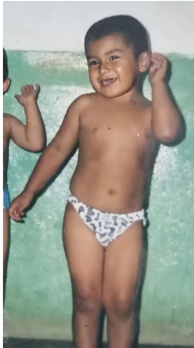
Figura 1. Fotografía, álbum familiar, 2001.

mi madre fue mi cómplice en aquellos juegos de imitar a una mujer, pero las otras personas de mi entorno solían hacer todo lo contrario. Al no tener ese apoyo y seguridad con los demás, reprimí mis gustos, me llené de miedo e inseguridades.