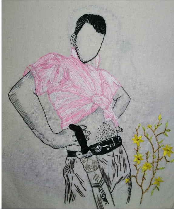
Figura 7. Serie campesino, bordado, 2022.

Este es mi autorretrato, las prendas son de mi padre que, aunque hombre, para ser un macho le falta mucho. Con su ropa me vestí a mi manera, para verme guapo, pero no de fuerza, si no de belleza, la pose no es del macho, es de las modelos del catálogo de ropa que tiene mi madre.