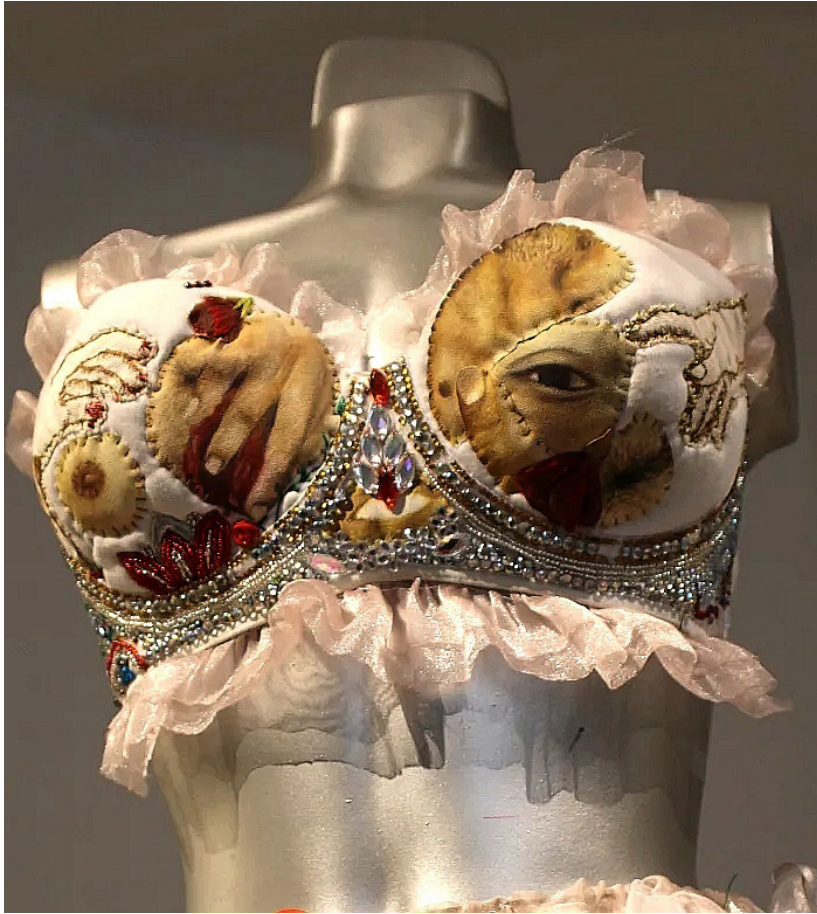
Figura 18. Fotografía digital, pieza superior, La novia, 2022.