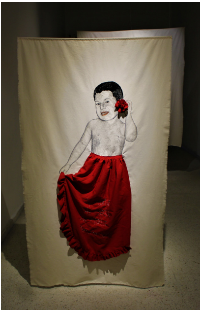
Figura 3, La moña, bordado sobre tela. 2022.

Bordar es unir el tiempo, un medio en el cual se medita y se sana, un tiempo de construirme y deconstruirme como ser, esas palabras que en mi niñez me hirieron, se reparan con hilo en el presente. Decidí hacer este bordado a escala natural para verme real, para volver al pasado y poder dialogar con el niño que fui, y que el espectador también pueda pararse frente a él como alguien real del mismo tamaño y proporción, como si viese a su hijo, sobrino o cualquier otro familiar.