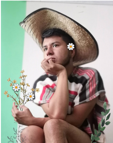
Figura 8. Fotografía, edición digital, 2022.