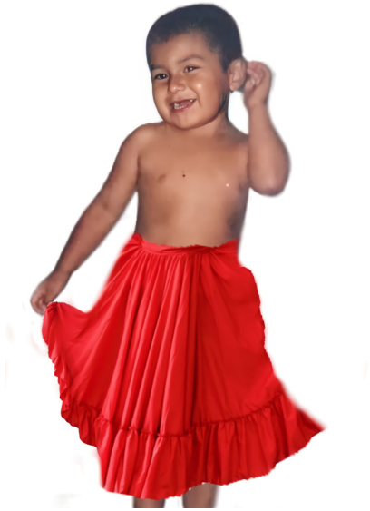
Figura 2. Fotografía, edición collage digital, 2022.

He recurrido al álbum familiar en búsqueda de fotografías de mi infancia. Así fue como encontré la imagen en la que aparezco bailando la danza de La moña. Para comenzar edité la fotografía digitalmente, luego creé un bordado. La edición con collage, me permitió recrear ese recuerdo, la falda que estaba en mi imaginación pude hacerla visible, y se seguirá haciendo palpable con cada puntada. Pasan horas, días y semanas, en los que me dedico a bordar mi rostro, mi sonrisa, mi alegría.