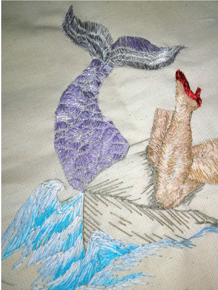
Figura 23. Bordado, Sireno, 2023.