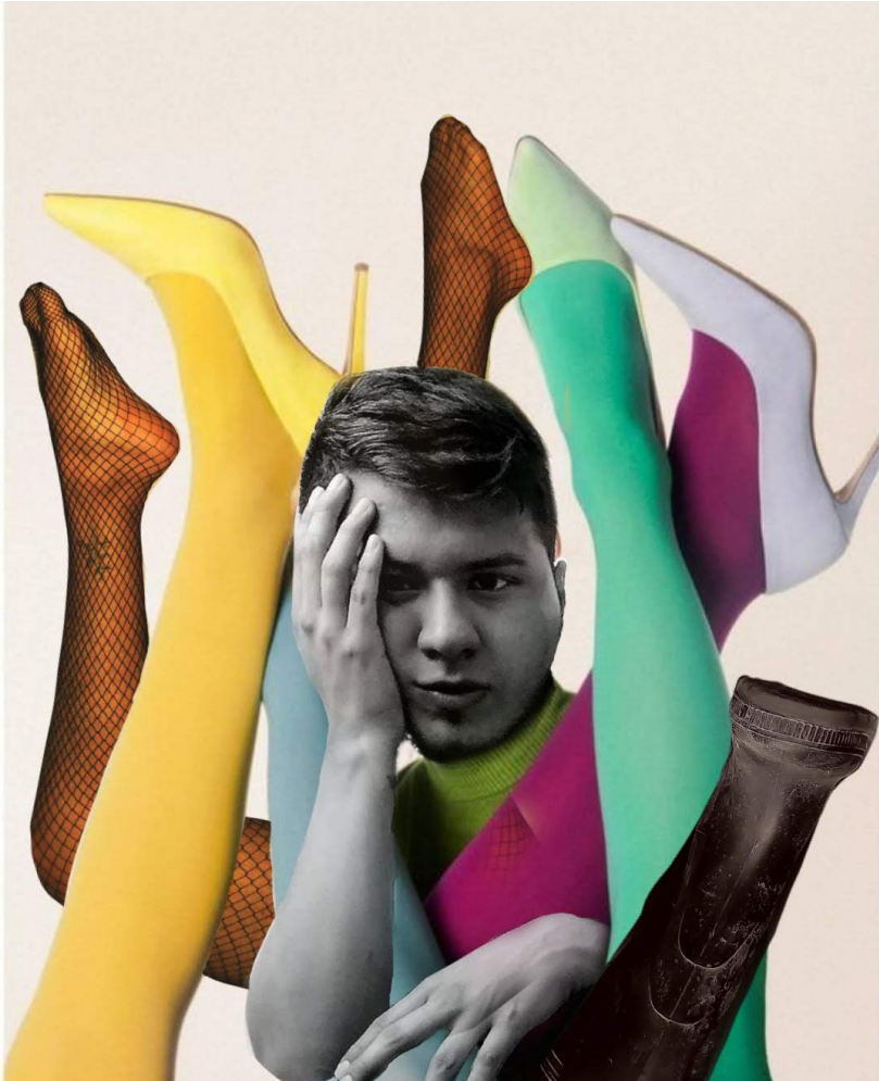
Figura 12. Fotografia, collage digital, 2021.