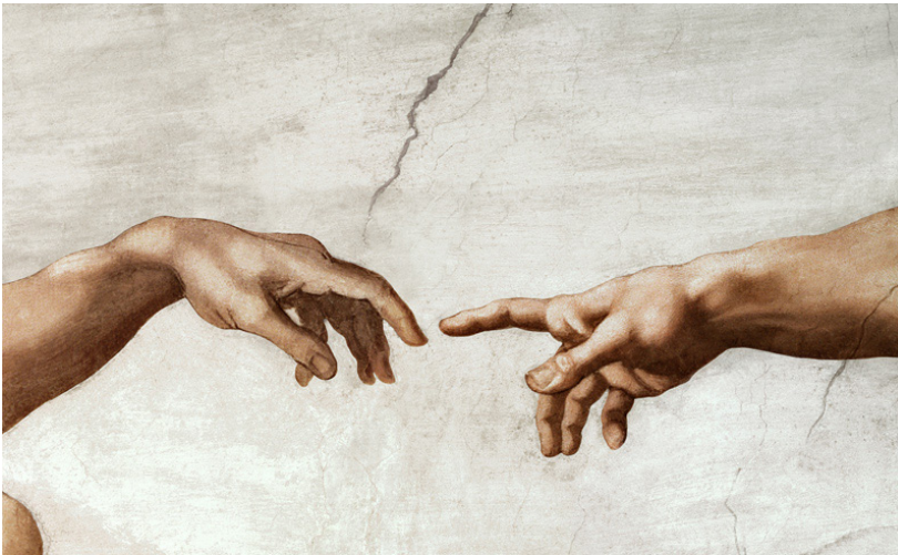
Figura 17. La creación de Adán, Miguel Ángel, 1511.

hace referencia al génesis, en el cual Dios da vida al primer hombre creado en la tierra. En ella se puede ver la divinidad del creador que está a punto de tocar el dedo de Adán, pero separados por una mínima distancia. Aunque hay diferentes interpretaciones acerca de este fragmento de la pintura, dentro de las creencias religiosas se habla de que si ambos dedos no se unen es porque Dios siempre busca llegar al hombre, pero Adán manteniendo el dedo curvado como un ser de libre albedrío es quien decide si llega a Dios o no.