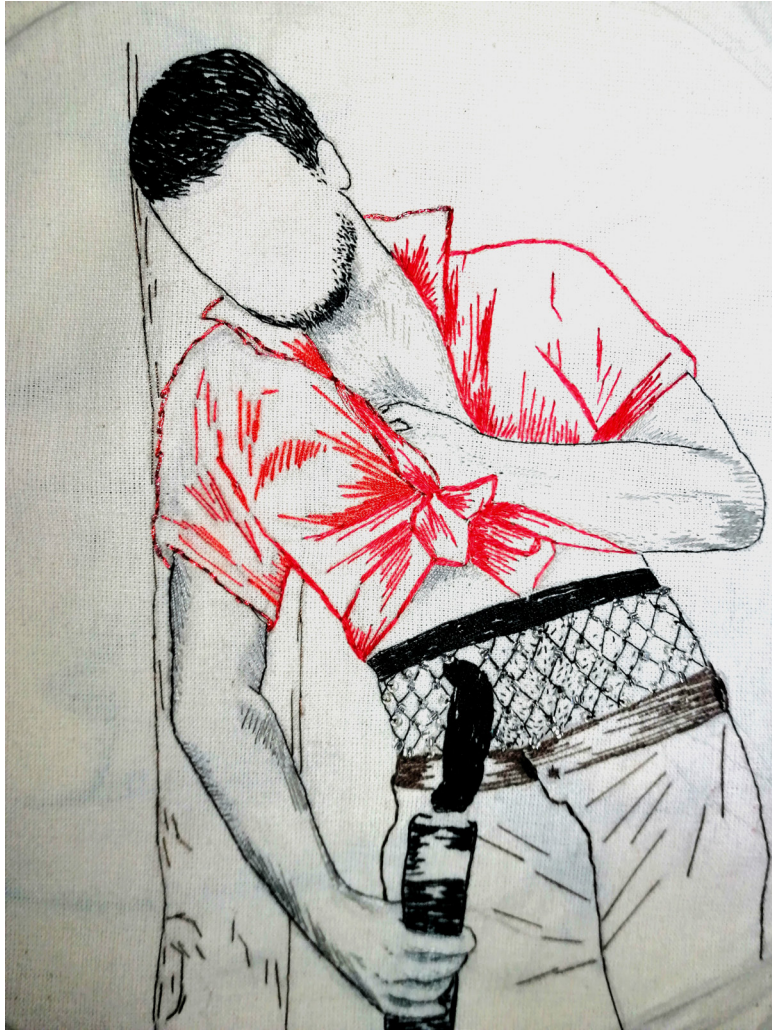
Figura 5. Serie campesino, bordado, 2022.