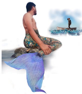
Figura 22. Edición collage digital, 2022.