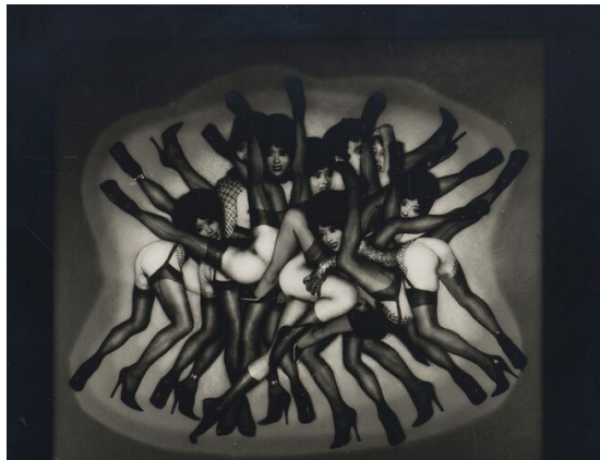
Figura 10. Grande méléé, Pierre Molinier, 1968.

David Ramos (2019), nos da a conocer los límites del cuerpo y las formas de experimentarlo, observando sus fotografías con temática homosexual y travesti del artista Pierre Molinier, quien en la década de los sesenta y setenta, por medio del retrato y fotomontaje análogo, muestra un cuerpo andrógono, se vivencia el placer y lo erótico por fuera de la norma.