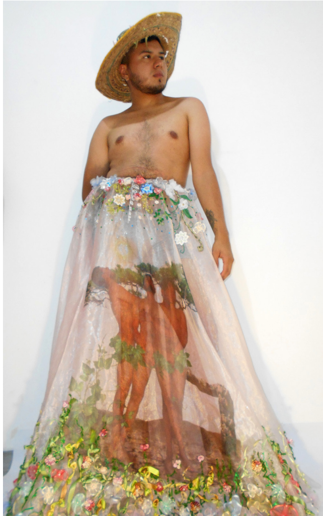
Figura 20. Fotografía digital, 2022.