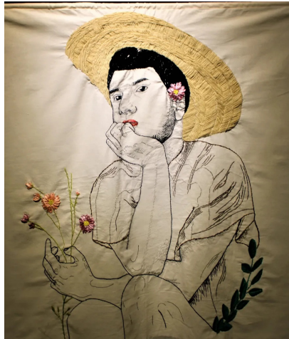
Figura 9. Campesino, bordado, 2022

Para elaborar cada bordado tomé una serie de fotografías, realicé un proceso de edición y collage digital, ya que esto me permite generar nuevas piezas para la imagen, como tener flores o falda, sin tener que usarlas al momento de tomar la fotografía. Transferí las siluetas de las imágenes al lienzo, creé líneas que me sirvieron de guía para bordar cada trabajo.