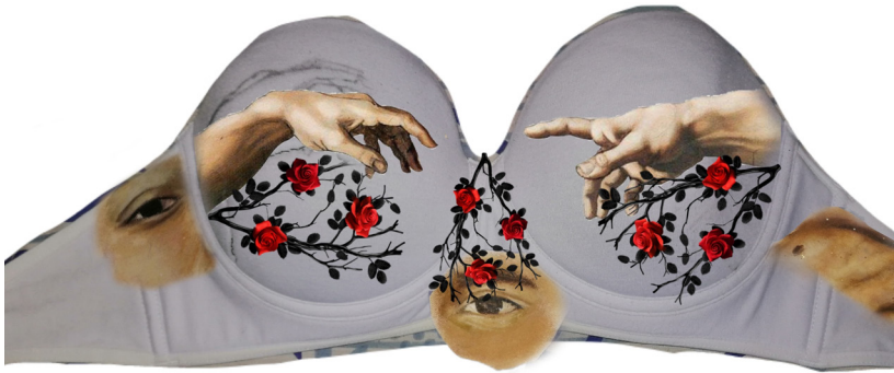
Figura 16. Pieza superior, La novia, diseño digital, 2022.

Para el diseño del vestido hice collages digitales. Uní fragmentos de pinturas al óleo que realicé de mi cuerpo. Con la guía de un boceto, inicié la construcción de la pieza superior del vestido. Para crear esta obra, utilicé un brasier totalmente blanco, le cosí las piezas pintadas en óleo, además utilicé materiales como mostacilla y aplicaciones de piedras brillantes.