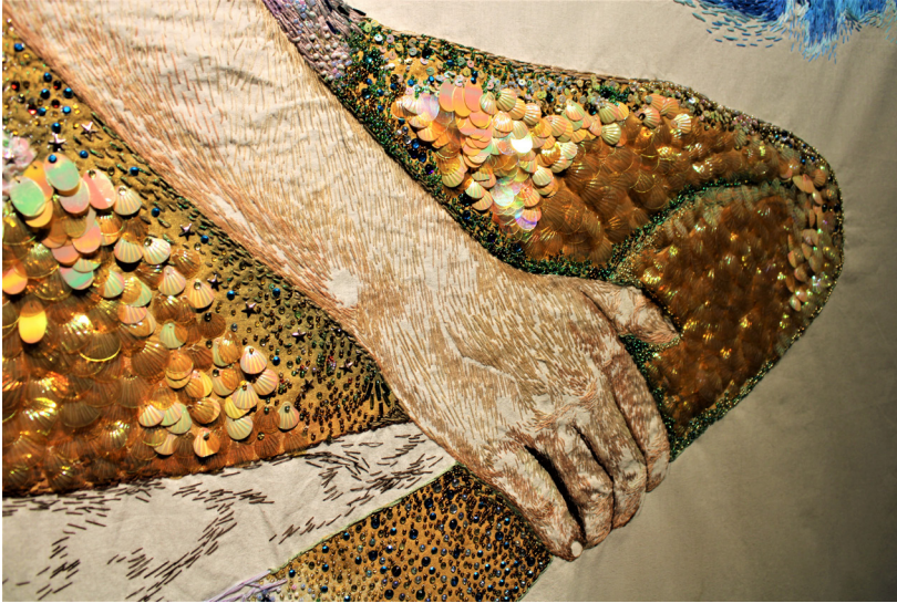
Título: El sireno Autor: Jhan Carlos Acosta Técnica: bordado sobre lienzo Medidas: 177cm x 198 cm Año: 2023