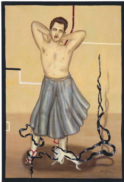
Figura 4. Te voy a lavar con jabón, Julio Galán, 1995.

Uno de mis referentes artísticos es el pintor Julio Galán (Muzquiz, Coahuila, 1959 – Zacatecas, 2006).