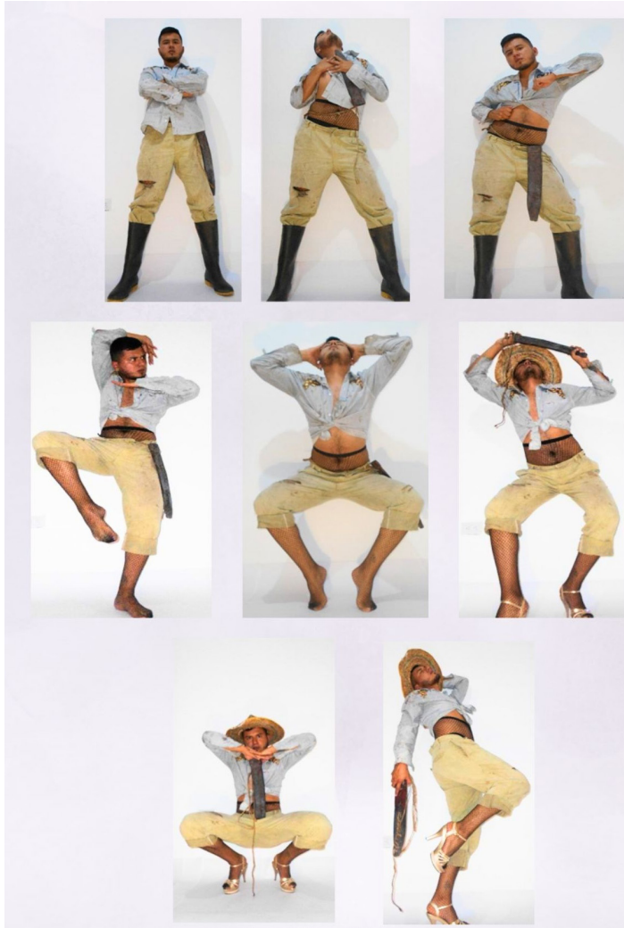
Figura 14. Registro fotográfico, acción performática, En tacones, 2023.