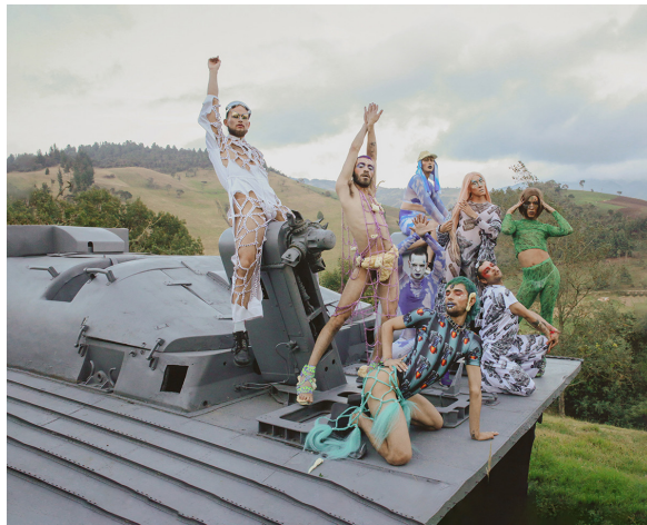
Figura 13. Fotografía digital, Tupamaras, 2020.

El Vogue es un estilo inspirado en la revista de moda. Imita las poses de las modelos que aparecían en ella, este baile es realizado por las personas pertenecientes a la comunidad LGTBIQ+, donde el principal objetivo es la libertad de expresión. El colectivo Tupamaras, me han ayudado en este proceso de investigación-creación, puesto que en ellos encuentro la sensualidad y la pose como formas de expresión.